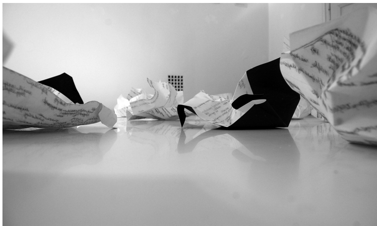
Csend – nincs válasz – részlet, vegyes technika, 2011

Az alábbi vázlatos és hevenyészett fejtegetés kísérlet próbált lenni annak bizonyítására, hogy a hálózatos megközelítés mennyire perspektivikus lehet az irodalomtörténet-írás számára, illetve ha egy adott téma, mint például az irodalom és nemiség paradigmaticus változások folyamatait próbáljuk megközelíteni. Az irodalomtörténet-írás hálózatelméleti irányú újragondolása minden bizonnyal sokkal meggyőzőbb eredményekkel is szolgálhat majd a jövőben.