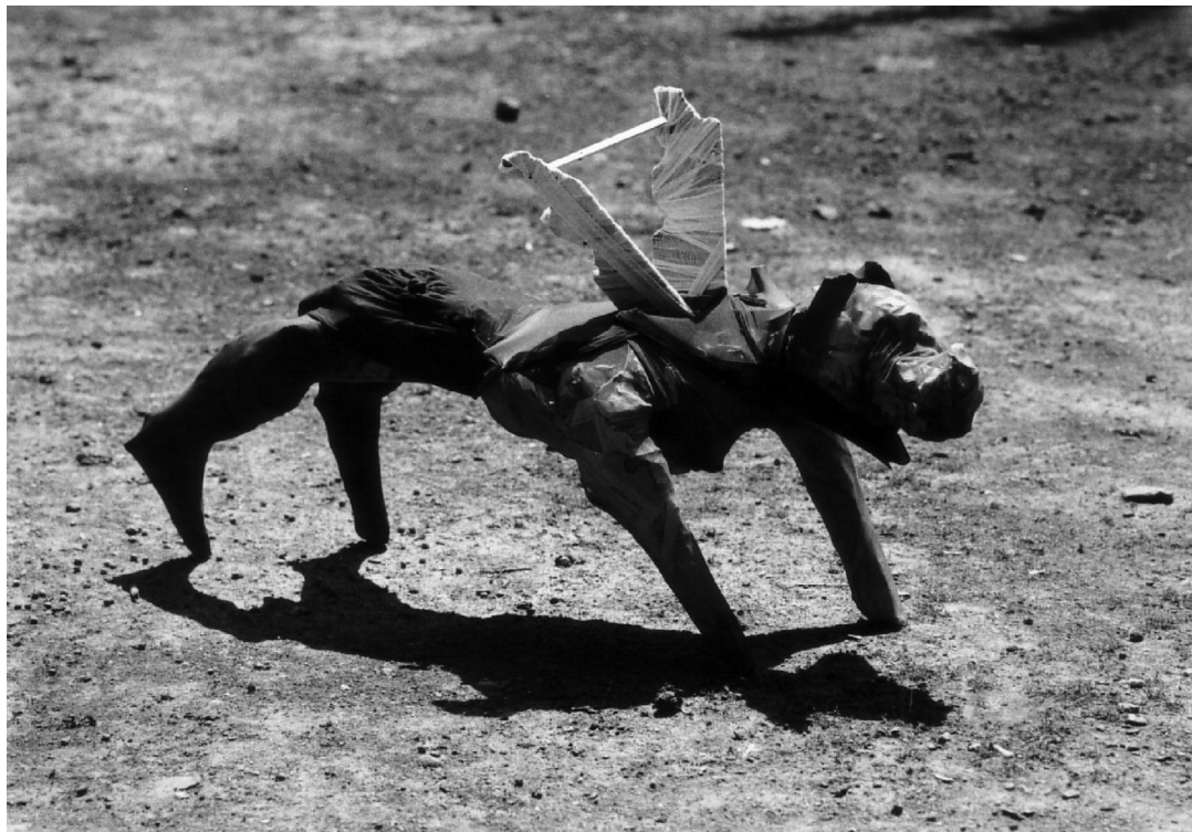
Hadikutya, Akció, Székelykeve, 1988