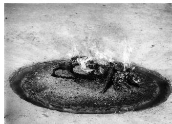
Hadikutya, akció, Székelykeve, 1988