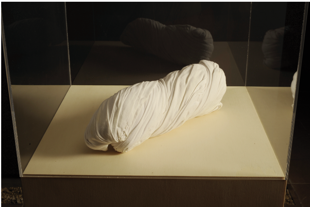
Szárász installáció-modulok (Ana Lupaşnak), installáció, 2012.