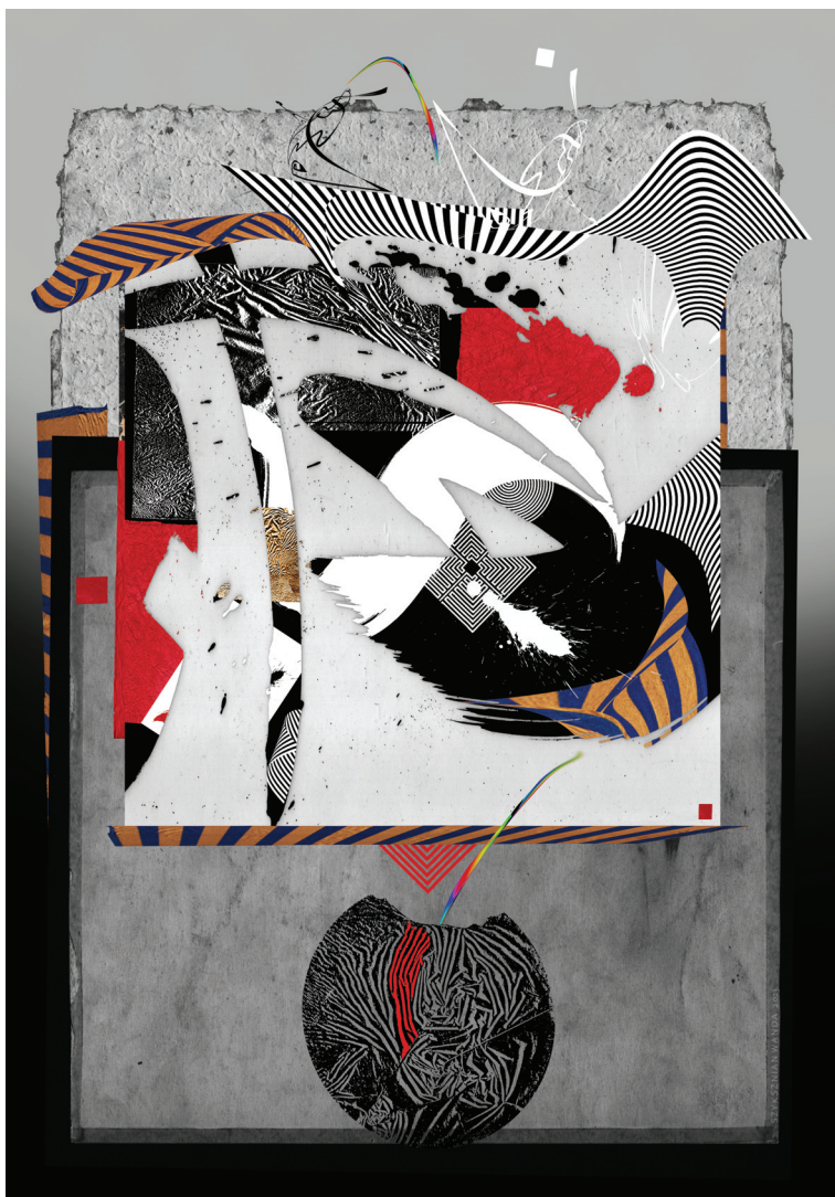
Szyksznian Wanda: A magasban