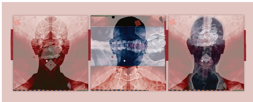
Szyksznian Wanda: Triptichon – Diagnózis

Tudtam, hogy gyenge vagy, tudtam, hogy nem bírod ki! – szólalt meg bennem egy hang. Sajnos igaza van, s ha most még ezek után is szellemes akarok lenni, akkor azt mondom, persze nem az én agyamból pattant ki a gondolat, hogy „olyan sokat olvastam arról, hogy milyen veszélyes a dohányzás, hogy megrémültem, és abbahagytam az olvasást”.