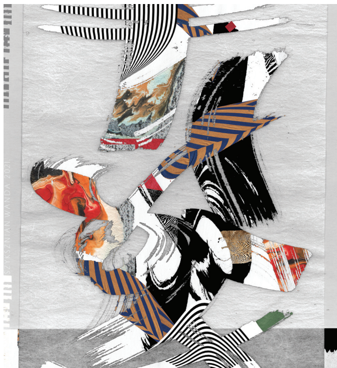
Szyksznian Wanda: Repülés