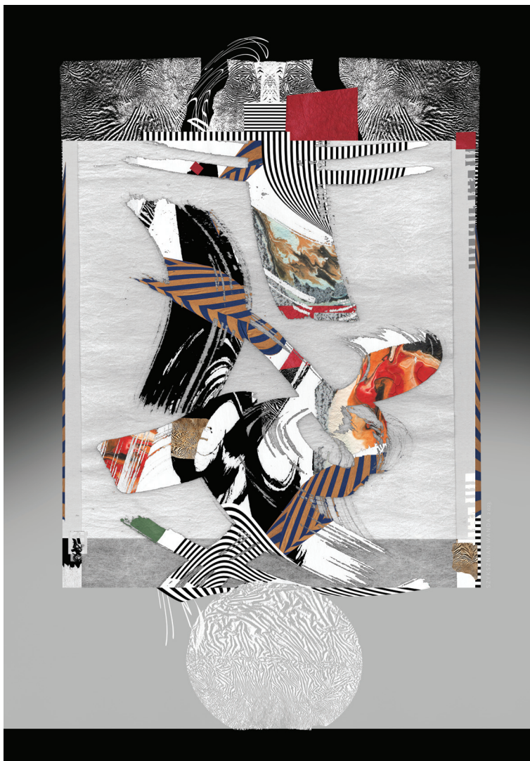
Szykznian Wanda: Fent

Lassan esteledik, az ónszínű levegő mintha pókhálót vonna a három Bögi lány köré. Ők pedig ülnek a padon, egymás mellett, nem szólnak, nem mozdulnak senki felé. Mereven ülnek, néznek csak maguk elé, mintha furcsa, érthetetlen szeszéllyel ilyen felfoghatatlan, élő anyagba véste volna be paradox mozdulatlanságát a rohanó idő.