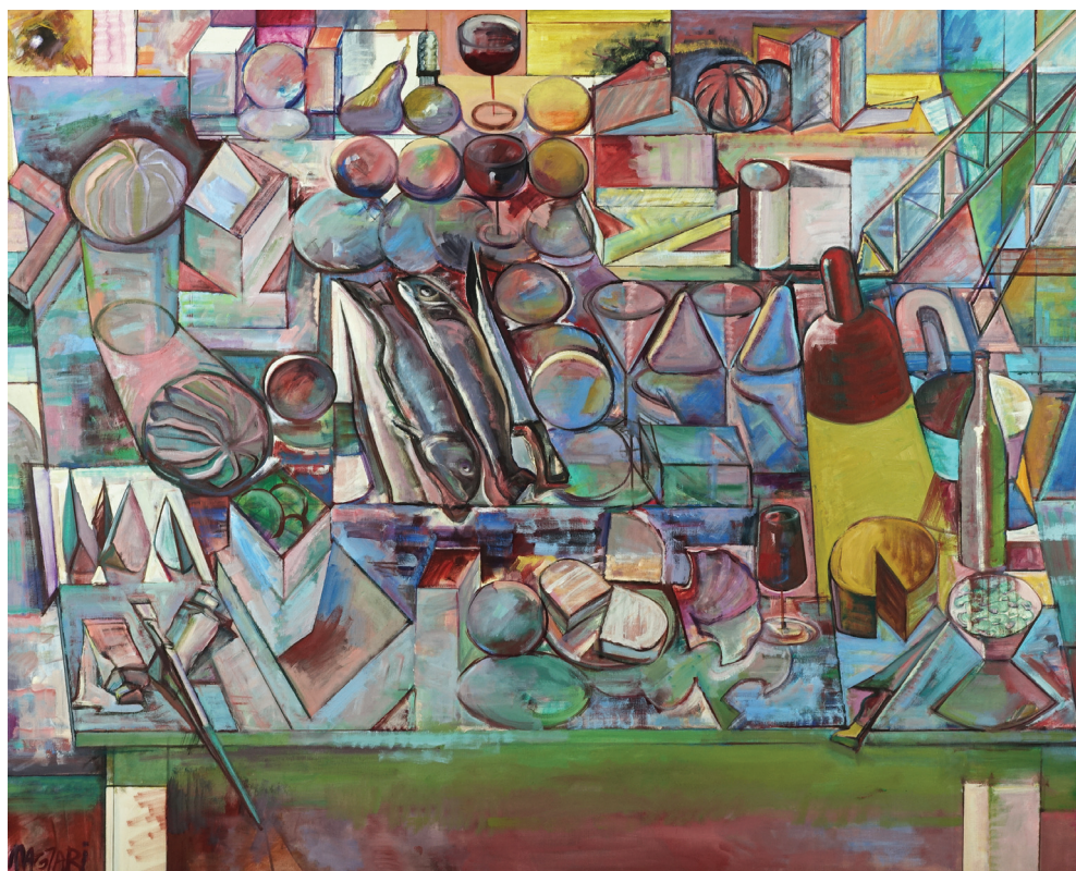
Magyari Márton: Asztal (2007)

Mindjárt éjfél. Felkapom a középső szofit, az utolsó szál gyufát, és kabát nélkül megyek ki az erkélyre, amíg tart a híd.