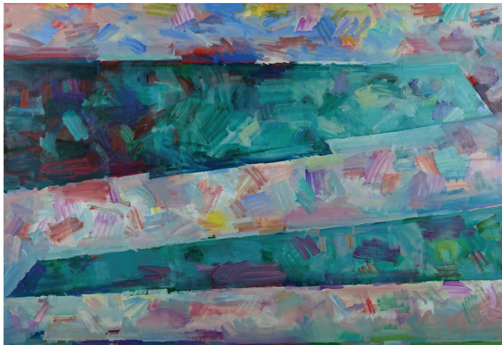
Magyari Márton: Távoli partok-1 (2022)

(A Pegazus alkotópályázat próza kategóriájának 2. helyezettje)