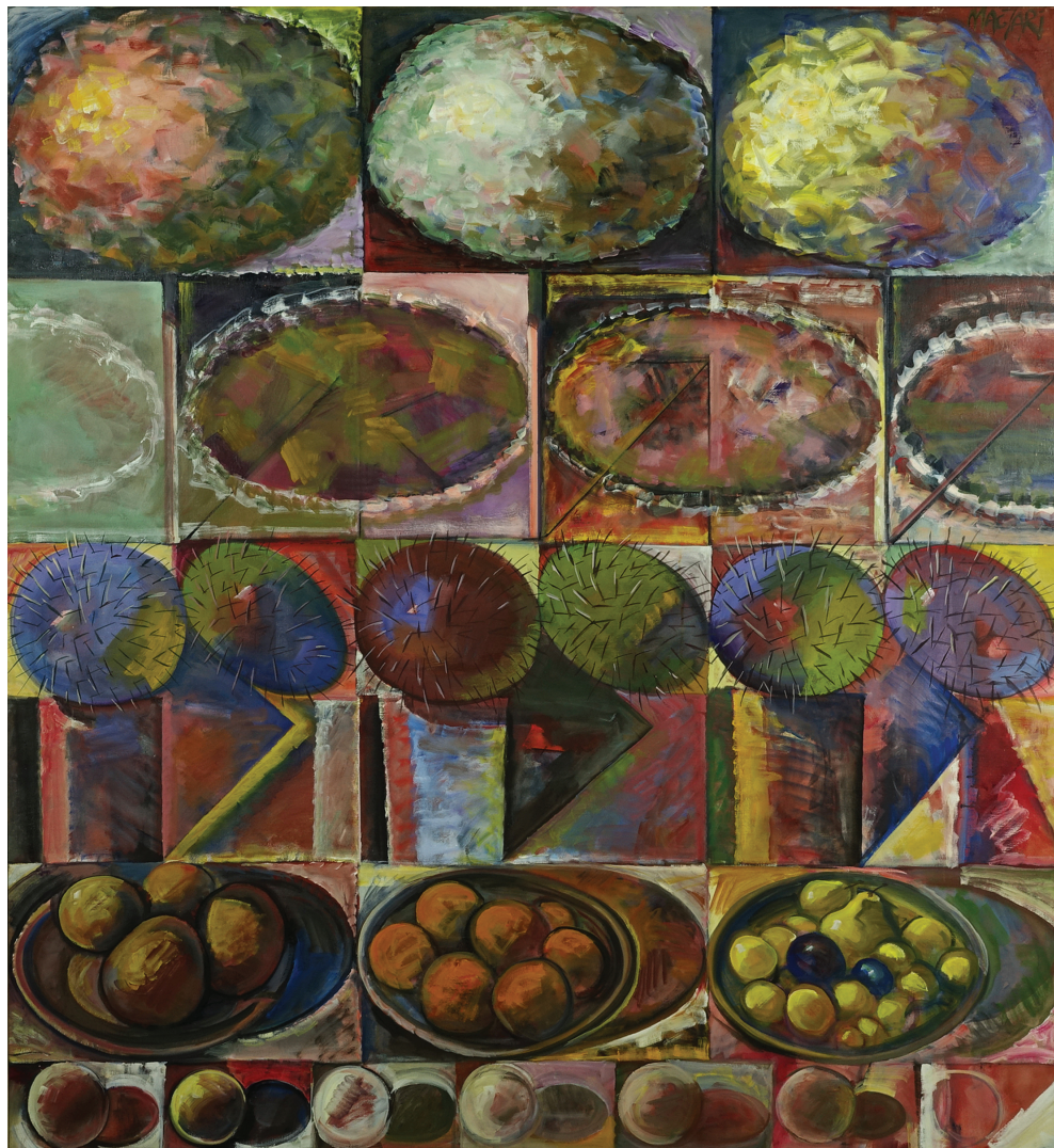
Magyari Márton: Gömbakácok és más kerek formák (2014)

(A Pegasus alkotópályázat líra kategóriájának 3. helyezettje)