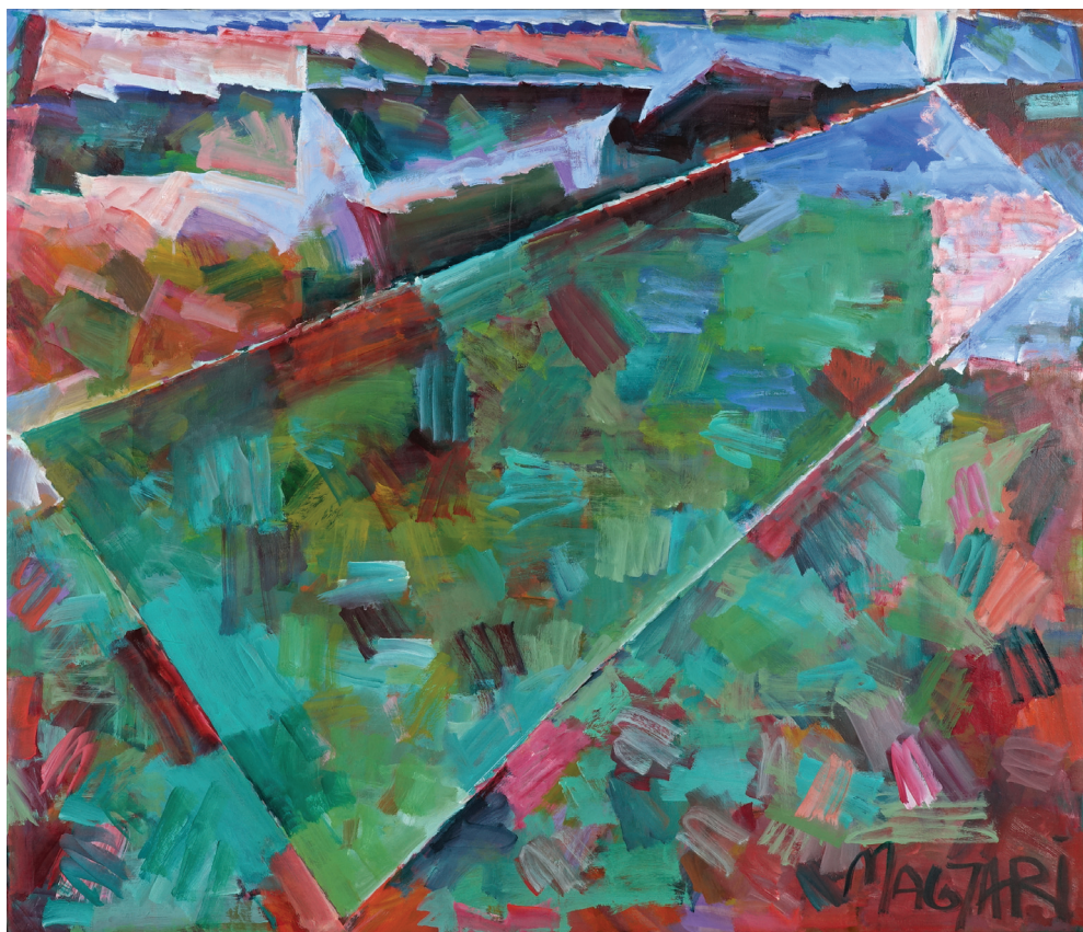
Magyari Márton: Szántóföld (2023)

A valódi valóságot tehát egyikünk se tudná pontosan elmesélni, mert mindig csak magunkat írjuk, ő természetesen jobban, mint én, és főleg sokkal szofisztikáltabban, ha szabad ilyen kifejezéssel zárni ezt a valamiféle verset.