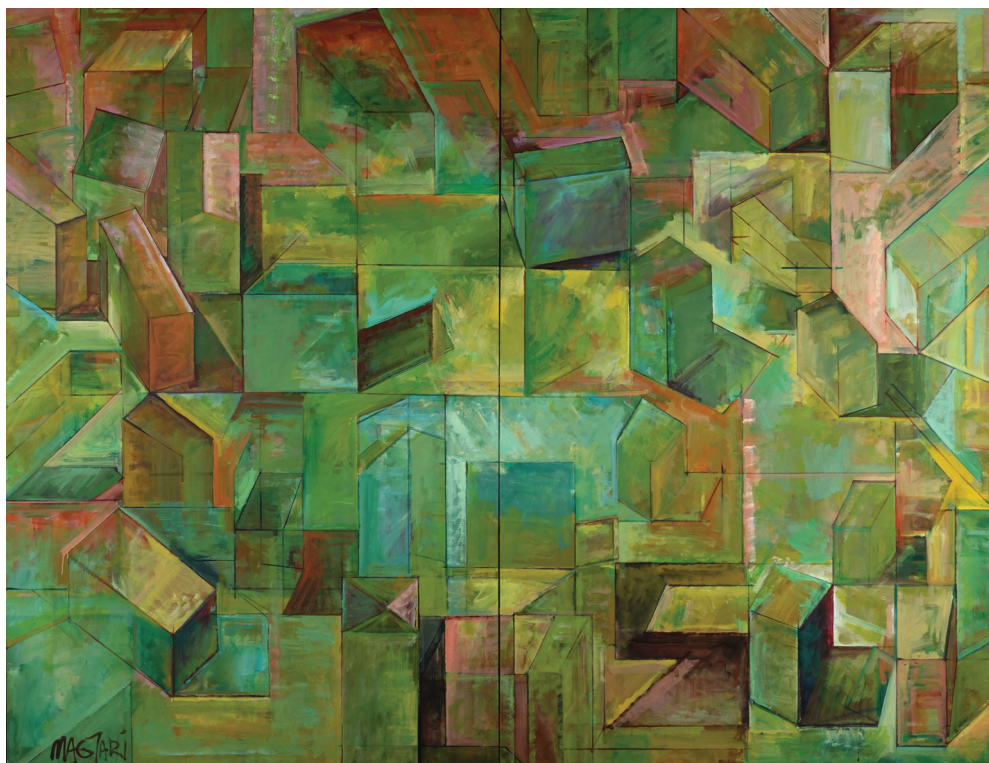
Magyarai Márton: Repetitív táj – Bádogvilág 2. (2003)

Üvegcsontjaidat immár a szilánkok tartják egyben.