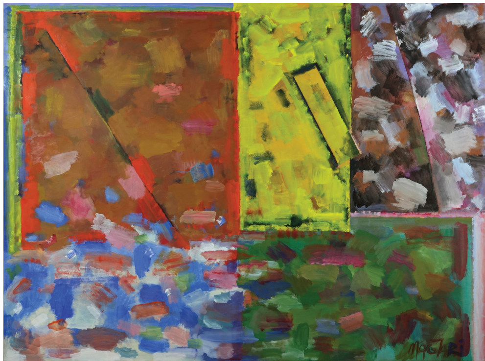
Magyari Márton: Öttételes Kép-II. (2015)