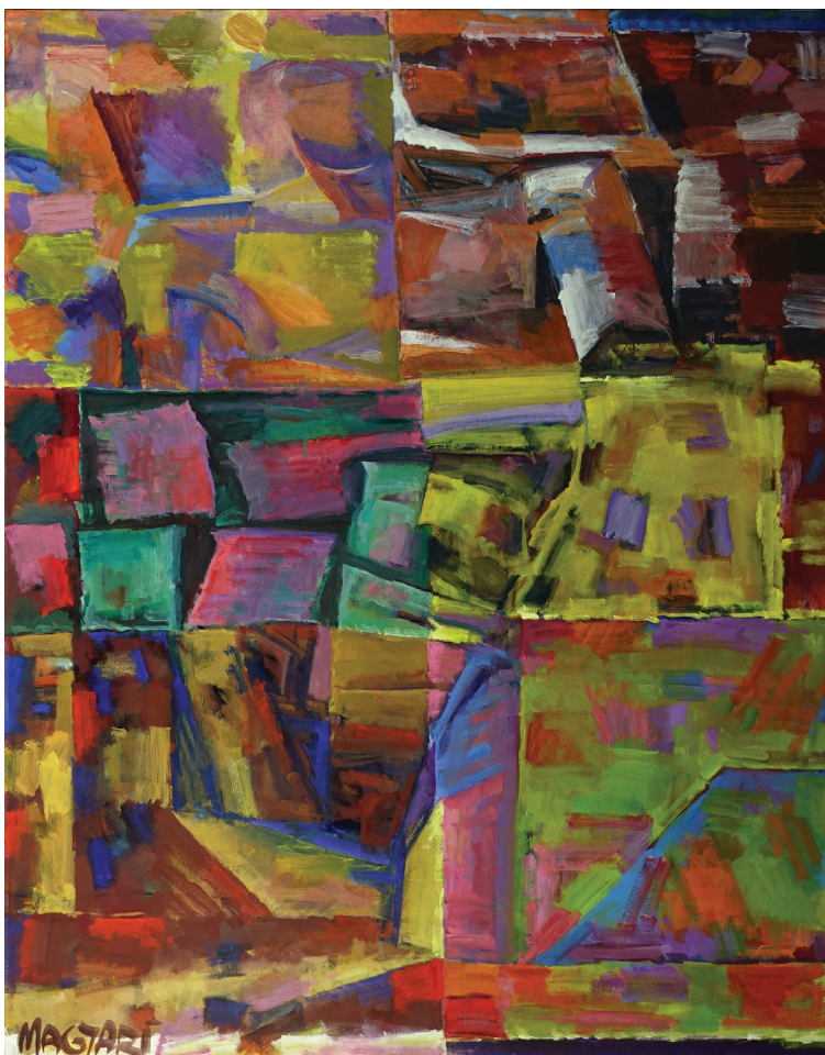
Magyari Márton: Torzó (2021)