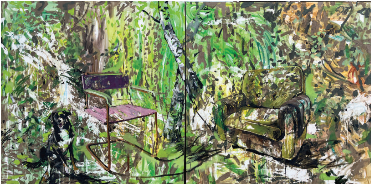
M. Kiss Márta: Helyet foglalasz (2023)

havat lapátolnak a ház előtt, esetleg később, amikor korosabbak, s nézik a kék fényt, hallgatják a szabó családot, levelet írnak, süteményt készítenek a gyerekeknek, unokáknak. ha lesz egyáltalán gyerekük. de nem képezem el őket. vagy csak ennyire. inkább kinézek az ablakon, felhős, szürke lesz az ég. sötétedik, égnek az utcalámpák, s a csupasz januárban a fák gallyai mögött látszik a vártemplom tornya a kivilágított órával. amikor ideköltözünk, nyáron is látni a tornyot, még nem fedik el az egyre magasabb fák, a harangszó sem ütközik az időközben megterebélyesedő lombokba, amíg ablakunkig ér. és húsz évvel később még mindig lesz ez a két négyzetméternyi sarok: szék, íróasztal. számítógép, benne majdnem az egész világ, majdnem az összes ismerősöm. balra szabálytalan ablak, azon túl a város. ez a ház elég öreg lesz már, amikor elgondolom, hogy ebben a szobaszögletben, mielőtt ideköltözünk, milyen bútorok lesznek, kik néznek ki az ablakon, mi fáj nekik, minek örülnek, mit gondolnak a jövőről, s vajon elképzelnék-e minket, akik utánuk lakunk majd itt, s elképzelik-e azokat, akiket én képezek, hogy utánunk.