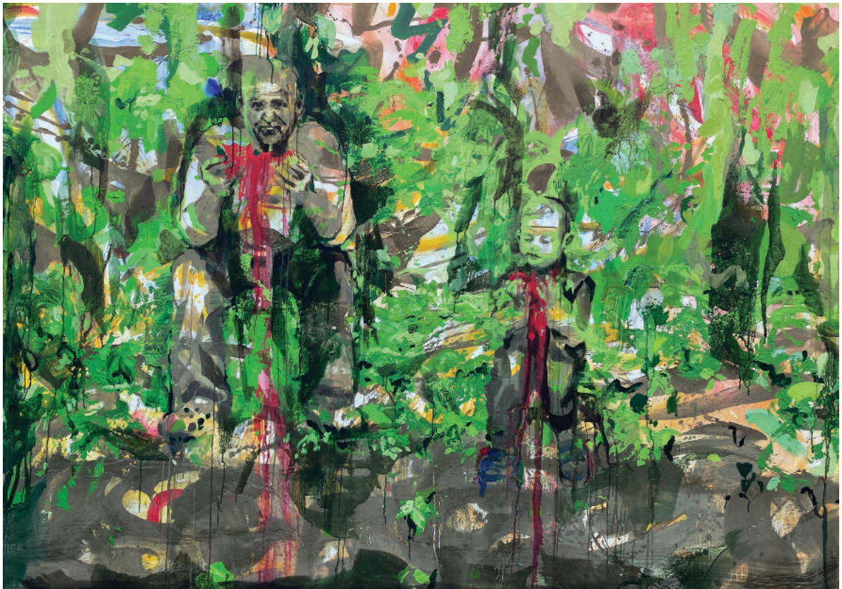
M. Kiss Márta: Dinnyeevés (2021)

Összességében a film által megjelenített társadalomkritika arra ösztönzi a nézőket, hogy gondolkodjanak el az oktatási rendszer strukturális problémáin, és azon, hogyan lehetne támogatóbb és inkluzívabb környezetet teremteni mind a pedagógusok, mind a diákok számára.