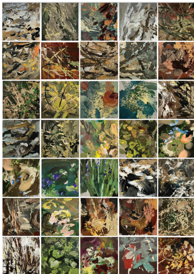
M. Kiss Márta: Növényidő – részlet (2020–2023)

(Budafok, 2024. március 1. – március 12.)