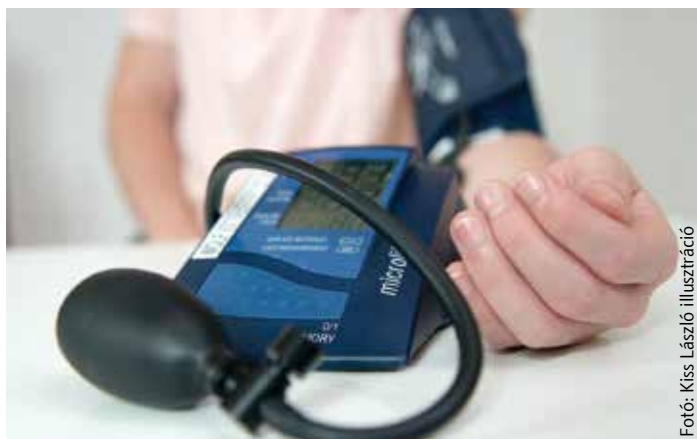
Fotó: Kiss László illusztráció

„Szeretnénk kibaszálni a futballtorna adta lehetőséget arra, hogy népszerűsítsük a tömegsportot és az egészséges életmódot. Reméljük, hogy a karácsonyi ünnepek alatt felszedett plusz kilók miatt sokan kapnak kedvet a mozgásra. Erre remek lehetőségeket biztosítunk majd a tornán, ahol a foci mellett a család apraja-nagyja találhat kedvére való elfoglalt-