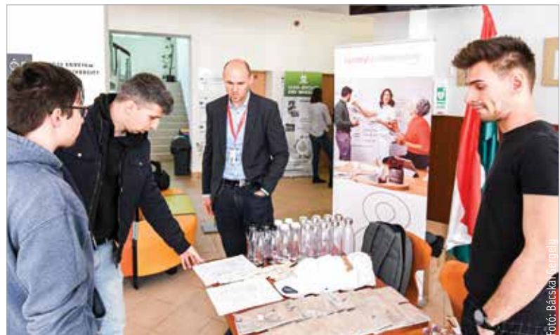
Az intézmény duális vállalati partnerei közül számos cég mutatta be gyakorlati képzési kínálatát a leendő egyetemistáknak