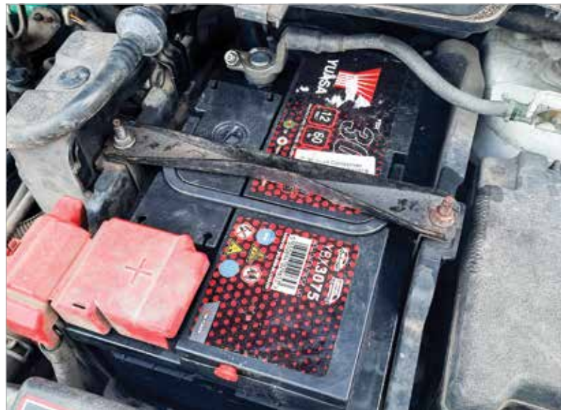
A téli hideg után előfordulhat, hogy az akkumulátor töltésre szorul, ez indításkor kiderül

ráségíteni! Ha már ez is kevés, akkor viszont marad a csere. Az utastér is mostoha körülmények között van hidegben, ilyenkor ugyanis csak ritkán takarítjuk ki alaposan járművünket. Most viszont jobb, ha nem spórolunk a porszívózással, illetve aki gumiszőnyeget vagy hótálcát használ telente, berakhatja a szövet lábelőket! A klímát ajánlott legalább hetente egyszer bekapcsolni télen is, viszont ha ez elmaradt, vagy úgy érezzük, hogy csökkent a hatékonysága, akkor a légkondicionálót is nézessük át! Ha szükséges,