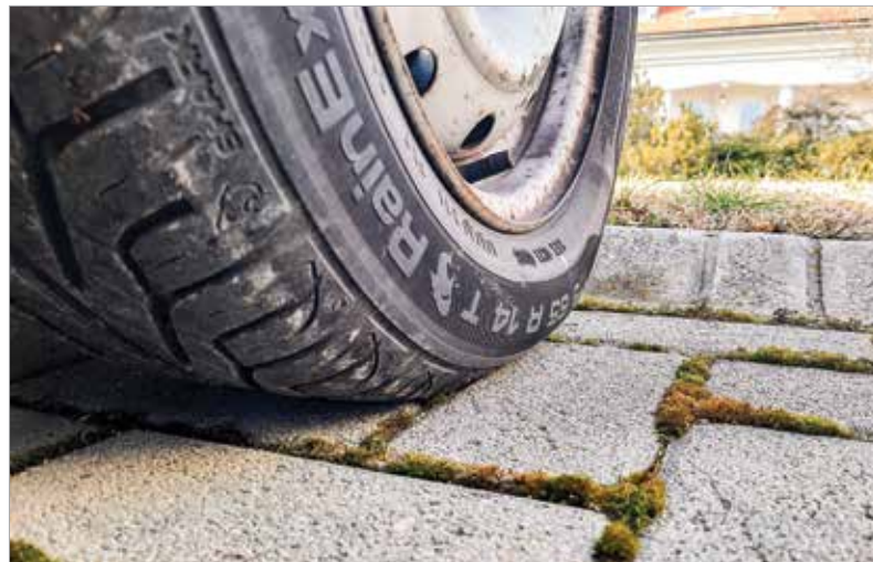
A téli gumik szezonjának vége, de csak megfelelő állapotban lévő nyáriakat tegyük fel helyettük!

ban is aranyat ér! És végül egy alapos külső mosás sem árt! Ne spóroljunk a habbal, főleg, ha hónapok óta csak a csapadék tisztította az autót!