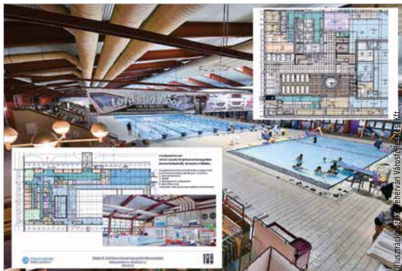
A teljes energetikai felújításon túl komoly funkcióbővítést is tartalmaz a múlt csütörtökön bemutatott terv

A felújítás terveiről készült prezentáció a város honlapjáról, a www.szekesfehervar.hu oldalról tölthető le.