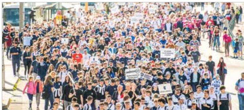
A Petőfi parktól a Bregyó közig tartó hagyományos felvonuláson idén is több ezer sportoló vett részt