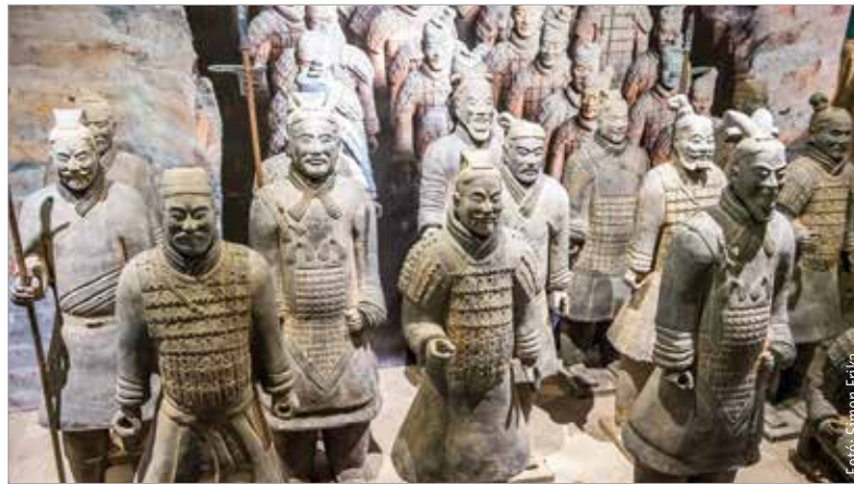
A kiállítás augusztus tizenkilencedikéig látható Gorsiumban

Mára kiderült, hogy mintegy kétezer-kétszáz éve összesen négy árktól ástak az agyaghadsereg számára, melyekben a becslések alapján nagyjából nyolcezer szobor lehet – a régészeti feltárások napjainkban is folynak. A föld alá temetett hadsereg, mely