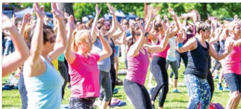
Az atlétikai centrumban a profik és a kezdő mozgolódni vágyók idén is együtt edzhettek