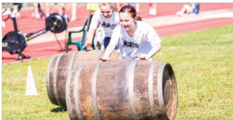
Nemcsak bemutakoztak a sportágak, de ki is lehetett azokat próbálni