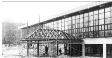
Harmincöt éve nem történt komolyabb fejlesztés az intézményben

Az elmúlt harmincöt évben a kisebb karbantartásokat leszámítva komolyabb fejlesztés nem történt a Csitány G. Emil Uszodában, annak komplex felújítása már évek óta