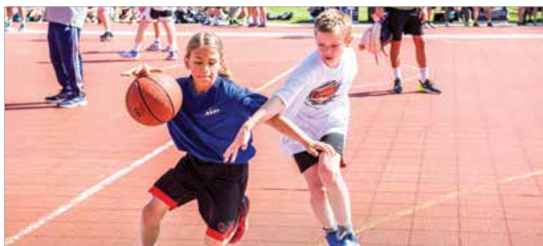
A korosztályok és nemek alkotta streetballcsapatok versenyében családok közötti mérkőzések is szerepeltek