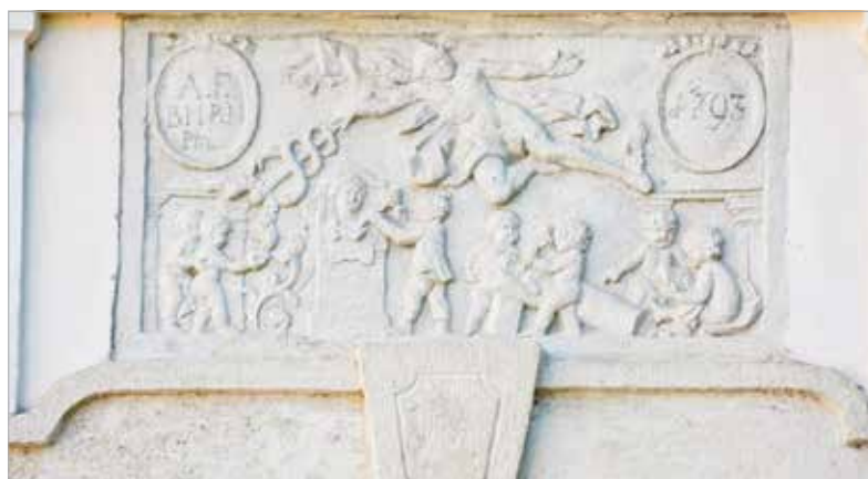
Az alkotást húsz éve restaurálták, most is teljes szépségében látható

Andreas Fligl további fehérvári alkotásai a Püspöki Palotát díszítik.