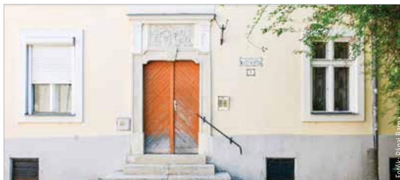
A ház műemlékvédelem alatt áll

így is nyilvántartja tíz alkotását, melyek közül hat Székesfehérváron található. Az egyik legismertebb ezek közül éppen a korábbi házán látható. Nyugodtan kijelenthetjük, hogy a bejáratot díszítő, Kőfaragó névre keresztelt domborművet saját magának készítette a művész. Az alkotás 2004-ben restauráláson esett át, így napjainkban is nagyon szép állapotban van. Erdemes elidőzni részletgazdag kidolgozásán, a kor szellemét visszaidéző hangulatán. A Kőztérkép így írja le az alkotást: „A kőfaragó a ház bejáratú ajtá-