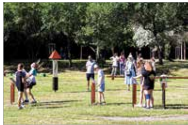
A Rácbánya mellett található, örökös ökoiskola címet elnyert Zentai úti Általános Iskolának és a közelben lévő oktatási intézményeknek is hasznos szabadtéri tanulási lehetőséget biztosít a terület