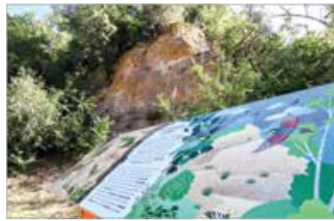
A Városgondnokság tavaly egy madárodútelepet is létrehozott, idén tavasszal pedig denevérodúkat helyeztek ki a Denevérbarát Fehérvár program keretében

Cser-Palkovics András polgármester kiemelte, hogy egy korábbi bejárás keretében döntött a városvezetés a szakemberekkel közösen