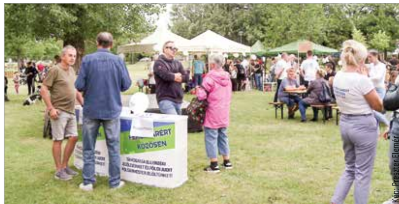
A nap folyamán gyerekprogramok várták a kapcsolódni vágyókat, az egyesület standjánál pedig támogató aláírásokat gyűjtöttek

Földi Judit hozzátette: szeretnék e mellett a gyermekek védőoltását támogatni a gyermekorvosok bevonásával. A polgármesterjelölt azt is elmondta, hogy van egy jótanulópogramtervük: ha lakai 4,8-es átlag felett teljesít az iskolában, azt megjutalmazná a város, jelezve, mennyire büszkéek rá.