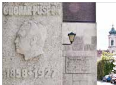
A több mint tizennégy méter magas emlékmű több részből tevődik össze, egyik eleme a Prohászka-emléktábla

pártolója, az egyházmegye puritán, közvetlen, tevékeny és adakozó püspöke. A német és a magyar mellett szlovákul, latinul, franciául, ógörögül és héberül is beszélő Prohászka Ottokár huszonkét éven át, 1927-ben bekövetkezett haláláig állt az egyházmegye élén. Halála után mindössze pár évvel megkezdődött emlékművének kivitelezése a Vár körúton. Erről a Köztérkép így ír: „A Prohászka-emlékművet 1938-1943 között készítették. Az angyal figurája bal kezét magasba emeli, talpzata a városfalat lezáró kőpillér. A pilléren lejjebb Prohászka Ottokár domborműve látható. A várfal