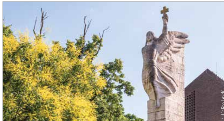
Ohmann Béla és Weichinger Károly alkotását a köznyelven Balkezes angyalként emlegetik. Lehetne ez akár dehonesztáló megnevezés is, de inkább az alkotás és témája iránti elfogadást, szeretetet tükrözi a város népe részéről.

mögötti Püspökkert kovácsoltvas kapuja szintén az emlékmű része. A kapun Prohászka Ottokár és Shvoy Lajos püspökök címere látható. A kapu felirata: Szent István városa lánglelkű Ottokár püspök emlékére. Anno domini 1941.” Érdekes, hogy az emlékmű esetében nem kizárólag Ohmann Béla nevét kell feljegyeznünk alkotóként. A rendkívül összetett, több elemből álló alkotás megva-