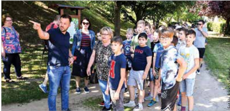
A több mint négyhektáros, a ráchegi Apatini utcából nyúló régi bányagödör az 1900-as évek elején nyerte el mai formáját