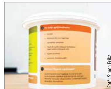
Az eddigi tapasztalat az, hogy a kukákban kevés a nem odaillő hulladék, mindössze egy-két százalék között mozog