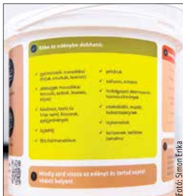
A konyhai zöld- és élelmiszer-hulladékot gyűjtő kukában sokféle szerves hulladék elhelyezhető

A konyhai zöld- és élelmiszer-hulladékot biogázüzemekben hasznosítják újra, így járulva hozzá a körforgásos gazdaság kiépítéséhez, hiszen megújuló energiaforrásként áramot és hőt állítanak elő belőle. A biogázüzemben képződő maradék ráadásul – magas tápanyagtartalma miatt – kiváló komposztanyagot képez a mezőgazdaság számára.