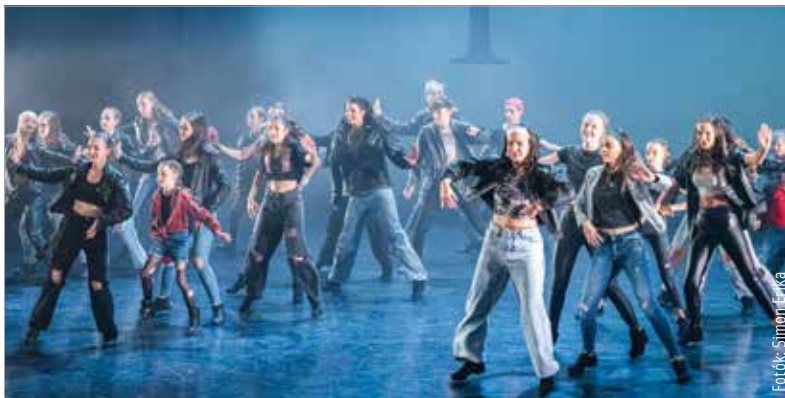
A Megadance Székesfehérvári Táncszínház-egyesület megalakulásának tizenötödik évfordulóját ünnepelték hétfőn a Vörösmarty Színházban