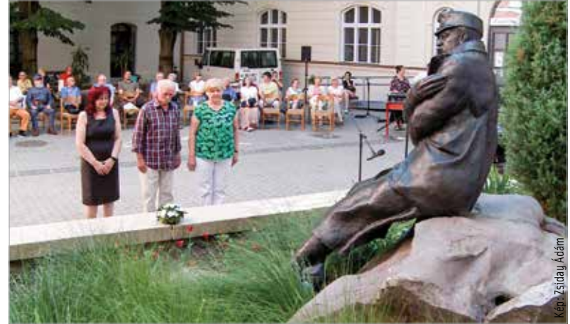
A hétfői ünnepségen a száznegyven éve született és százhet éve elhunyt költő emléke előtt tisztelgetek a résztvevők