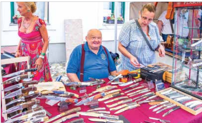
A legendás székesfehérvári Flaschner család mives kézműves termékei is nagy érdeklődésre tarthattak számot

legetek, majd a hagyományörzők felvezetésével vonultak át a résztvevők a Kézművesek Házához, melynek kapujára felszögezték a fesztivál emléktábláját. Az idei év újdonsága volt az a kiállítás, mely a huszadik évforduló