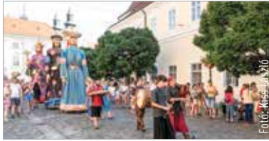
Idén is benépesül a belváros az Országalmától a Zichy ligetig

A Királyok a belvárosban elnevezésű sorozat évek óta nagyon népszerű, a szombati programokon minden alkalommal népes közönség gyűlik össze, hogy találkozzon a királyióriásbáb-család tagjaival, akik hétvégente