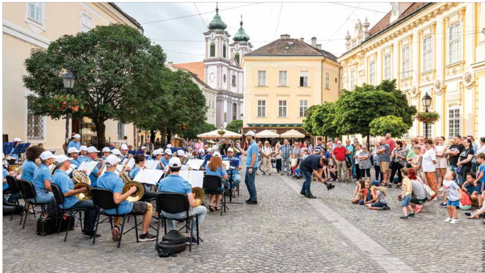
Lendületes dallamokkal szórakoztatta közönségét a fúvószenekar