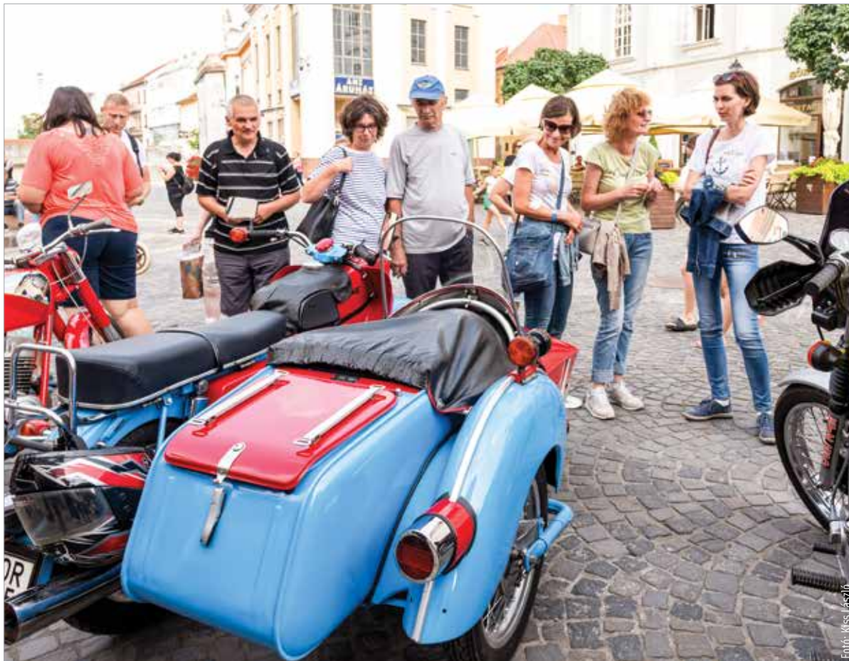
Régi járműveket is megcsodálhattak a járkelők a Városháza előtt

Az országos programot immár huszonkettedik alkalommal szervezték meg: négyszázhatvan helyszínen mintegy kétezer-nyolcszáz program várta az érdeklődőket.