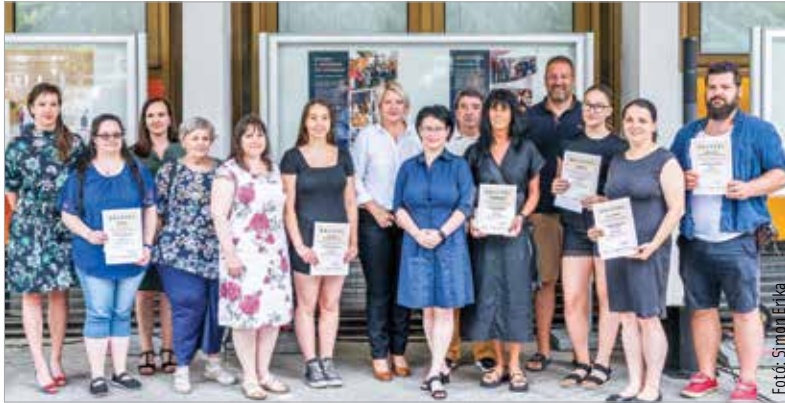
A tablókiallítás, mely az önkéntességre szeretné felhívni a figyelmet, július huszonötödikéig tekinthető meg