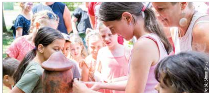
Mesélő szemre, fülre és szívre volt szüksége mindenkinek ahhoz, hogy bejárhassa az Illaberek Élményösvényt. A hét háziko kóddal nyílik, melyekhez ezúttal különböző feladatok megoldásával férhettek hozzá a játékosok, egyébként pedig egy e-maillen keresztül juthatnak hozzá azok, akik szeretnék természetközeli élményekkel gazdagodni.