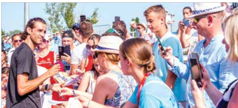
Miután a közönségkedvenc Gianmarco Tamberi melegítés közben megsérült, magasugrás helyett ezúttal autogram-osztásban jeleskedett. Amúgy is az a verseny egyik legfőbb vonzereje, hogy itt tényleg emberközönségekben vannak a sztárok!