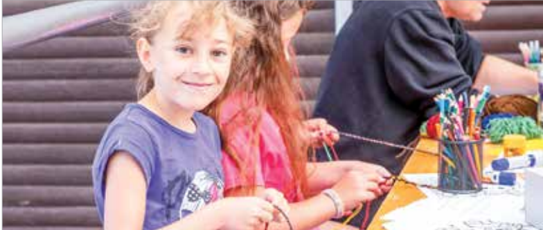
A kézműves-foglalkozások is hagyományosan a tábori program részét képezik

Idei harmadik turnusánál tart a Napraforgó Városi Napközis Tábor a Breggy közti Sportcentrumban, több mint kétszáz gyermek részvételével. A táborban minden nap lehet sportolni, pihenni, kézműveskedni, emellett hetente egy alkalommal a Székesfehérvári Rendőrkapitányság is bekapcsolódik a tábori életbe közlekedésbiztonsági és bűnmegelőzési programokkal.