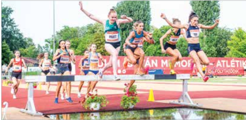
A vizesárok miatt talán volt, aki irigyelte az akadályfutókat

Székesfehérváron a Regionális Atlétikai Központ adott otthont kedden délután a Gyulai István Memorial – Atlétikai Magyar Nagydíjnak. A Bregyóban már tizenegyedik alkalommal rendezték meg a rangos versenyt, ahol számos olimpiai és világbajnok is indult. Érezhető volt, hogy már a párizsi olimpiára fókuszálnak a versenyzők.