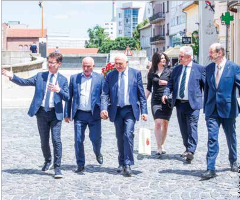
A városházi egyeztetést követően a belvárosban tett sétát az örmény delegáció, Székesfehérvár nevezetességeivel ismerkedve