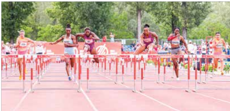
Az olimpiai bajnok Jasmine Camacho-Quinn (jobbról a harmadik) Fehérváron is igazolta klasszsisát: megnyerte a női 100 méteres gátfutást