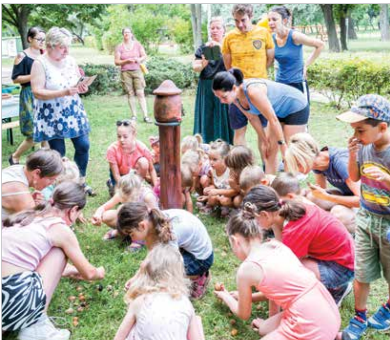
Az állomásokon olyan feladatok várták a résztvevőket, melyek közelebb hozzák őket egymáshoz, valamint a természethez. Az élményösvényt az Illaberek Erdőjáró Kártya mintájára alkották meg a Gárdonyi Géza Művelődési Ház környékén.