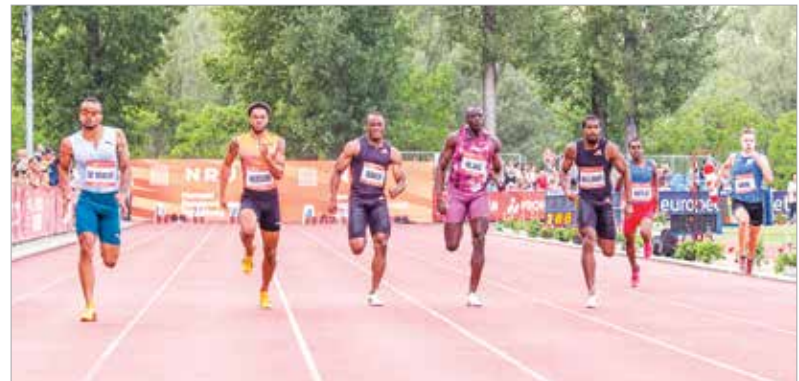
A férfi 200 méter befutója: a kanadai Andre De Grasse (bal szélen) húsz másodpercen belüli idővel nyerte meg a számot