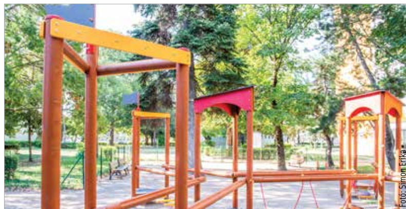
A játszóeszközöket a Városgondnokság szakemberei telepítették a biztonsági előírásoknak megfelelően