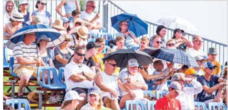
Elképesztő meleg volt, de így sem lehetett panasz az érdeklődésre az atlétikai centrumban