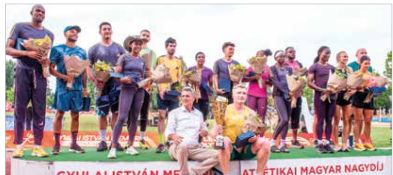
A végén ismét összeálltak egy fotóra a legjobbak, akik közül sokan nem először, és biztos nem is utoljára indultak el a székesfehérvári versenyen. Idén összesen negyvenhét országból jöttek atléták.