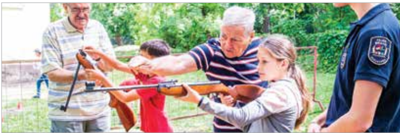
A Napraforgó Városi Napközis Tábor programjában minden nap szerepel a lövészet