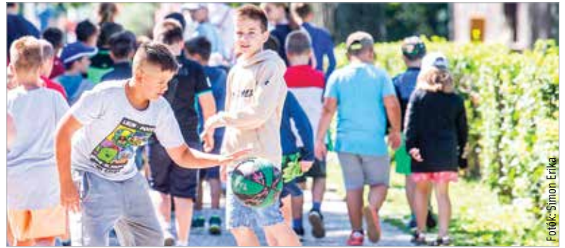
A Breggy közti Sportcentrum lehetőségeit kihasználva többféle sportban akár bajnokságot is rendezhetnek a gyerekek