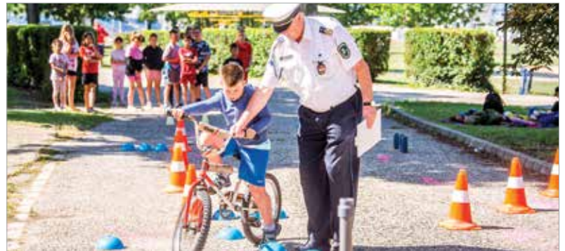
A Székesfehérvári Rendőrkapitányság hosszú éve óta játékos oktatással kapcsolódik be a programokba a gyerekek védelme, biztonsága érdekében