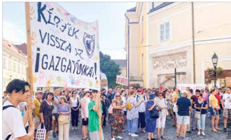
Egykori és mai vasvárisok szerdán délután tüntetést is tartottak a belvárosban