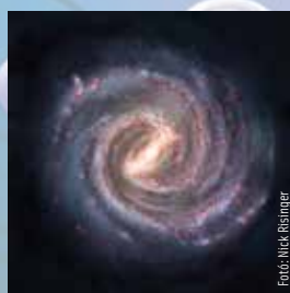
2024. júl. 25-31.

Szerencsére rugalmas ember vagy, de pont ezért nem érted azt, ami a hét elején zajlik. Emberek mereven ragaszkodnak bizonyos elképzeléseikhez, és emiatt csatároznak. Ne tarts velük, maradj ki a vitákból, és ami a legfontosabb, ne itélkezz!