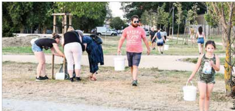
Gyerekek és felnőttek egyaránt vödört, öntözőkannát ragadtak, hogy vízhez juttassák a park fáit