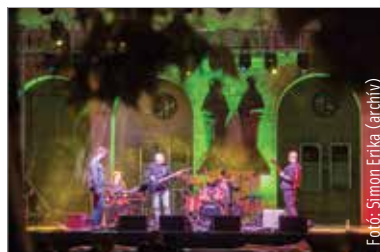
A Bartók Béla tér évek óta közkedvelt helyszíne a zenei fesztiválnak

Idén már tizenegyedik alkalommal szervezik meg a korábbi hagyományokat újraélesztő Alba Regia Feszt koncertjeit: augusztus nyolcadika