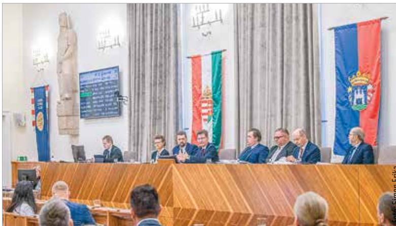
Első rendes közgyűlését tartotta a város új képviselő-testülete

Első napirendként vitatta meg a közgyűlés a saját működési kereteit meghatározó Szervezeti és Működési Szabályzatot. A törvényi előírások szerint az új önkormányzati ciklus első rendes ülésén kell ezt elfogadni: „Az országban ez számos helyen nem sikerült. Fehérváron azonban megtörtént, úgy, hogy több ellenzéki javaslatot is beépítettünk a dokumentumba. Bizom benne, hogy az elfogadott SZMSZ mentén érdemi munkát tudunk végezni a város érdekében bizottsági és közgyűlési szinten egyaránt” – fogalmazott Cser-Palkovics András polgármester.