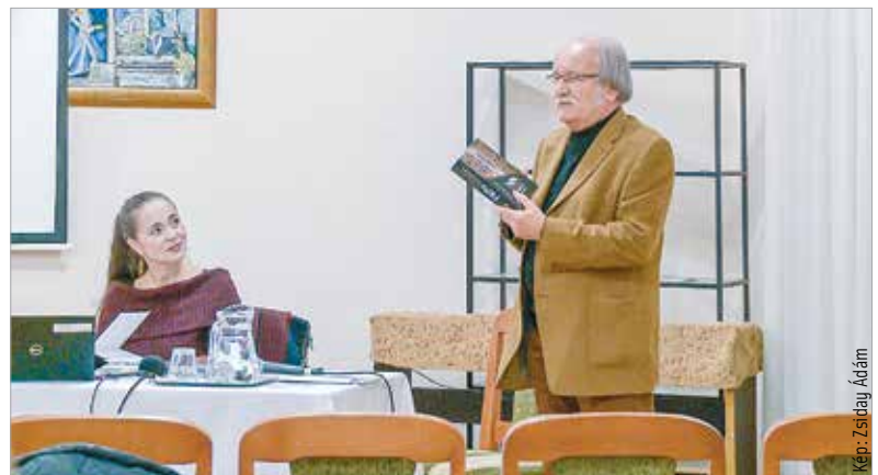
A bensőséges hangulatú diskurzus eddig nem ismert adalékokkal szolgált a kötet megszületésének történetéről

A kötetben nyelvemlékrészletek és a rendi krónika, a nagy pálos szónokok prédikációinak részletei, valamint Virág Benedek, Anyos Pál és Verseyhő Ferenc művei és a hozzájuk kapcsolódó szövegek mellett Martinuzzi Fráter György robusztus alakja is feltűnik, illetve a küzdelmes huszadik századot is bemutatják a pálos atyák emlékirataiból válogatott szemelvények.