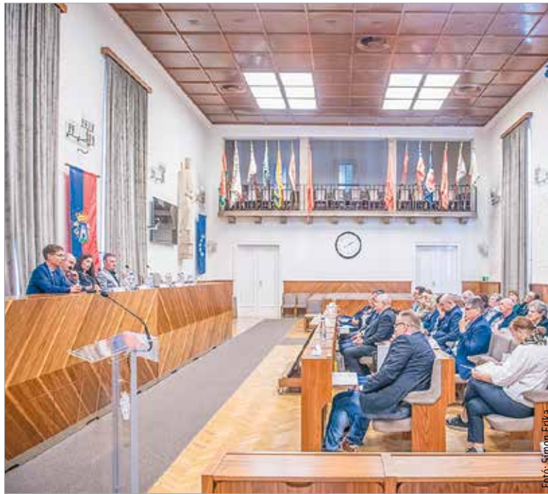
Huszonöt városból érkeztek vendégek a kétnapos eseményre

A kétnapos találkozón az egyesületet alkotó huszonöt település képviselői vettek részt. Az egyes városok saját egészségmegőrző programjait mutatták be. Ahogy De Blasio Antonio elnök hangsúlyozta, ezek azért is fontosak, mert az egészség csak részben az egészségügy felelőssége: számos egyéb tényező mellett a társadalmi környezetben is sok múlik. Latorcai Csaba, a Közigazgatási és Területfejlesztési Minisztérium államtitkára, az esemény fővédnöke beszédében kiemelte, hogy a városok szerepe egyre nagyobb az életminőség biztosításában. Az „egészséges város” koncepciója nemcsak a fizikai egészség, hanem a közösségépítés, a környezetvédelem, a fenntarthatóság és a lelki jólét szempontjait is magában foglalja. Rámutatott