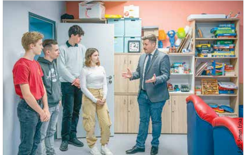
Középiskolás és egyetemista fiatalok ismerhették meg az intézmény által biztosított szolgáltatásokat, a munkatársakat, valamint a városban ezen a területen dolgozó civilszervezeteket

a járásban élők megismerjék az intézményben végzett munkát, hiszen ritka az, amikor ilyen módon megnyílnak a kapuk. Nagy hálával tartozik az önkormányzat a szociális területen dolgozóknak – ezt már Mészáros Attila alpolgármester mondta a rendezvény megnyitóján, majd kiemelte: fontos és jelentős munkát végeznek a rászorulókért, amit az önkormányzat igyekszik is meghálálni.