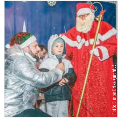
A Mikulás december hatodikán délután ötkor érkezik a Városház térre, az ajándékosztás után pedig elindul Fő utcai sétájára

A hagyományoknak megfelelően a belvárosban is találkozhatnak a gyerekek a Mikulással. December hatodikán délután négy órától rengeteg játék, móka vár a kicsikre a Városház téren. A programot a Szabad Színház Az elcserejt ajándékok című interaktív műsora indítja, ez gyerekeknek és gyermeklelkű felnőtteknek egyaránt szól. A történet a Mikulásgyárban játszódik, ahol az ünnep közeledtével óriási a hajtás – ezért a Mikulás-főközpont manóinak