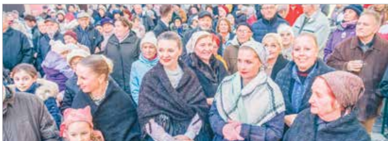
A Tilinkó Zenekar muzsikája hívogatót hétfőn délután mindenkit az ünnepségre, ahol néptáncosok és a Hermann iskola népzene szakos növendékei kívántak népdalcsokorral minden szípet és jót, Isten áldását kérve a Katalinokra