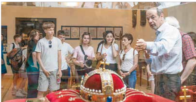
Lengyel diákok vendégeskednek a héten Székesfehérváron. A fiatalokat hétfőn Lechner Zoltán alpolgármester fogadta a Városházán. A diákok a Vörösmarty Mihály Általános Iskola lengyel partnerintézményéből, a brzegi általános iskolából érkeztek Székesfehérvárra egy környezetvédelmi projekt keretében.