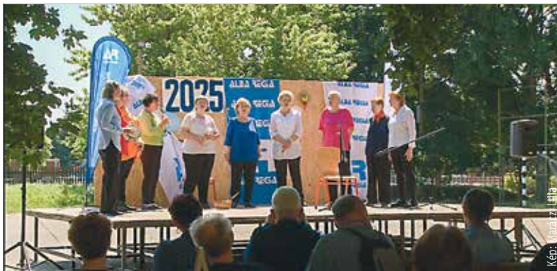
Ebben az esztendőben is megrendezte az AREV Baráti Kör Egyesület építők napi találkozóját. A hagyományos ünnepen színes, változatos programok várták a résztvevőket. A vasárnapi találkozónak a Vörösmarty Mihály Ipari Szakközépiskola és Szakközépiskola adott otthont.