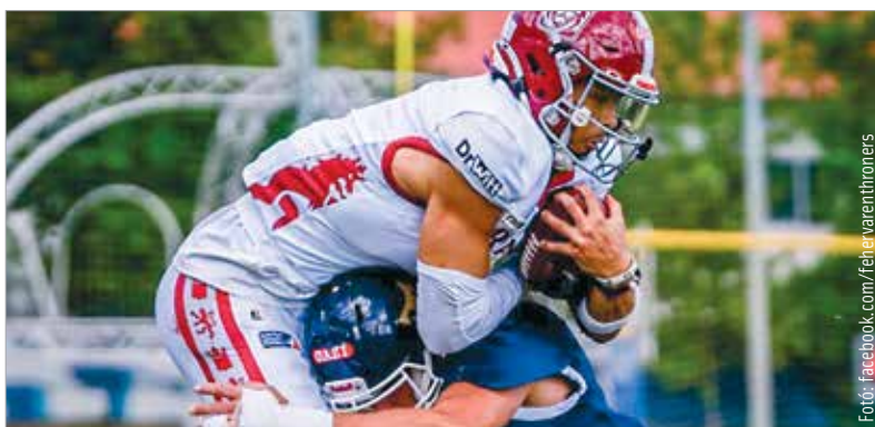
A Prague Lions ellen játszotta első hazai meccsét az ELF idei szezonjában a Fehérvár Enthroners. A vendégek 40-0-ra nyertek, a fehérváriak pedig szombaton javíthatnak, amikor a Madrid Bravos csapatát fogadják a First Fielden.