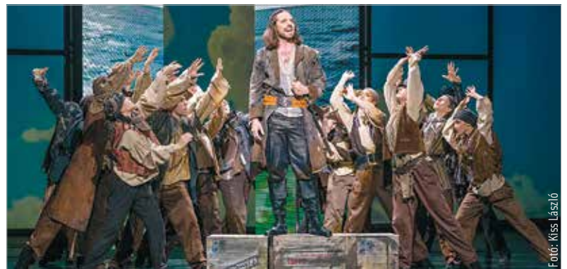
Zénes, látványos és a főhős kalandjainak köszönhetően izgalmas előadás a színház idei utolsó bemutatója