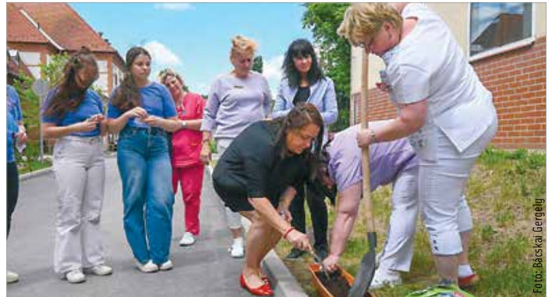
A virágültetés jelképezi, hogy a koraszülött babák a gondoskodás és a szeretet segítségével nagyra nőhetnek

és igyekeznek minden olyan kezdeményezést támogatni, ami a koraszülött babákkal kapcsolatos. Ilyen például a Koraszülöttekért Országos Egyesület kezdeményezése, melynek célja, hogy virágmagok ültetésével irányítsa a figyelmet a babákra. A kórházban egy virágládába szórták a magokat, melyek később egy sziklakertben kapnak helyet, amelyről a koraszülöttosztály dolgozói gondoskodnak majd. Az elültetett magok pedig a koraszülött babákat szimbolizálják. Az egyesület országszerte hagyott el kis zacskókban virágmagokat, amelyeket a megtalálók hazavihetnek és elültethetnek.