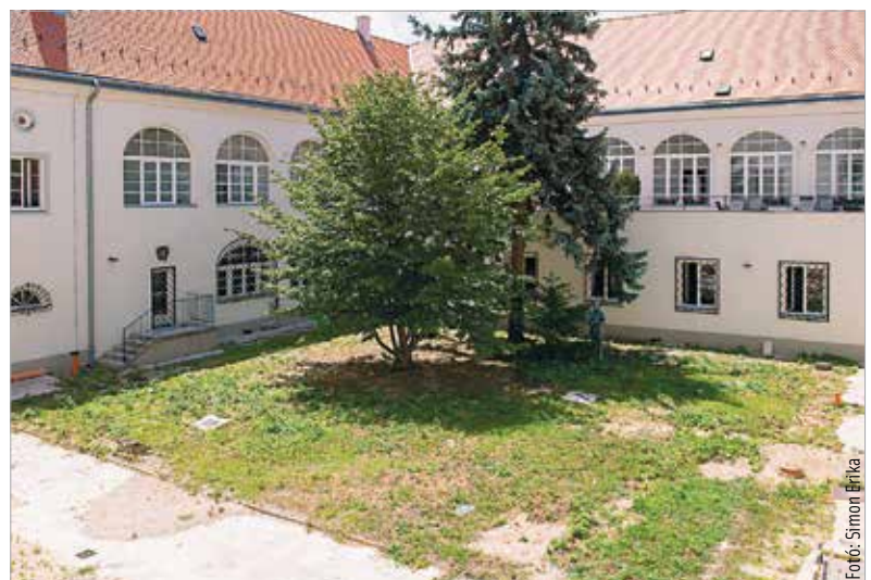
A Városháza Díszudvarán is a jövő héten kezdődik a kivitelezés. A munkálatok között a tereprendezés és a burkolatépítés mellett növénytelepítés, térvilágítás és csobogó kialakítása is szerepel, valamint utcabútorok is kerülnek az udvarba.

A falmaradványokat a süttői bányából származó mészkőburkolattal építik újjá. A korábbi kőzet helyett a szürke lapok is megújulnak, mégpedig tartós, vulkanikus eredetű kőzetből.