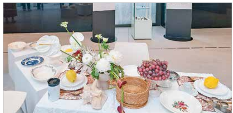
A ruhák mellett porcelánokkal is találkozhattak az érdeklődők, de fejdísz, karkötő, nyaklánc, valamint parfüm készítésére is volt lehetőség a hétvége során