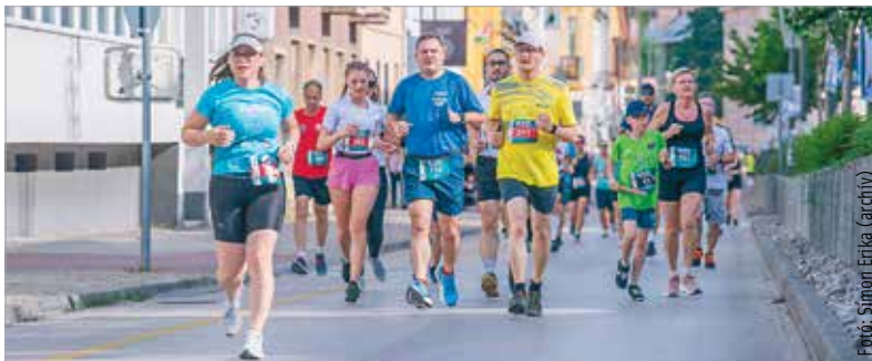
A helyszín a megszokott lesz, és mint mindig, idén is lehet egyéniben vagy váltóban is teljesíteni a távokat

A rendezvény miatt útlezárásokra kell számítani a városban!