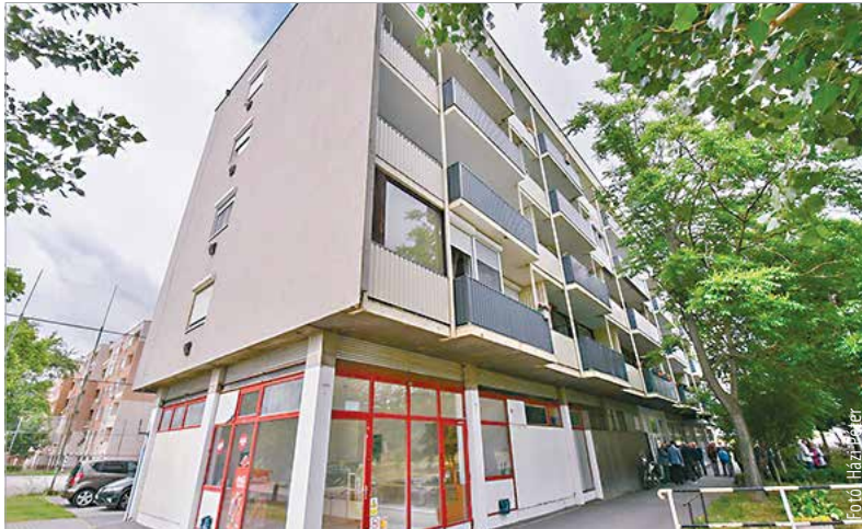
A Lift Slab technológiával mintegy nyolcszáz fehérvári lakást épített az AREV