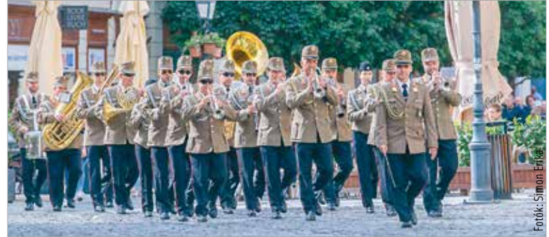
A belvárosi fellépést a Székesfehérvári Helyőrségi Zenekar játéka vezette fel a Fő utcán

Az Egyesült Államokon kívüli legnagyobb amerikai katonazenekar több mint ötven katonából és hét különböző együttesből áll, ezek egyike a Free Groove zenekar. A múlt hét elején érkeztek Magyarországra. Szerdán Szentendrén, csütörtökön Budapesten, majd zárásként pénteken Székesfehérváron léptek fel. A Free Groove egyike azon zenekaroknak, amelyek az amerikai katonáknak, családjaiknak zenélnek, legyen szó hivatalos ünnepekről, megemlékezésekről vagy más nyilvános eseményekről.