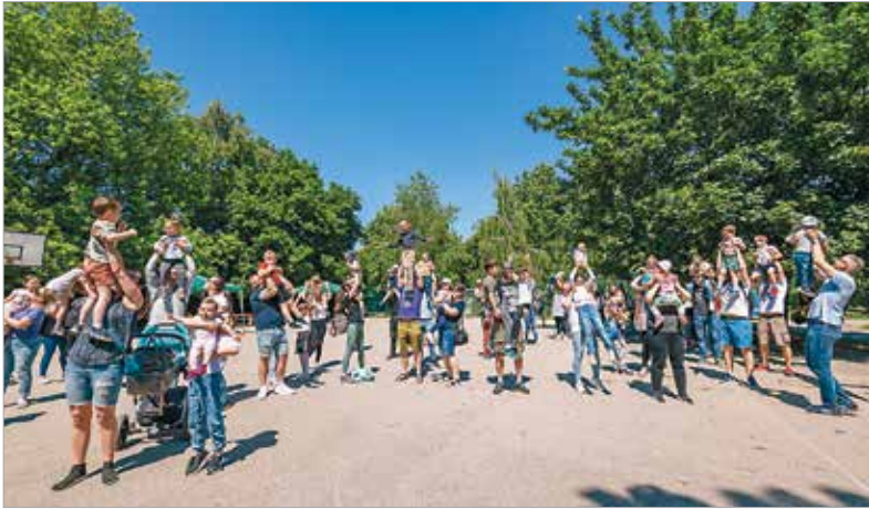
Mint minden évben, ország-szerte egyszerre, ugyanabban az időpontban emelték magasba a gyerekeket a programban résztvevő szülők

mint tízezer gyereket emelnek meg szülei, nagyszülei ország-szerte ugyanabban az időpontban. A SZÉNA Egyesület partnereivel együttműködve a Babahordozó Klub információs standjával, állatsimogatóval, interaktív foglalkozásokkal, óriásbuborékeregetéssel és ugrálóvárral is készült. A rendezvényen ügyességi feladatokkal várták a kisgyermeket, akik útilaput kaptak,