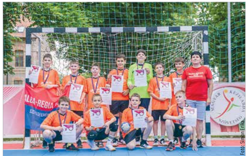
Senki nem tudta legyőzni ebben a szezonban a fehérvári fiúkat