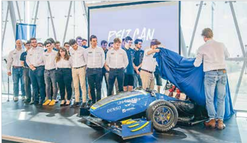
A 2019-ben alakult csapat számára már szinte hagyomány az autóépítés: az első járművet 2022-ben, a másodikat 2023-ban készítették

az Óbuda University Racing Team múlt héten csütörtökön bemutatta legújabb versenyautóját, a Pelicant. Az idei jármű különlegessége, hogy a tavalyi évhez képest már saját fejlesztésű motorral készült. A Pelican megépítésében közel hetven hallgató vett részt, az Óbudai Egyetem szinte valamennyi karáról. A hallgatók hónapokon át dolgoztak a járművön: „Nem csak gépész-, illetve mérnökhallgatók vesznek részt a