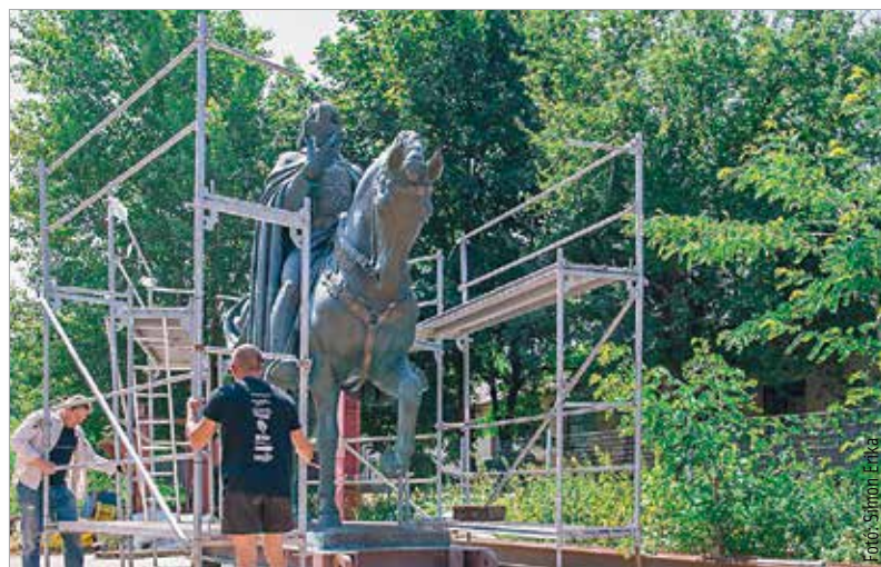
Szent István lovasszobra itt még állványon