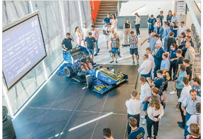
A harmadik versenyautójuk, a Pelican a nemzetközi Formula Student sorozatban áll rajthoz, ahol nemcsak az autó technikai tudását, hanem a mögötte álló üzleti koncepciót is pontozzák majd