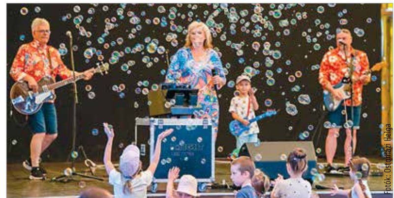
A Buborék Zenekar koncertjén szórakozhattak elsőként a kisebbek a szárazréti nyárköszöntő pikniken, melyet minden évben megszerveznek a városrészen

A Feketehegy-szárazréti Közösségi Ház udvarán számos játék és érdekesség várta egész nap a gyerekeket, családokat. Az arcfestés mellett légvár, gokartpálya, kézművesvásár, buborékfújás nyújtott szórakozási lehetőséget a nyárköszöntő pikniken.