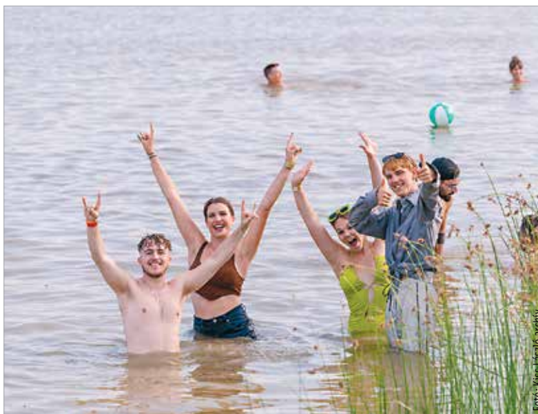
Idén is nagy bulira készülhet minden résztvevő az EFOTT-on!

A fellépők között tehát idén is megtalálja mindenki a hazai húzóneveket, ugyanakkor újdonságokkal is készülnek a szervezők: „Idén először lesz EFOTT-díszkő, mellyel a kilencvenes évek zenei