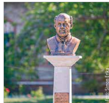
Pintér Balázs szobrászművész alkotása a kórház új parkjában látható

A magyar egészségügy napjához kapcsolódóan szoboravató ünnepséget rendeztek a kórház új parkjában: felavatták Semmelweis Ignác szobrát.