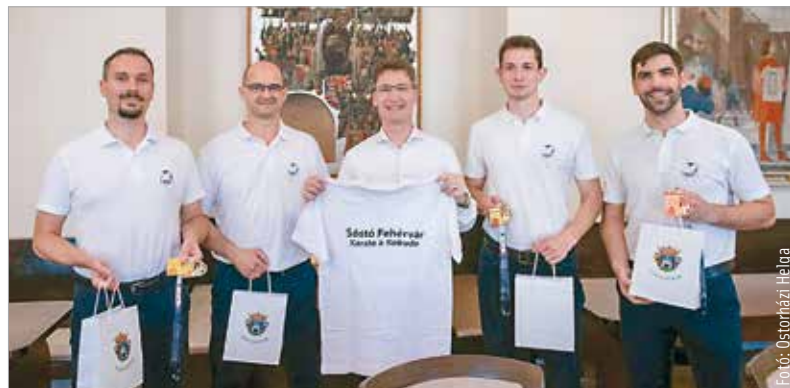
Négy érmet, köztük két aranyat, egy ezüstöt és egy bronzot hoztak haza a X. Fudokan Karate Világbajnokságról a Sóstó Fehérvár SE versenyzői. A nagy terveket szövő klub képviselőit hétfőn szintén a Városházán fogadta Cser-Palkovics András polgármester. S. Z.