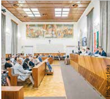
Folytatódik a Balatoni úti szervízút felújítása – erről is múlt pénteki ülésén döntött a város közgyűlése

Az első napirendi pont a Vörösmarty Színház igazgatói munkakörének betöltésére vonatkozó pályázat elbírálása volt. A közgyűlés tizenhét igen szavazat és négy tartózkodás mellett Dolhai Attilát választotta meg az intézmény vezetőjévé. A helyi közösségi közlekedés fejlesztése is folytatódik: egy új, útvonaltervezésre és utazói visszajelzések megosztására alkalmas digitális