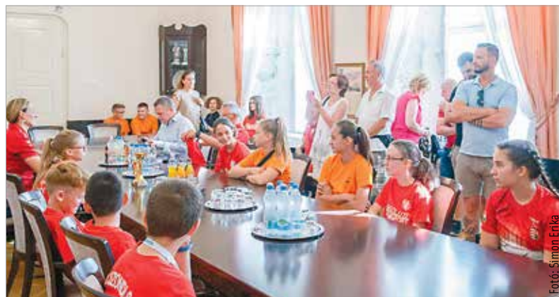
Az István Király Általános Iskola tanulói, valamint a Honvéd Szondi György Sportegyesület igazolt versenyzői kitudó eredményeket értek el az országos pétanque-bajnokságokon és a pétanque-diákolimpián. A gyerekeket és szüleiket múlt csütörtökön fogadták a Városházán.