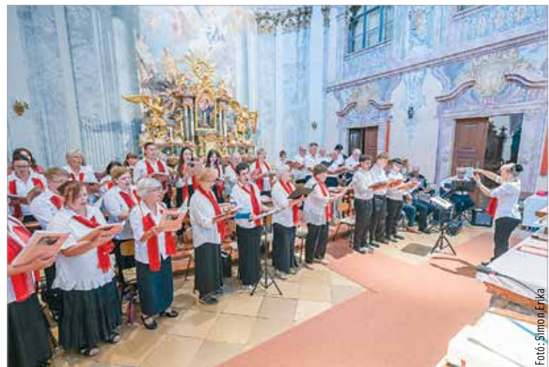
A különleges mű felejthetetlen zenei élménnyel ajándékozta meg az ünneplő közönséget