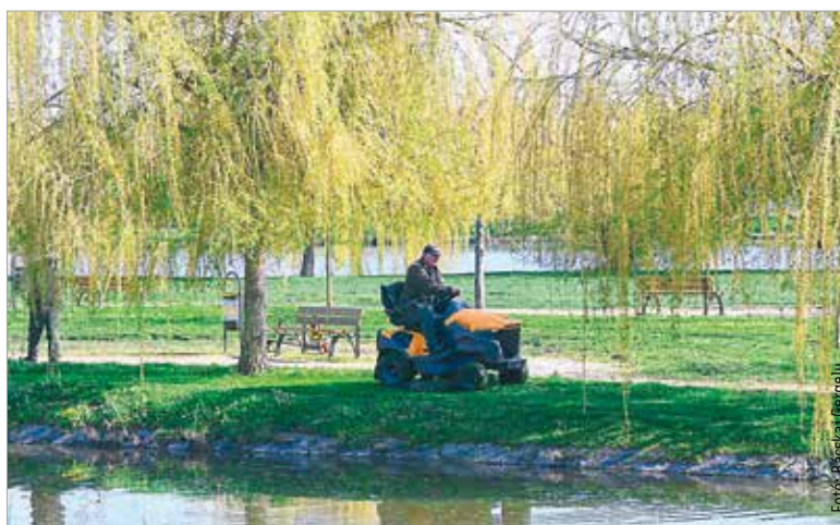
A közterületek gyepgondozásával kapcsolatos lakossági elvárások közé tartozik a rendszeres nyírás, valamint az allergén gyomnövények eltávolítása

Aki bármilyen fűfelületet gondoz a kertjében, jól tudja, hogy tavasszal, csapadékos időben akár kétnaponta is lehetne nyírni a fűvet, és kétség sem fér hozzá, hogy csodás üde zöld egy-egy fehérvári parkban a frissen nyírt tavaszi gyep. A közterületek gyepgondozásával kapcsolatos lakossági elvárások közé tartozik a rendszeres nyírás, valamint az allergén gyomnövények eltávolítása. Egyre többen vannak azonban, akik több olyan területet szeretnének a városban, ahol nem nyírják rendszeresen a fűvet. Székesfehérváron évek óta vannak méhlegelők, ezek köré határozott kontúrt húznak a fűnyíróval, hogy egyértelműen látszódjon: ott más gyepfenntartási módszert alkalmaznak. Több mint két és fél hektáron alakított ki idén méhlegelőt a Vá-