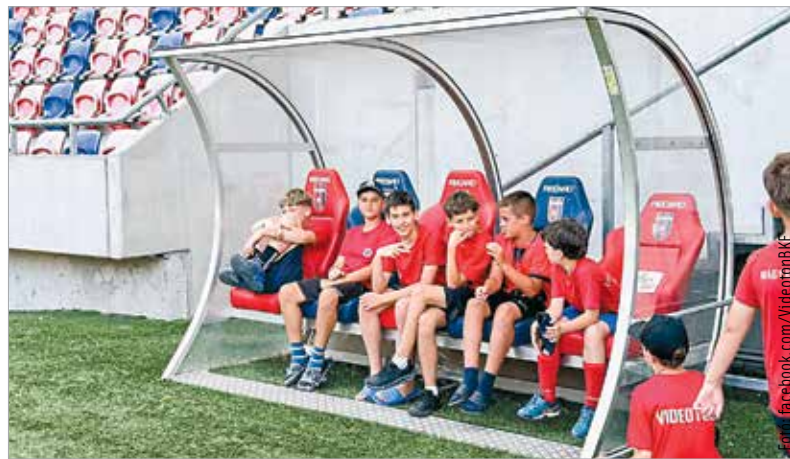
A gyerekek a sóstói kispadra is leülhettek a stadionlátogatás alkalmával