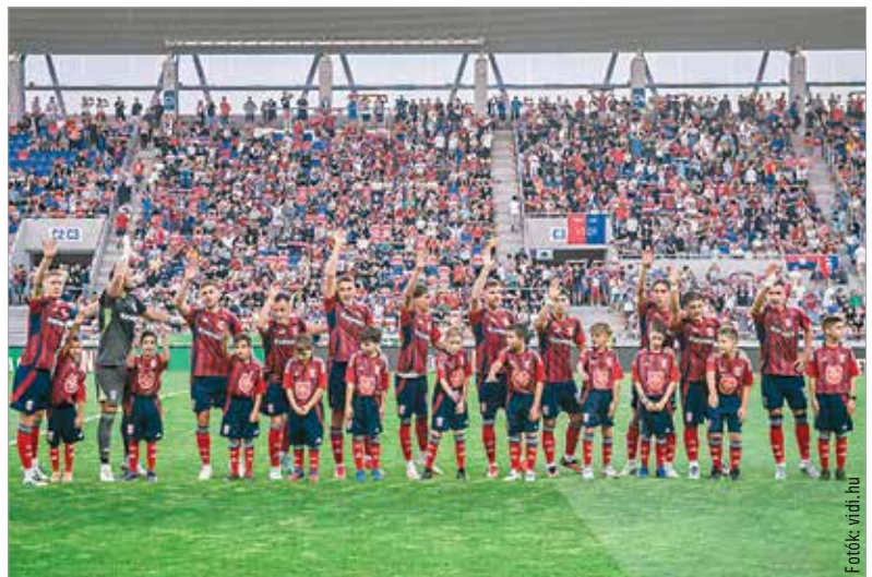
A szurkolókon nem múlt: nagyszerű hangulatban, sok néző előtt játszott a Vidi a Honvéd ellen

fölényben voltak, hamar vezetést is szereztek, a Vidi ellenben egyetlen ziccerét sem tudta kihasználni. Az összeszokottság hiánya, néhány labdarúgónál a túlzott megilletődés is közrejátszott sok technikai hibában, labdavesztésben, ezeket pedig büntette a tavaszi szezonban már jól összeállt Honvéd. Féligőben két góllal vezettek a vendégek, végül pedig 3-0-s győzelmük rontotta el az amúgy ünnepi hangulatot a stadionban. Érheti jogos kritika a Vidi játékát, de ta-