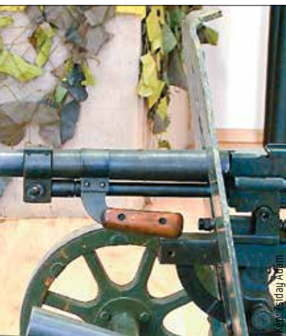
fejlesztéval az ÁVO-sok Polczer István elmondása