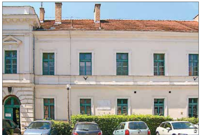
A tiszti klub épületének első emeleti ablakai mögött volt a nemzetőrök szálláshelye a forradalom alatt

Nem, az égvilágon semmi nem érte. Miután a Sár utcai kapun kimentünk, rövid időn belül elhall-