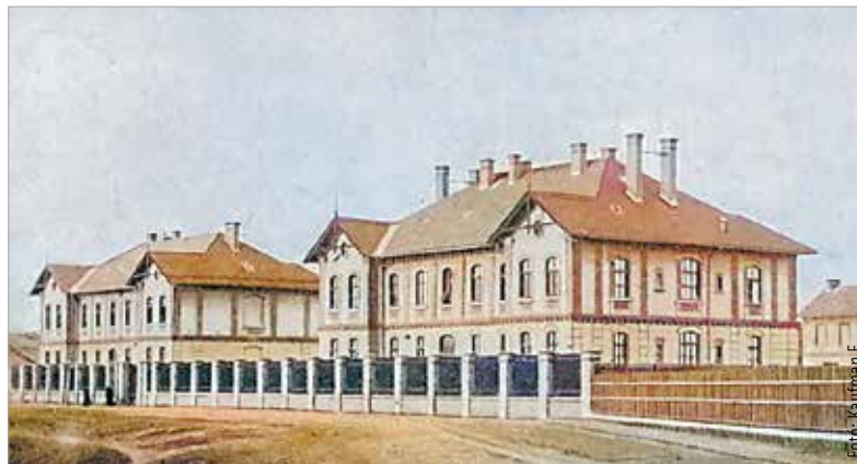
A Lövvölde utcai oldalról 1900-ban készült fotón az intézet főbejárata és két főépülete, valamint a gazdasági épülete látszik