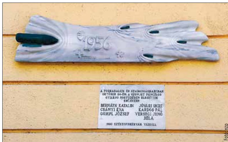
1993-ban avatták a megemlékezés tábláját a Szabó-palota oldalán, amely csak szovjet lövésekről tanúskodik

Ez a kollégiumi épület a jelenlegi múzeum épülete?