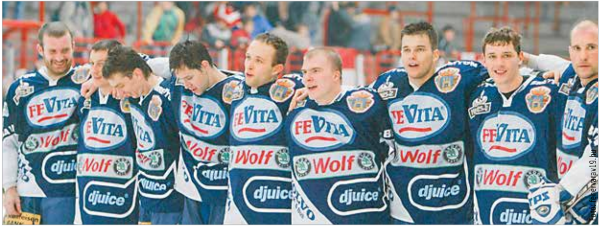
A kezdeményezés célja, hogy összefogja mindazokat, akik az elmúlt évtizedekben játékosként, edzőként vagy munkatársként részt vettek a fehérvári jégkorong életében – az alapítóktól kezdve egészen napjaink szereplőig

A közösség formálása nem véletlenül most kezdődik: 2027-ben