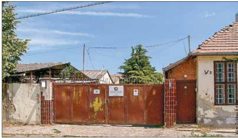
Ezen a Sár utcai kapun távoztak a sorkatonák és a nemzetőrök a mai tiszti klub épületéből, amikor november negyedikén hajnalban a szovjetek megtámadták Székesfehérvárt