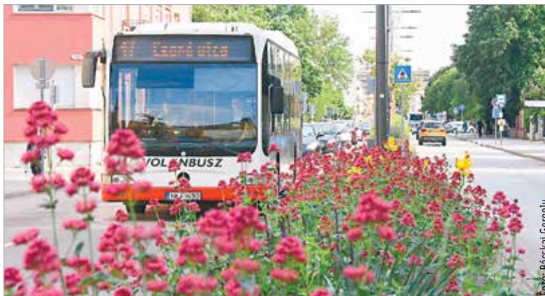
A városrészek összeköttetése lényegesen jobb lesz a hálózatbővítéssel

Tavaly ősszel bocsátotta véleményezésre Székesfehérvár önkormányzata a helyi közösségi közlekedést érintő újabb bővítési terveket. Az utasoktól érkező javaslatokat mérlegelve, azokat lehetőség szerint a tervezetbe beépítve alakult ki a szombaton életbe lépő bővebb hálózat és módosított menetrend. A városi honlapon, a székesfehérvár.hu oldalon már most is elérhető a menetrendi füzet, a módosított járatútvonalak térképes és szöveges tájékoztatói, valamint az útvonaltervező program is. Az új, papíralapú menetrendi füzetek a bérletértékesítési