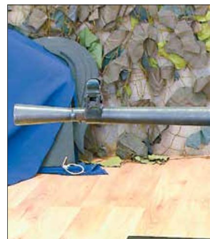
Egy ilyen kerek géppuskát húztak el a sortűz beállapján

A mai Budai út felől a mai Deák Ferenc utcába, méghozzá az utca Szabó-palotával szemközi oldalán, tehát a belváros felőli részén. És mivel már nem lőtt senki, vissza-