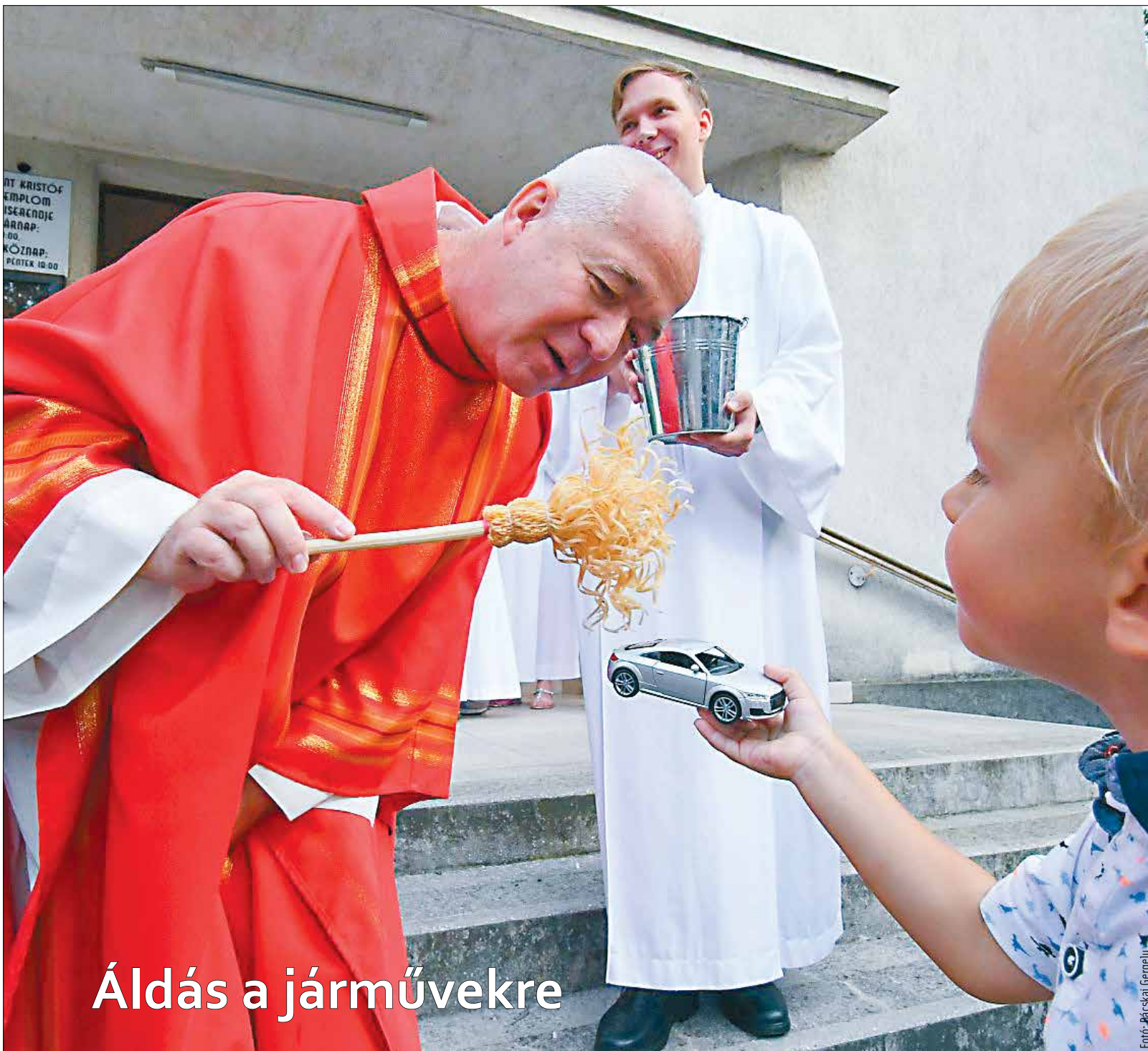
Áldás a járművekre