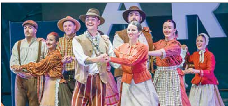
Az est harmadik fellépője, a kanadai csoport részt vett az első, harminc évvel ezelőtti nemzetközi fehérvári néptáncfesztiválon is, amit 1995-ben az egykori vidámpark szabadtéri színpadán tartottak