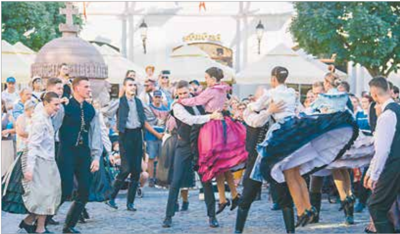
A Városház térről indult a szín pompás táncos forgatag, a házigazda Alba Regia Táncegyüttes mellett Kanadából, Kolumbiából és Észak-Macedóniából érkezett néptáncosokkal

A katonazenészek után kedden este integető táncosok, népviseletbe öltözött hölgyek és urak népesítették be a Fő utcát, mosolyt csalva felnőttek és gyerekek arcára. Immár a harmincadik nemzetközi néptáncfesztivál ad lehetőséget arra, hogy megismerjük a különböző kultúrák élő örökségét, legyen az tánc, zene, népviselet vagy néphagyomány.