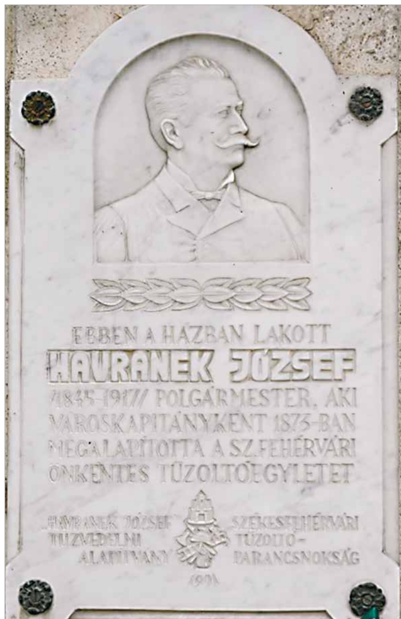
Az emléktáblát 1991-ben avatták fel a Zichy ligetben

A dombormű kiválóan illeszkedik Székely János Jenő munkásságába, hordozva az alkotóra jellemző művészeti megoldásokat. Az emléktáblát a Havranek József Tűzvédelmi Alapítvány és a Székesfehérvári Tűzoltó-parancsnokság állította, így tisztelegve Székesfehérvár egykori kapitánya és polgármestere előtt.