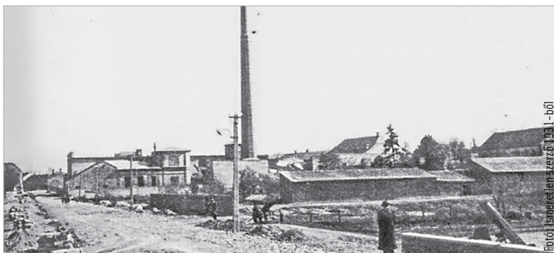
Az 1930-as évek közepére elkészült a Gaja-patak meghosszabbítását képező, nyílt Malom-csatorna lefedése, és a Felmayer gyár hátsó része a mai Mátyás király körúton könnyebben megközelíthetővé vált

mó Rt. volt a vállalkozás neve. Ám a második világháborút követően a szocialista világrend nem tudta elviselni a Felmayer nevet, az állam elvett minden jogot, és átvette a gyár irányítását Kolorit, később Patex néven. Innentől a fejlesztés nem volt jellemző, a gyár lassan leépült, majd 1996-ban az ott dolgozók az utolsó munkanapjukat töltötték el december tizenharmadikán. A gyárat teljes egészében „beszántották”, a helyén megszületett a mai pláza, melynek keleti homlokzata emlékeztet valamelyest a korábbi ipari építményre.