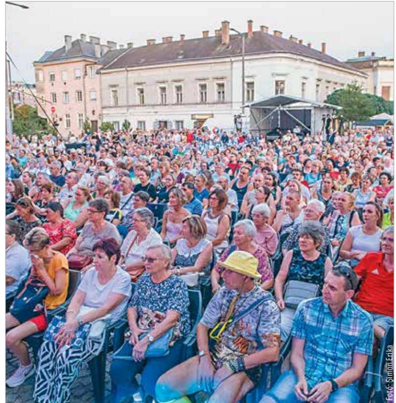
Fehérváriak és vendégeik közösen szórakoznak és ünnepelek tiz napon át