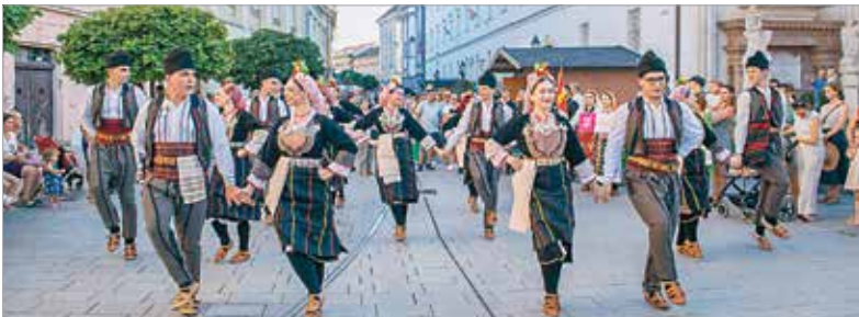
A fehérváriak hegedűszóval, az észak-macedónok hangos dobokkal, a kanadaiak gitárral, a kolumbiaiak dobokkal és fúvószenével vonultak. A macedón férfiak fekete-fehér népviseletben, fekete kucsmában, a hölgyek pedig virágdíszes fejfedőben táncoltak.