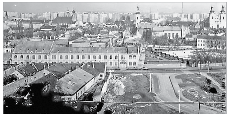
Az 1885-ben készült kép közepén jól kivehető a Felmayer kékfestőüzem Palotai úti homlokzata és mellette a városi piac bódésorai

ták meg. A bővítések megkezdését követő kilencedik esztendőben már inkább gyárra kezdett hasonlítani a mai Palotai út és Mátyás király körút által határolt terület. Sorra vásárolták meg az ingatlanokat a közelben, hogy tovább tudjanak terjeszkedni, ugyanis képtelenek voltak a kékfestő textilákkal az igényeket kielégíteni, főleg a közeli háborúk nagy katonai megrendelése miatt. Éppen ezért Pesten is üzemet indítottak. Felmayer István nem kevés bevételét folyamatosan visszaforgatta vállalkozásaiba, és olyan fejlesztéseket kezdeményezett, mint például a lényegesen hatékonyabb és gyorsabb gőzgépek meghonosítása. 1870-ben már száz alkalmazottja dolgozott a nyolc nagy méretű nyomógép mellett. Ekkor a vászonfestés mellett kendők