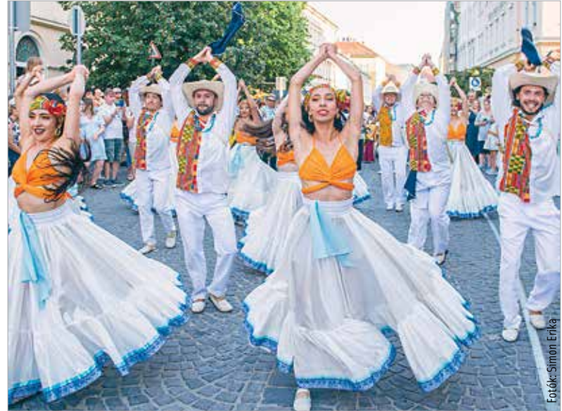
Hófehér ruhákban, szalmakalapokban ropták a kolumbiai táncosok