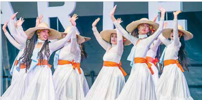
A kolumbiai Tres Cuartos Danza csoport célja, hogy megossza a kolumbiai folklór varázsát a világ közönségével