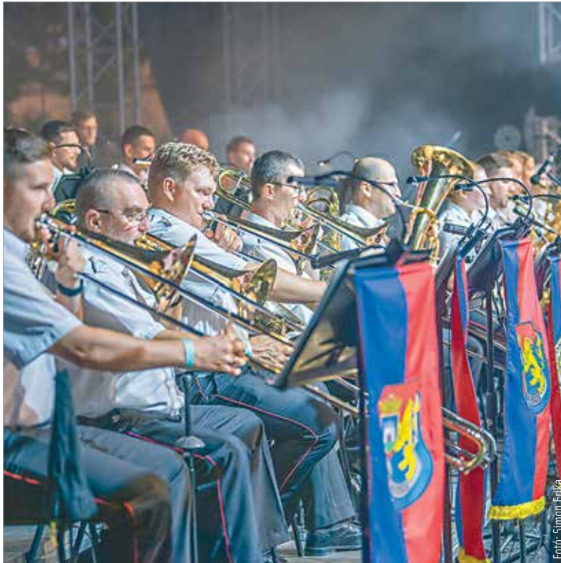
Zenei csemegék, filmzenék, rock- és szerelmes dalok is felcsendültek a Zichy liget és a belvárosi sétálóutca találkozásánál

Igazi zenei kuriózum, fergeteges hangulat és egy, mindenki arcára mosolyt varázsoló meglepetésvendég várt mindazokra, akik részt vettek a Székesfehérvári Királyi Napok nagyszabású megnyitóján vasárnap este. Egy országosan is egyedülálló formáció, a Székesfehérvári Helyőrségi Zenekar, az Alba Regia Szimfonikus Zenekar és az Alba Stúdió zenekar adott közös koncertet. „Büszkék lehetünk erre a rendezvényre, hiszen megmutathatjuk gazdag történelmi múltunkat, de egyúttal azt is, hogy a mi közös otthonunk egy modern és szerethető város, amely képes egy ilyen összművészeti kulturális fesztivál megrendezésére” – fogalmazott köszöntőjében Cser-Palkovics András polgármester, aki szerint ennek a másfél hétnek a legnagyobb értéke a találkozások lehetősége, az emberi kapcsolatok, a barátságok ápolása. A városlakók és a városba látogatók a nyitónévtégen részt vehettek a Fehérvári Múziumon, a Fricsay Richárd Katonazenekari Fesztiválon és a Magna Cum Laude koncertjén. A Nemzeti Emlékhelyen pedig augusztus huszadikáig ingyen meglehet az osszáriumot is.