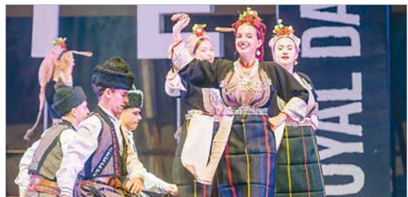
A macedón táncosok is elvarázsolták a lelkes nézőket. Szombatig ők is várják az érdeklődőket a város több pontján és a Táncházban. A zárófelvonulás és a gála pedig szombaton 18 óra után bizonyára sokakat csalogat ismét a belvárosba!