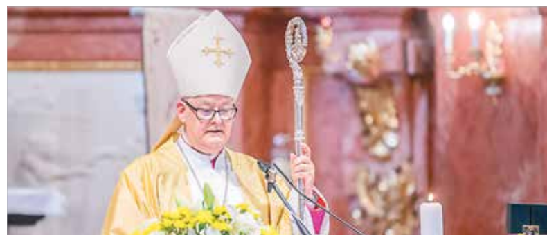
Spányi Antal megyés püspök szentbeszédében kiemelte: minden nemzedéknek döntenie kell, merre tovább, milyen célokat akar elérni és megvalósítani. Nekünk is döntenünk kell. Választhatjuk az örökül kapott utat, azt a megoldást, melynek gyökerében ott a keresztény kultúra.