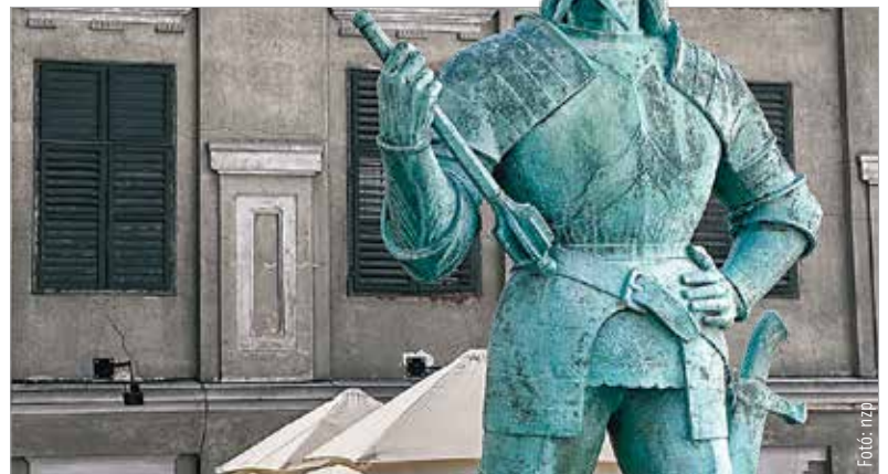
Csak háromszázkilencvenöt évvel később, 1938-ban állítottak emléket a fehérvári várvédőknek és Varkocs György várkapitányunknak

legjobb idő a birtokok növelésére. Varkocs szokásos váron kívüli rendrakásából visszajövet a török által körülvevett várba már csak a mocsarak rejtekútjain tudott bejutni. A kilencszáz várkatonán kívül ötven zsoldosa volt Varkocsnak, és egy egységre nem jutó teljes városa. Ezekkel kellett szembenéznie negyvenezer török fegyveressel. A török tíz napon át ostromolta a várost, s csapott léket egyik bástyánknál, ágyúzta keletről a várost. Szulejmán szeptember másodikán végső támadásra szánta el magát, és előbb az Ingovány városrész felől indított ostromot, majd mindjárt bevéve a Sziget és Budai külvárost, rohamozta a Budai kaput. Az ostrom tíz napjában szinte minden nap a törökre csapott Varkocs és zsoldos lovasai, hogy eltántorítsák őket terveiktől. Így tettek szeptember másodikán is, ám Fehérvár polgárai a visszaérkező magyarok előtt bezárták a Budai kaput, és annak hídját is