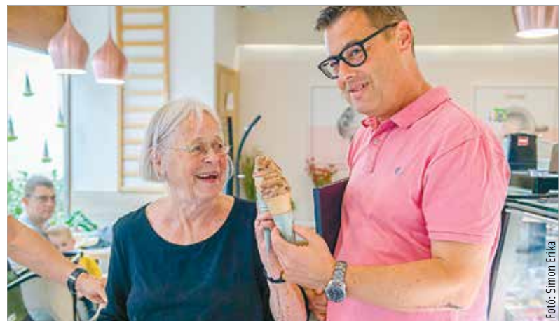
Különleges találkozás: a Via Lucis alkotója a művésze által inspirált fagyaltot is megköszönte a székesfehérvári Damniczki cukrászdában

Ahogy az alkotó a tárlatvezetésen elmondta, a szövött és csomózott munkák elkészítése akár egy évig is eltart, a kiállítás így hosszú idő alkotói munkáját mutatja be. A kiállított műveket szeptember hetedikéig láthatjuk a Vár körúton, a Koronázóbazilika Nemzeti Emlékhely Látogatóközpontjában.