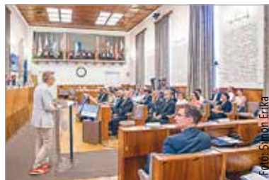
A két nap alatt mintegy harminc szakember tartott előadást a korszak legjobb ismerői közül

A Városháza Dísztermében a politikai, pénzügyi és hadügyi kérdésektől kezdve a királyi udvar szerepén át a csatatörténetig számos szakterület képviselői tartottak előadást. Mivel ebben az időszakban is Székesfehérvár volt a koronázóváros, az előadások a város jelentőségét is kiemelték, hiszen 1527 novemberében Székesfehérváron egy új korszak kezdődik: a Habsburg monarchia és a Magyar Királyság közös története 1918-ig – fogalmazott Pálffy Géza történész.