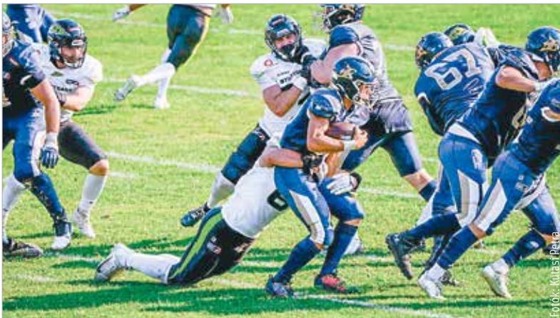
Második szezonját zárta az amerikai futball európai ligájában, az ELF-ben a Fehérvár Enthroners. Az utolsó hazai mérkőzésen sem lehetett panasz a küzdeni tudásra, de a Stuttgart Surge végül 47-20-ra legyőzte a fehérváriakat.