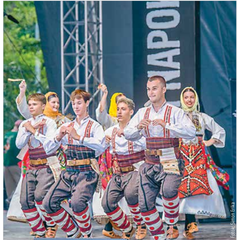
Az együttesek nemzetük autentikus táncait hozták el Fehérvárra

Koszorúzással emlékeztek pénteken délelőtt Székesfehérvár egykori „házi ezredére” a Lánosz Kornél Gimnázium falán elhelyezett emléktáblánál. A Magyar Királyi Szent István 3. Honvéd Gyalogezred 1922-ben kapta meg a 3-as hadrendi számot, s 1930-ban vette fel Szent István nevét. 1942-ben teljes állományát az orosz frontra vezényelték, ahol a végzetes visszavonulás során az ezred nyolcvan százaléka odaveszett. (Forrás: ÖKK)