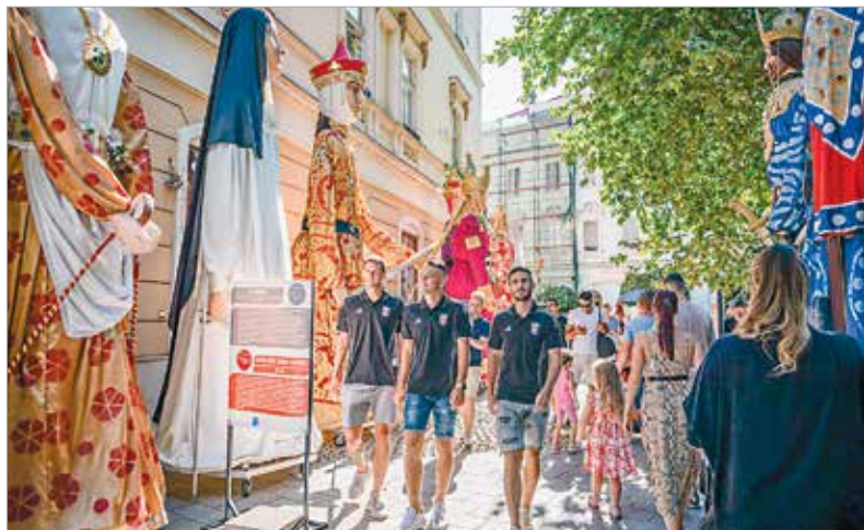
Hátha a feltöltődés segít: a Vidi játékosai is meglátogatták a Királyi Napokat