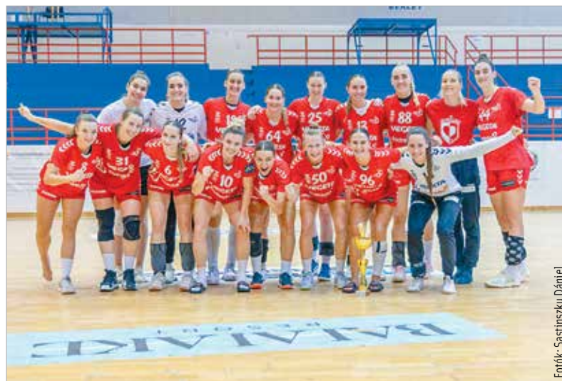
A kapronciai mindkét magyar ellenfelüket legyőzték, így megnyerték a felnőtt tornát

kitartásán múlt – írta bejegyzésében a fehérvári klub. Hogy a nemzetközi szabványoknak semmiben nem megfelelő, de még a hazai licenszhez is „határesetnek” számító csarnokban meddig lehet mérkőzéseket rendezni, az minden évben feszítő kérdés az Alba vezetői számára. Ezzel együtt a klub sikeresen lebonyolította az elmúlt évek egyik legsokrétűbb, legkomplexebb tornáját, melynek felnőtt küz-