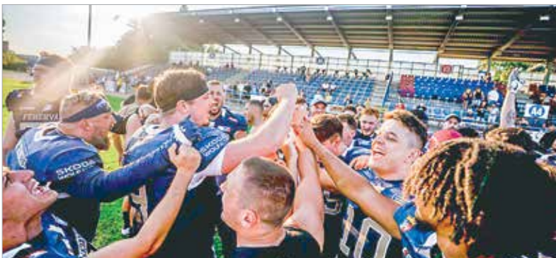
Az idény legemlékezetesebb pillanata így mindenképpen a Berlin Thunders elleni győzelem lett, sőt talán a kétéves ELF-kaland legnagyobb sikerének is a német csapat 34-31-es legyőzését tekinthetjük.