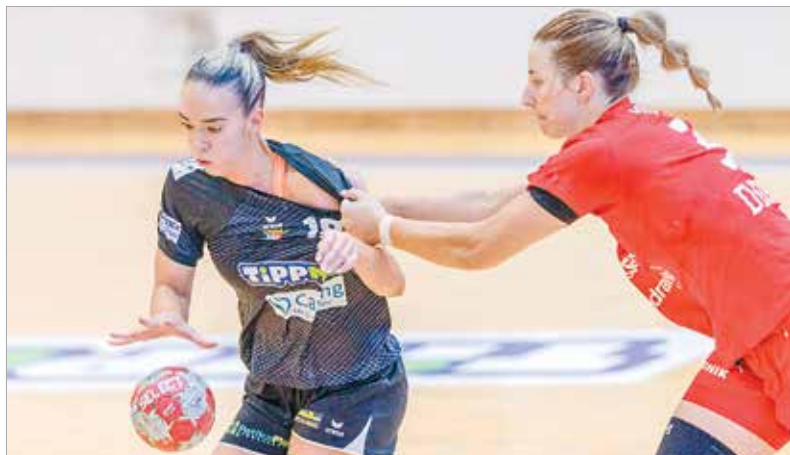
Felkészülés ide vagy oda, már most kőkemény meccseket játszottak a csapatok

szövetség által a képzési központok számára kötelezően előírt rendezvény, akkor elviselhetlenné válhatnak a körülmények. Most is előfordult, hogy a lelátón negyvenkilenc fokos meleget mértek, egyes mérkőzések a rendezők döntése alapján nem is kerültek megrendezésre a csarnokban uralkodó hőség miatt. Több szülő pedig nem engedte pályára lépni gyermekét a hőség miatt. Szerencsére komolyabb egészségügyi probléma nem merült fel, ami egyértelműen a csapatok sportolónak, edzőinek a hozzáállásán,