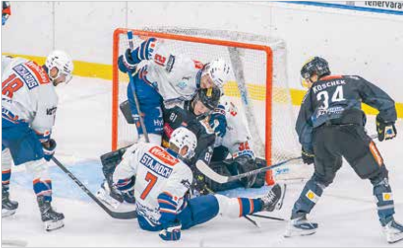
Speciális „barátkozás” a bécsi kapu előtt

összecsapásában bármi megtörténhet. Igaz, a klasszikus szlogen szerint messzemenő következtetést egy edzőmeccsből nem szabad levonni, de az látszott, hogy kellően komolyan vették a felek, így a küzdőképességgel a továbbiakban sem lesz baj. Ráadásul fordulatokban sem volt hiány, hiszen kétgólos hátrányból egyenlített, aztán ezt még egyszer megtette a Volán, végül a szétlő-