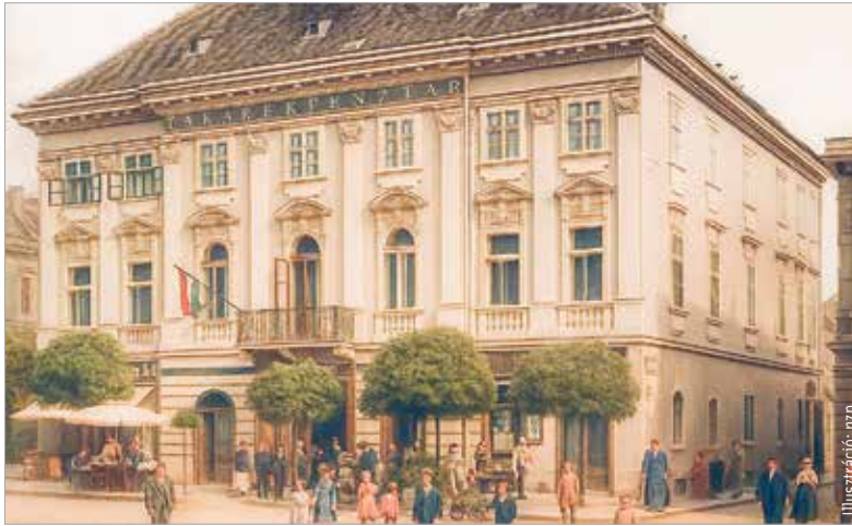
Az első és egyben legerősebb vidéki pénzüintézet központjának épülete a tizenkilencedik század végén – ma a városháza második épülete

Ez a találkozás éppen a takarékpénztár kétszintes székháza előtt folyhatott le, amely épületet tizenegyezer forintért vásárolta meg a Székes-Fejérvári Takarékpénztár Bezerédj