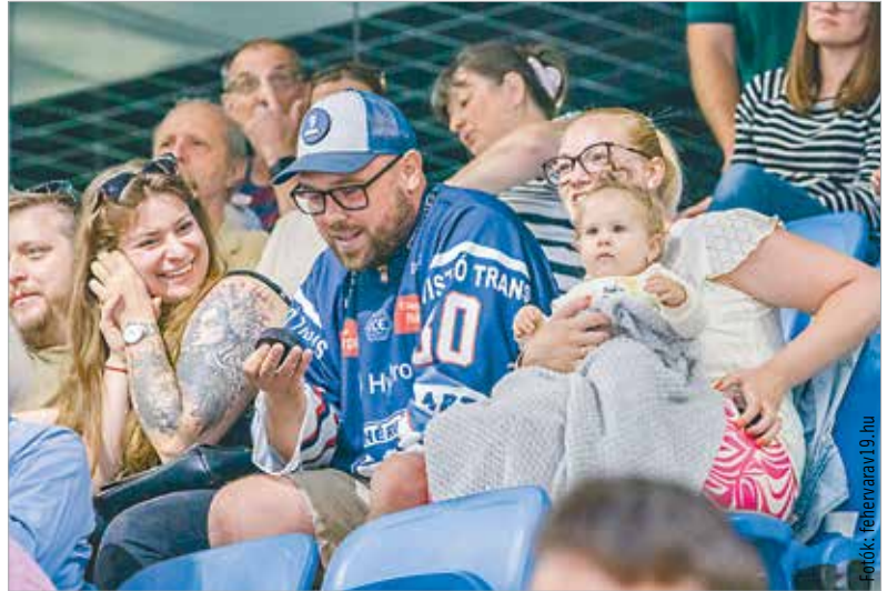
A nézőtérre kiemelt korongnak egy edzőmeccsen is komoly értéke van a szurkolók között

vésben maradt alul. A fehérvári gólokat Hári, Kulmala és Mihály szereztek.