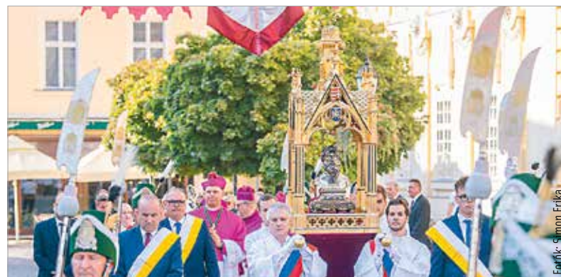
A hagyományoknak megfelelően a Püspöki Palotából körmenetben vitték a Magyar Szent Család ereklyéit a székesegyházba, ahol ünnepi szentmisét tartottak

Az országfelajánlás napján, augusztus tizennegyedikén a város hagyományos fogadalmi ünnepére került sor Székesfehérváron.