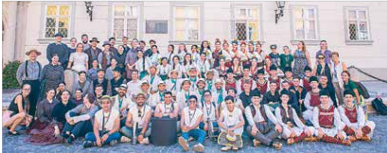
A vendégek a Városházát is meglátogatták

Felvonulásokkal, utcatáncokkal, térzenevel, színpadi bemutatókkal, koncertekkel, folkestekkel és gyermekprogramokkal fogadta a néptánc és a népi kultúra barátait az Alba Regia Táncegyüttes a Királyi Napok Nemzetközi Néptáncfesztivál során, augusztus 12. és 16. között. A házigazda mellett Kanada, Kolumbia és Észak-Macedónia táncosai is színpadra léptek, és bemutatták mives koreográfiáikat. A hagyományokhoz hűen a fesztivál egy látványos örömtánczal zárult, melynek keretében a csoportok mindannyian a magyar népzene dallamaira léptek színpadra.