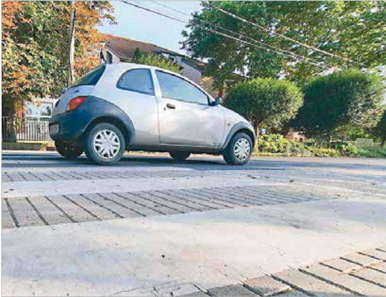
Legyünk körültekintőek, szeptember elsején ismét becsöngetnek, vagyis figyelmetlen gyermekek lepik el az utcákat!

után ugyanis kőfelverődések nyomait láthatjuk, melyek eleinte nem, de később, ahogy egyre több van belőlük, nem túl esztétikusak. Ráadásul a fémen megindulhat a korrózió, amit csak fényezőműhelyben lehet szebbé varázsolni. Az első szélvédő se maradjon ki, a sérült felület itt viszont az esetek többségében azonnali ja-