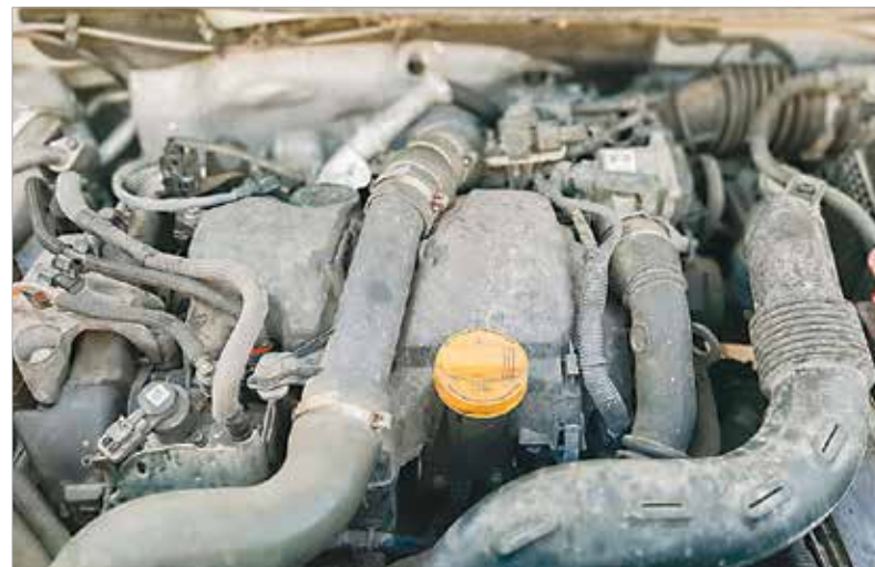
... és a motorteret is érdemes átnézni!