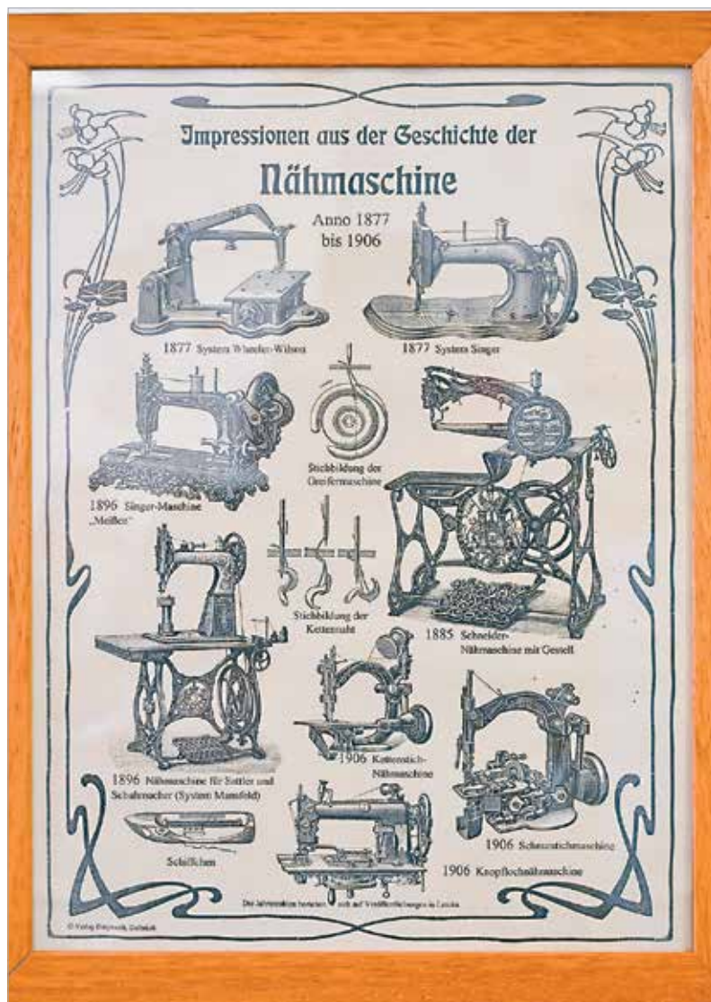
A német varrómáshinák evolúcióját jól mutatja a tizenkilencedik század végéről és a huszadik század elejéről összeállított gyűjtemény

Gondolkozni fogok rajta. Köszönöm a házi feladatot! Azért bízom a gondviselésben, hiszen eddig velem volt, és remélem, nem húzom ki a gyufát később sem!