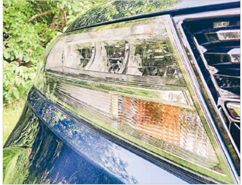
Fontos, hogy mindenki jól lásson és látható is legyen!

fedjük, szeptember elsején ismét becsöngetnek, vagyis figyelmetlen gyermekek lepik el az utcákat gyalog, biciklivel, rollerrel! Éppen ezért a sofőröknek kell észnél lenni! Lehetőség szerint legyünk előzékenyek, valamint higgadtak az intézmények környezetében. Nem az iskolák és óvodák környezetében kell behozni a késői felkelés miatti késedelmet!