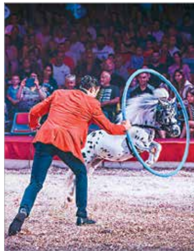
Idén hat pöttös póniló is megmutatja, hogy vannak olyan ügyesek, mint az arab telivérek

Levegőszámok, kutyás produkciók, lovak, pónik és orosz hinta – idén sok-sok izgalmas produkcióval várja a nagyérdeműt a Magyar Nemzeti Cirkusz.