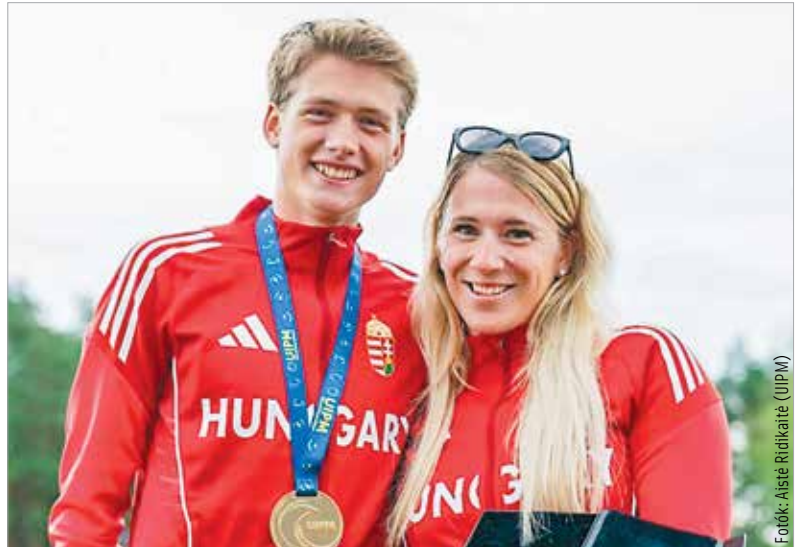
Van kitől tanulni: Szécsi Nemere edzője az olimpiai bronzérmes Kovács Sarolta

a múlt heti, litvániai viadalnak. A Némónak becézett fehérvári öttusázó a Druskininkai városában rendezett U19-es világbajnokságon vívásban, úszásban és az akadálypályán nem tartozott az élmezőnyhöz, így tizenharmadik helyről vágott neki a kombinált lövészet-futás számnak. Ebben viszont ellenállhatatlan volt, olyannyira, hogy végül mindenkit maga mögé utasított. Pedig a mezőny zöménél jóval fiatalabbnak versenyzett, így aztán – ahogy az utánpótlásporthu portálnak adott interjújában mondta – nem is indult nagy elvárásokkal a litvániai világbajnokságon: „A vívás után már lehetett sejteni, hogy az idősebbek között is odaérhetek a dobogóra, mert a kombinált számom elég erősnek számít. Nehéz volt végig koncentrálnom, és bár éreztem, hogy van esélyem az aranyra, nem akartam magam idő előtt beleélni a győzelembe. Végül sikerült megszereznem az első helyet, aminek nagyon örültem! Az edzőmnek, Kovács Saroltának külön köszönöm, hogy tartotta bennem a lelket a nehezebb pillanatokban!” – fogalmazott a Volán Fehérvár immár kétszeres világbajnoka.