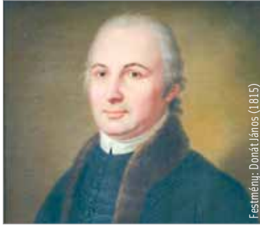
Festmény: DonátJános (1815)

A hol és mikor kérdésekre viszont nehezebb a válasz. A kutatások alapján Nagybjom jött szóba, de az „adott időszakban Virág Benedek nevű gyermeket nem kereszteltek.” Igazából nem is tudjuk, hogy ki kereste így. Ezért tartják valószínűbb-