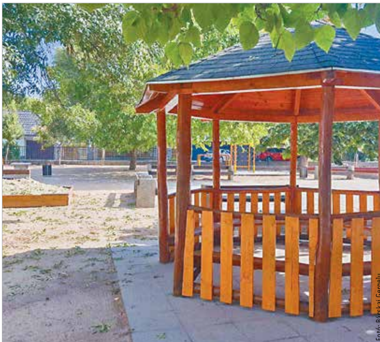
A Hétvezér iskola udvarán is felújították a játszóeszközöket

Az általános iskolák közül a Tánscsicsban a tető, a Sziget utcaiban a csapadékvíz-elvezetés újult meg. A KÉPES-program keretében két iskolaudvar szépült meg a nyáron közel húszmillió forintból – derült ki a Városgondnokság tájékoztatásából. A Hétvezér iskolában a régi, elavult