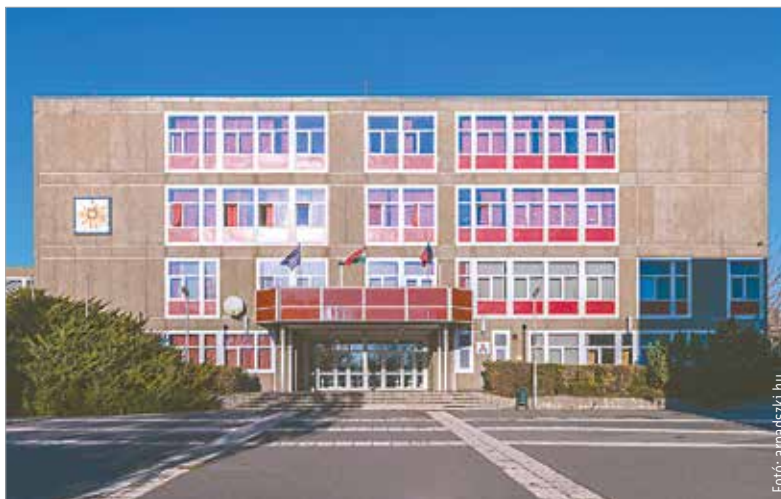
Az Árpád Technikum és Kollégium vízrendszerében már nem mutattak ki fertőzést a múlt heti vizsgálatok

Az elmúlt héten az előzetesen tervezettnél jóval több vizsgálatot tudott elvégezni a Fejérvíz az önkormányzat megbízásából, a teszteleseket pedig folytatják tovább – kezdte tájékoztatását a polgármester. A tesztelt intézményekben a vizsgálatok minden esetben negatív eredményt hoztak – eddig összesen tizenkét helyen. Azoknál az intézményeknél, ahol a nyári zárás alatt kialakulhatott a pangó víz jelensége, a szakemberek szerint indokolt átöblítést végezni, és ha kell, fertőtleníteni is. Ilyen beavatkozásokra is sor került már az elmúlt napokban. A Fejérvíz adatai és egyértelmű tájékoztatása szerint a baktérium nem a város ivóvízhálózatában