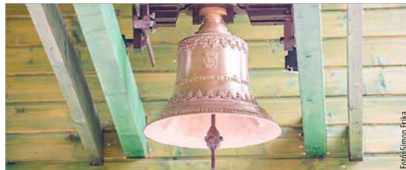
A hívek kifejezték és megerősítették abbéli reményüket, hogy a maroshegyi gyülekezet tovább növekszik, és felépítheti templomát is