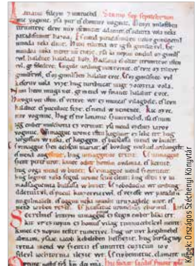
A Halotti beszéd és könyörgés Pray György által felkutatott oldala, mely a Pray-kódex melléklete

is, hogy korábban ilyen dokumentum csak német nyelvterületen maradt fenn.