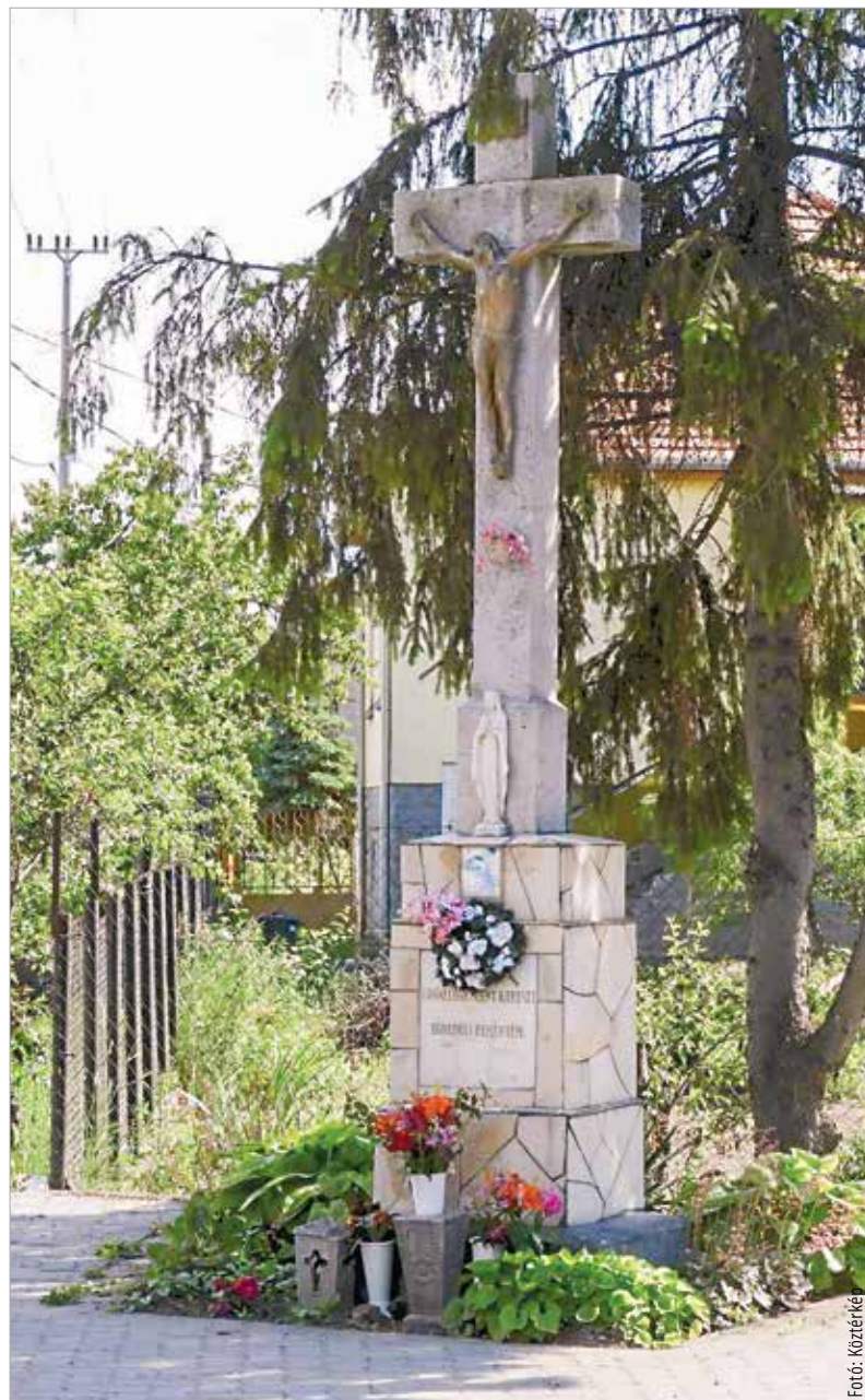
Az eredeti Nagy-Héger-kereszt