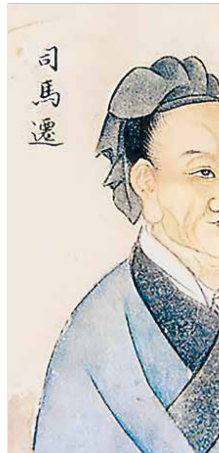
Sze-ma Csien kínai történetíró, csillagász és naptárkészítő Krisztus előtt 86-ig élt

Nyilván volt, de tudja-e valaki, mi volt a szakrális jellege a hármaskoporsós temetkezésnek?