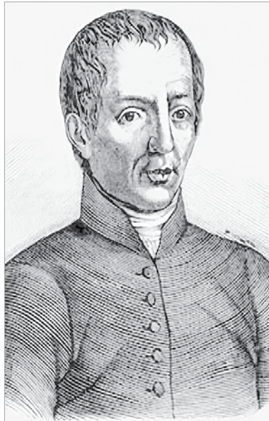
Pray György háromszázkét éve, 1723. szeptember 11-én született Érsekújváron és kétszázhuszonegy éve, 1801. szeptember 23-án halt meg Pesten

Érthető, hogy évszázados hiányosság alakult ki, és csak a török kiverésével kezdődött meg a jezsuita szerzetesek által a legelemibb oktatás. Először a vár falain belül élő katonaságot és a város hívóit kezdték oktatni romokban álló kápolnáknál, mecsetek tövében. A jezsuiták akkori rendfőnöke Vánossy Antal volt, akinek apja a helybéli várkapitány. Vánossy az atyai ezer forint örökséget egy rendház és templom, valamint egy tanoda építésére ajánlotta fel. 1727-től már négy osztályt indítottak a jezsuiták e tanodában, amelyből kinőtt később a főgimnázium