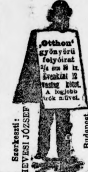
Szerkesztő: HEVESI JÓZSEF Budapest.

Megrendelhető: a Budapesti Napló kiadóhivatalában Budapest, VIII., József-körút 18. szám.