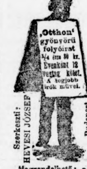
Szerkesztő: HEVESI JÓZSEF Budapest.

Megrendelhető: a Budapesti Napló kiadóhivatala által. Budapest, VIII., József-körút 18. szám.