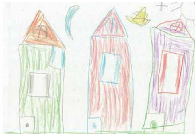
Farkas Gerlőczki Kolos Lakótelepen

László Gyula Gimnázium és Általános Iskola 4. a