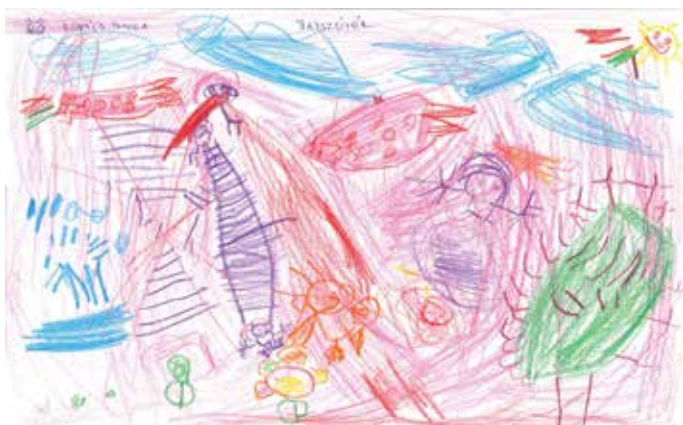
Kovács Imola Játszóter