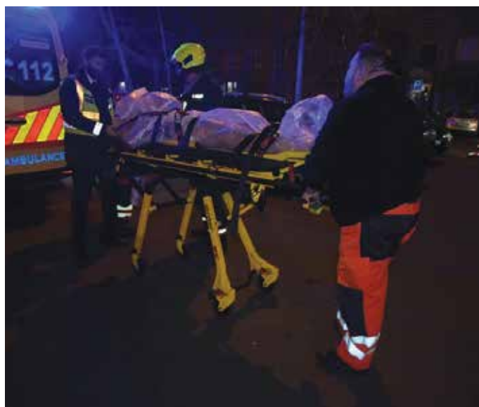
A rendőrök a sérültet sietve egy emelettel lejjebb vitték, ahol rögtön megkezdtek az ellátását.

– Élt, amikor elvitték, és információim szerint azóta is él. Bízom benne, hogy túl fogja élni ezt a balesetet – mondta a rendőr őrmester.