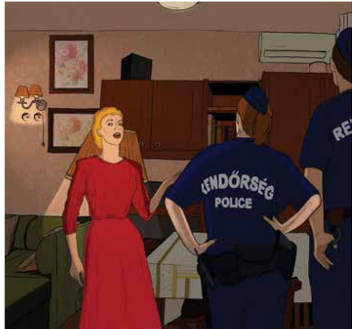
Illusztráció: Varga Tímea

A cím a keresett férfi párjának lakhelye volt. A rendőröknek a nő nyitott ajtót, aki azt állította, hogy nem látta a férfit, és nem is tud a tartózkodási helyéről. A rendőrök ellenőrizték az ingatlant, de a férfit valóban nem találták. Am az egyik körzeti megbízottnak feltűnt, hogy a nő a lakás egy adott pontján jobban és hangosabban artikulált. Olyan volt, mintha nem csak a rendőröknek beszélne. Ezért a körzeti megbízottak azon a ponton újból átvizsgálták a bútorokat, és az egyik mögött egy furcsa, mozgó repedésre bukkantak. Mint kiderült, gipszkartonnal, egy falban kialakított 40-50 cm-es üreget fedtek el. A vájat éppen alkalmas volt egy ember elrejté-