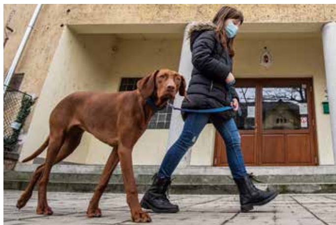
A kutyust olyan személynek kell sétáltatni, aki képes az eb irányítására

Az talán nem annyira köztudott, hogy a vonatkozó szabá-