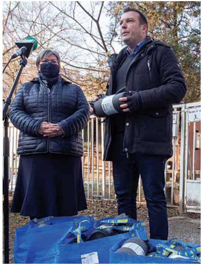
Nappali Melegedő: takarókat kaptak a hajléktalanok