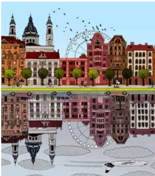
Várják a lakossági véleményeket a fővárosi klímastratégiához

A Klímastratégia és Fenntartható Energia- és Klíma Akcióterv a fővárosi önkormányzat klímavédelmi céljait, teendőit és vállalásait határozza meg annak érdekében, hogy Budapesten legalább 40 százalékkal csökkenjen az üvegházhatású gázok kibocsátása 2030-ig.