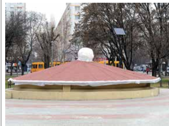
Téliesített üzemmódra kapcsoltak