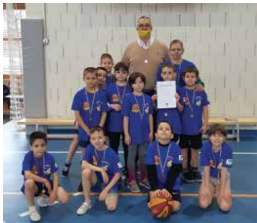
Jó eredménnyel debütált a kis csapat

„A REAC Kosártanoda célja, hogy az alsó tagozatos gyerekekkel megszerettesse a játékot, illetve hogy játékos formában elsajátítsák a kosárlabdázás alapjait. Ezt követően kerülnének majd a gyerekek olyan klubokhoz – remélhetőleg a Budapesti Legyőzhetetlen Feketékhez, akik a kerületben működnek –, ahol már csapatszinten és versenyszerűen kosarazhatnak.”