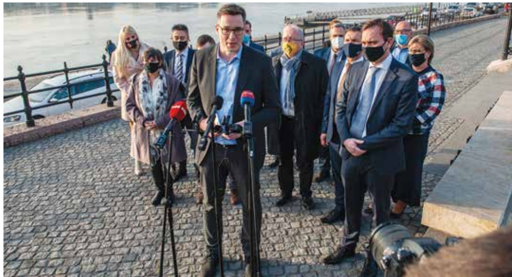
A kerületekkel külön-külön folytatódik az egyeztetés