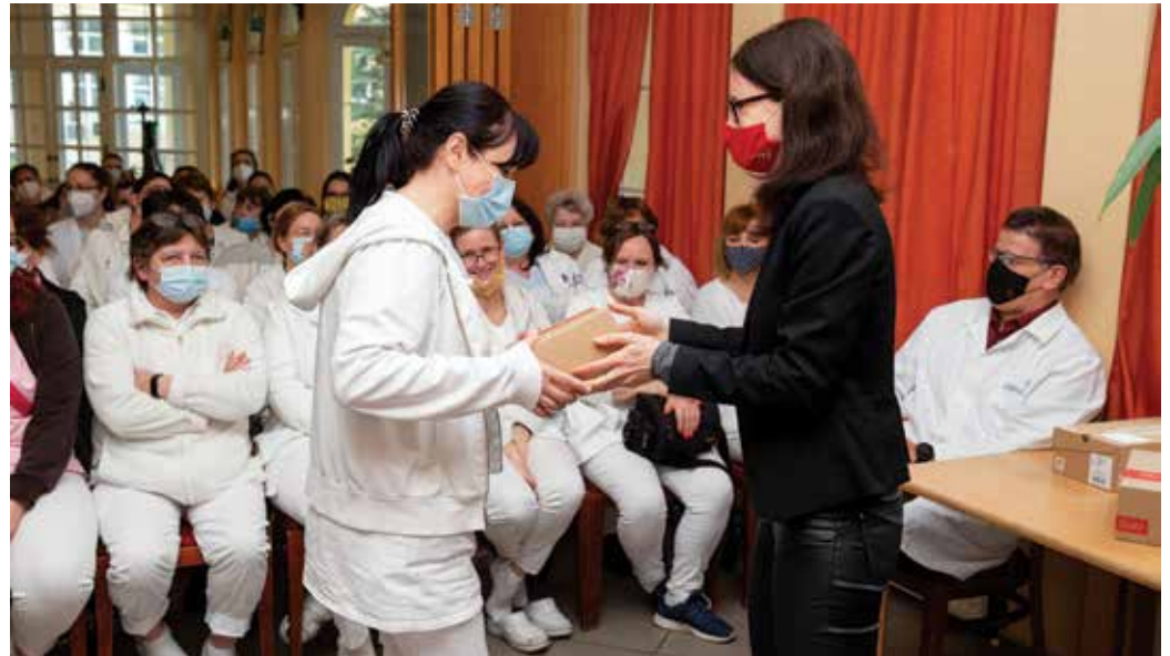
Egyedi ajándékok elismerésül

„Az intézmény ápolói gyakran 15000 lépést is megtesznek egy nap alatt a kórházban”