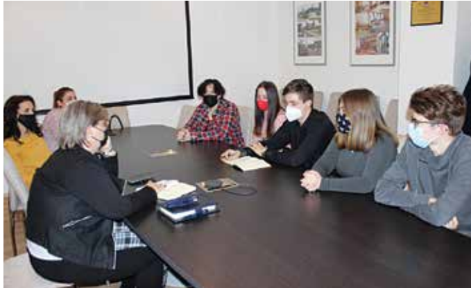
Eszmecsere a digitális oktatástól a nyári táborokig

A fiatalok elmondták, hogyan élnek meg az ismét több hónapja