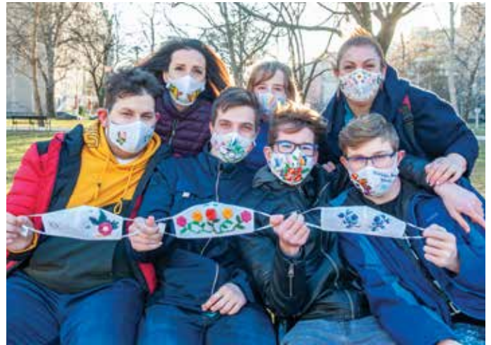
A maszkok megvásárolhatóak darabonként 1500 forintos áron. A befolyt összeget jótékony célra fordítják