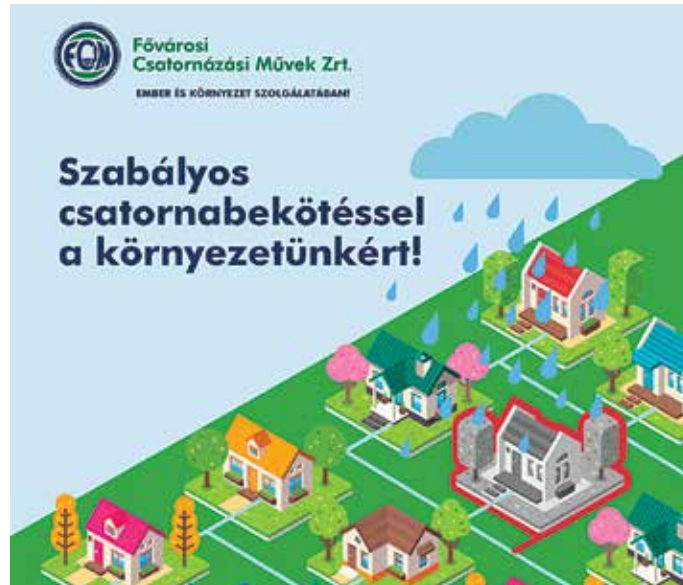
Fokozottan vizsgálják majd a csatornabekötések szabályosságát

„Az ingatlan tulajdonosoknak 2021. március 31-ig van lehetőségük ellenőrzésre, az esetleges illegális rákötések megszüntetésére, vagy ha minden feltétel adott, akkor szabályos eljárás keretében legalizálni a csatlakozást. Ezt követően azonban, 2021. április 1-jétől a