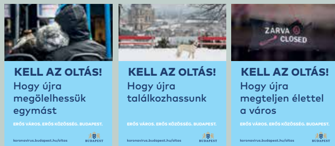
A budapestieket megszólító fővárosi kampány

Összesen 30 ilyen oltópont jöhet létre, ha a kormányzat elfogadja a főváros javaslatait.