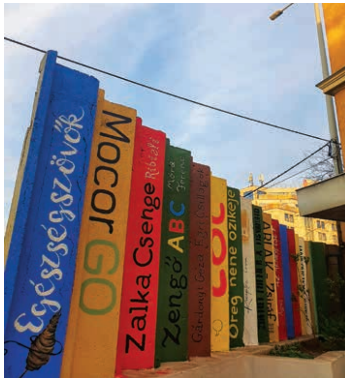
Az új könyvespolcon számos klasszikus és több kortárs író munkája kapott helyet

Az új könyvespolcon számos klasszikus és több kortárs író munkája kapott helyet.