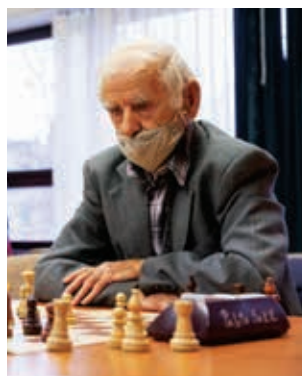
Szellemi erőpróba kilencedszer

A FIDE Rapid Élő-pontszámú verseny is hétfordulós, svájci rendszerű lesz. Ez egy úgynevezett nyílt verseny, melyre bárki, aki 2021. évi versenyengedéllyel rendelkezik, nevezhet. A szervezők a nagy érdeklődésre tekintettel javasolják, hogy a résztvevők a helyszíni nevezés helyett inkább előnevezzenek. Nevezni e-mailben az id.mihalyzoltan@gmail.com címen és telefonon a +36 20