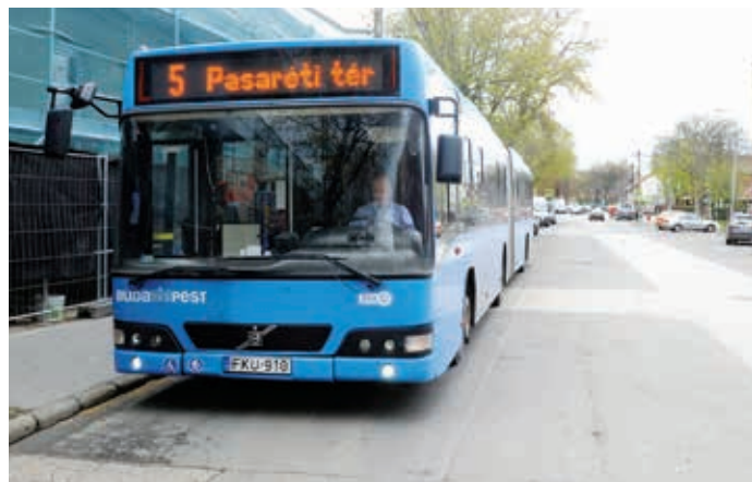
Az új buszvégállomás a Csobogós utca Szilas-patakon túli szakaszára kerülne

Mivel ebben az évben jelentősebb beruházásokra kevesebbet költhet az önkormányzat, így tervek készítésére nagyobb összeget különítettek el a költségvetésben. Ennek keretében idén elkészül az 5-ös buszvégállomás áthelyezéseinek terve is.