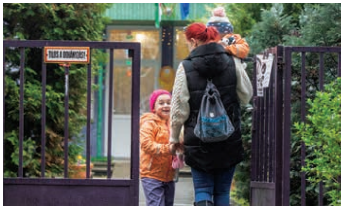
Az óvoda felvételi körzetéről a www.bpxv.hu honlapon lehet tájékozódni

Az integráltan nevelhető, sajátos nevelési igényű gyermekek nevelésére jogosult óvodákról, valamint a felvételi körzeteiről részletesen a www.bpxv.hu honlapon.