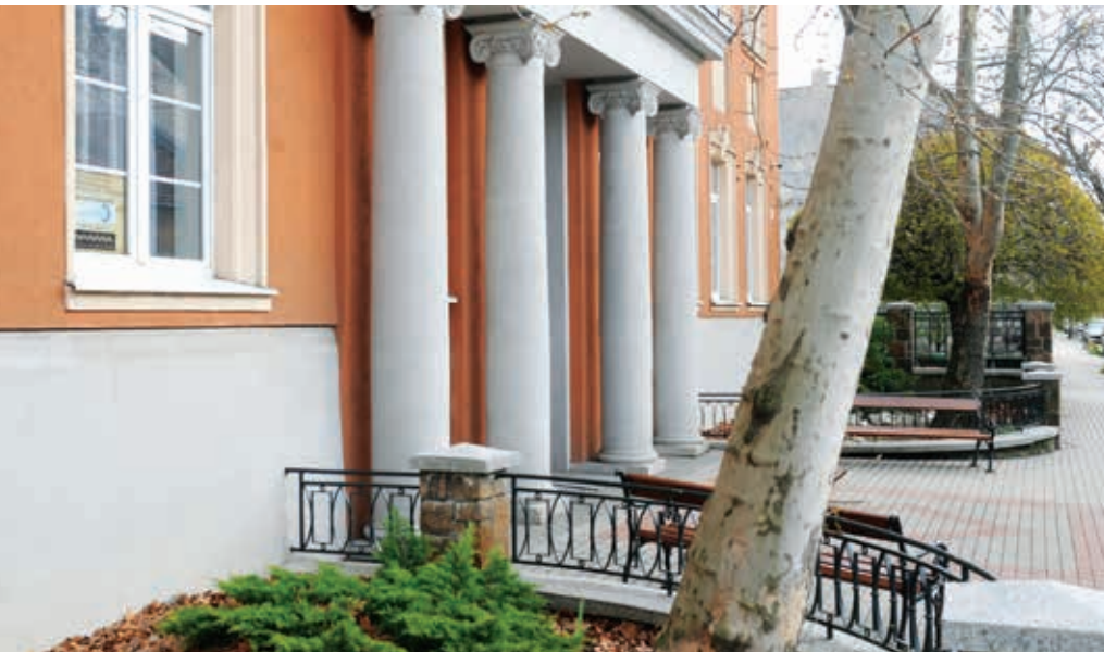
Az iskola honlapján hamarosan elérhető lesz minden fontos tudnivaló a jelentkezéshez