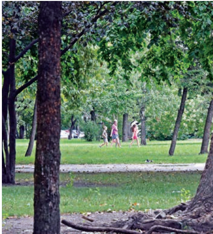
A fővárosi önkormányzat 2030-ig szeretné az egy főre jutó parkterületek mennyiségét a 6 négyzetméterről 7-re növelni

A Radó Dezső Terv a www.budapest.hu -n található meg.