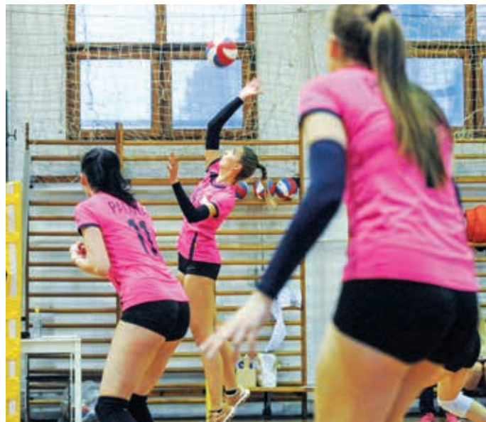
A 3–1-es vereség azt jelenti, hogy a Palota VSN számára véget ért a szezon

ti, hogy a Palota VSN számára véget ért a szezon. A lányok május végéig még levezető edzéseken vesznek részt, majd nyári pihenőre mennek.