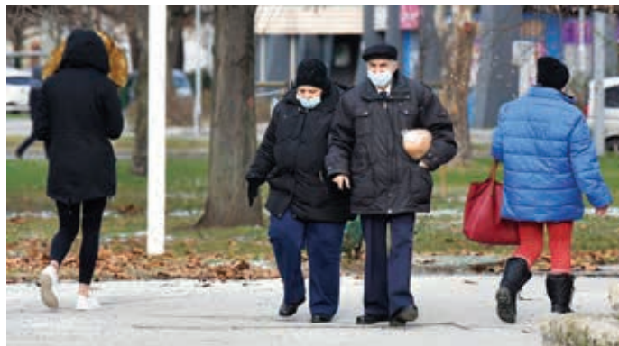
Egyre nő azok száma, akik egyáltalán nem veszik figyelembe az óvítézkedéseket

gal élőknek nem kötelező hordaniuk a maszkot. Állapotukat szakmai szervezetek által kiállított dokumentummal, továbbá orvosi igazolással igazolhatják.