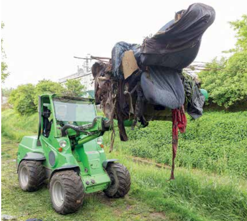
Tizenbét helyszínen történt meg a környezet illegális hulladékoktól való tehermentesítése

Az illegális hulladéklerakás mértéke sajnos az utóbbi években tett erőfeszítések ellenére sem változott