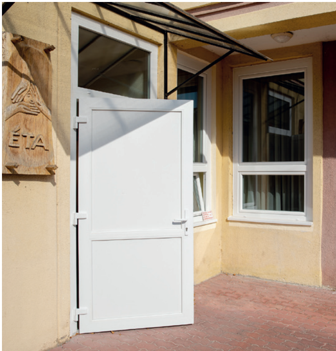
A Molnár Viktor utcai épületrészen az ablakokat cserélték ki