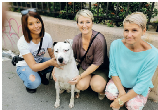
Új otthonra talált a rémült kutyus