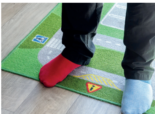
A Felemás Zokni Futammal a Down-szindrómásokért

Az alapítvány célja: a Szent Korona Altalános Iskola nevelési és oktatási programját szolgáló új eljárások kidolgozása, megvalósítása, illetve anyagi háttérének biztosítása.