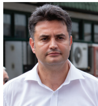
Körzetünk volt az egyetlen Budapesten, amelyben nem Márki-Zay nyert

székhelyeken és a városokban is. Nagy volt a második fordulóban az érdeklődés, az eredmény mégis meglepetés, hiszen a párt nélküli jelölt megelőzte a masszív pártháttérrel rendelkező ellenfelét. Hogy még érdeke-