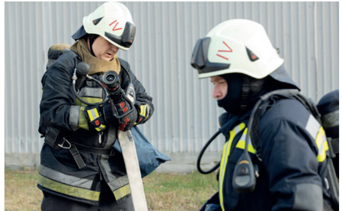
A tréning kettős célt szolgált: az életmentés mellett a protokoll gyakorlását is

Az októberi akció a Károlyi Sándor utcai Medimpex Zrt. területén, veszélyes anyagokat tartalmazó raktárban „volt tűz”, és a mentésben résztvevők az ilyen-