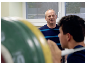
A kerületi szakvezető immár nyolcadik éve edzi a sportiskolás fiatalokat