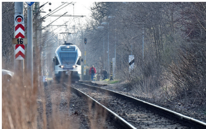
Pestújhelyen új vasúti megállóhely létesül az Erzsébet királyné útja–Kolozsvár utca vonalában

A kormány elfogadta a Budapesti Fejlesztési Központ (BFK) projektjavaslatát és összesen nettó 980 millió forint európai uniós támogatásban részesítette a hiányzó budapesti vasúti megállók előkészítésére indult projektet. Egyedüli ajánlattevőként a szombathelyi HYDRO-ÉP Közmű Tervező-, Szervező és Kivitelező Kft. tervezheti meg a vasúti megállóhelyeket a budapesti körvasúton.