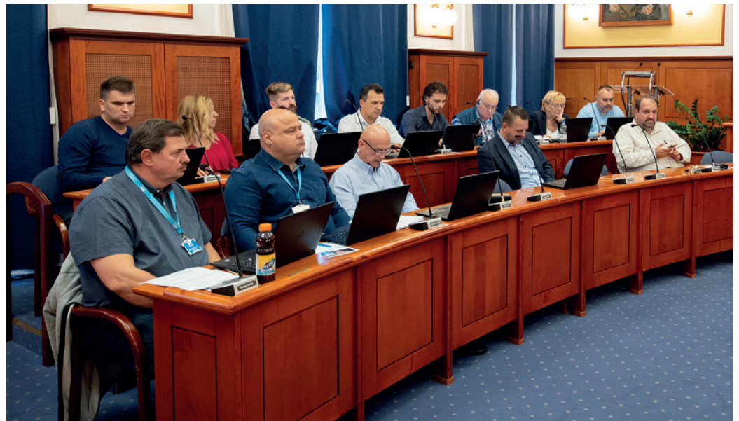
A sokszínű frakciót a 2024-es helyhatósági választásokig kell egybe tartani