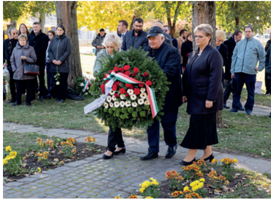
Az emlékezés virágai a rákospalotai emlékműnél

Sportosan kezdődött az idei október 23-i megemlékezés a kerületben. A szokásos 1956 méteres ünnepi futás tavaly, a járvány miatt elmaradt. Ennek köszönhetően, bár 11 éve ez a hagyomány, az idei Emlékfutás csak a tizedik, jubileumi esemény volt.