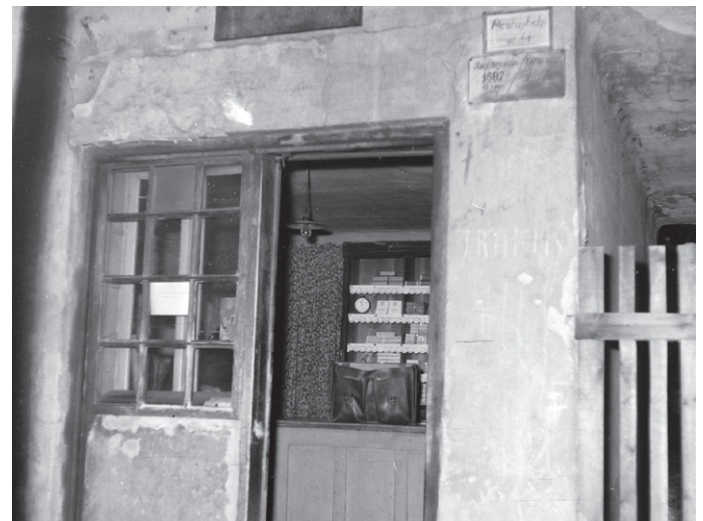
Az óramutató járása szerint balról, felülről Az egykori pestújhelyi Széchenyi (Fuszekli) Filmszínház Újságáros, 1943 Bartha Pál rákospalotai hentes bódéja az Újpesti piacon Pestújhelyi út 4. Délután a férfiak hordták a vizet