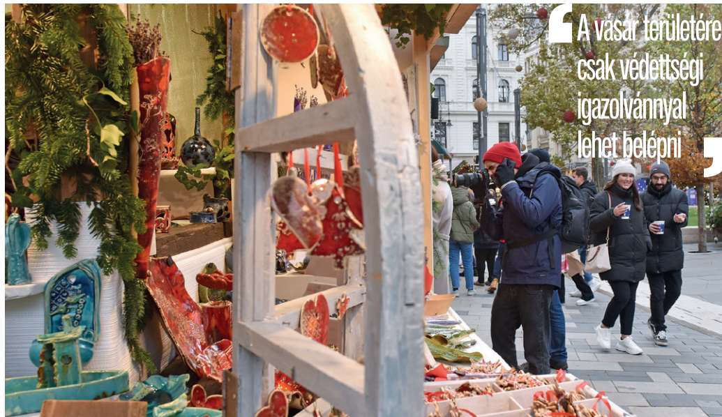
A több mint ötven árust már a nyáron, előzetes pályázatát követően választották ki

Újdonság az is, hogy a rendezvényen már nem kapható olyan állatból készült termék, melyet kizárólag a szőrmeért tenyésztettek.