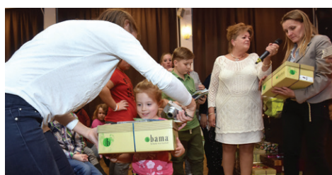
Kerületünkben a Borhy Kertészetben lehet leadni az ajándékokkal megtöltött dobozokat

sőbb december 19-éig lehet eljuttatni a gyűjtőhelyekre, amelyek listája a ciposdoboz.hu oldalon olvasható. Kerületünkben a Szentmihályi és Régi Fóti út sarkán található Borhy Kertészetben veszik át a dobozokat. Mindemellett a Baptista Szeretetszolgálat kibővítette az online dobozolás lehetőségét: játékok, higiéniai eszközök, könyvek vásárlásával vagy pénzadomány küldésével érintésmentesen is lehet adományozni akár a ciposdoboz.hu oldalról elindulva.