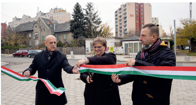
Kulturáltabb környezet közel ezer négyzetméteren