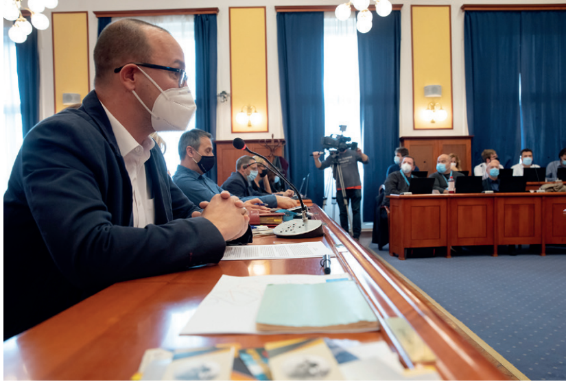
Határozatok születtek a kerületi közművelődési feladatok ellátásának átszervezéséről