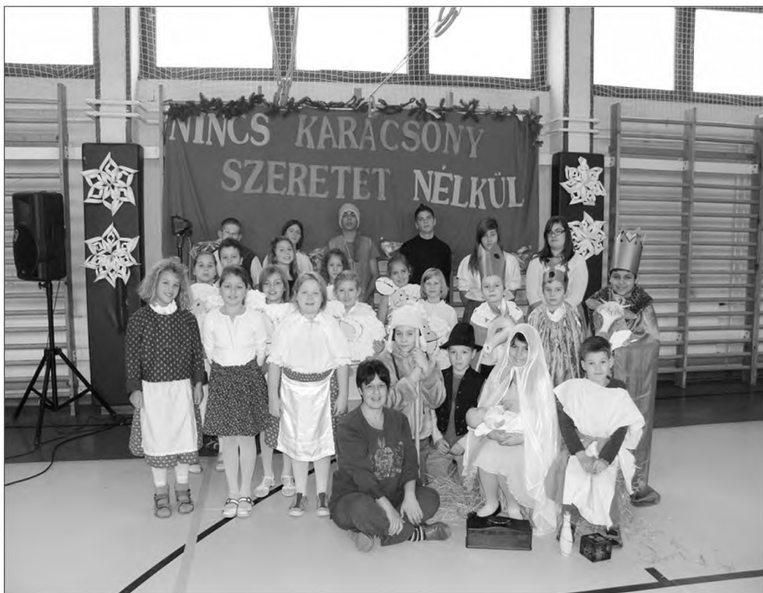
Karácsonyi műsor szereplői

(A beiratkozásokhoz közeledve kérjük az első osztályba lépő gyermekek szüleit is, hogy mielőtt egyértelműen elutasítanák iskolánkat, tájékozódjanak a helyi lehetőségekről, keressék