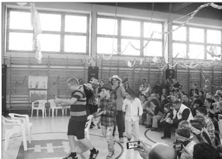
6. osztály műsora

Január 30-án a 3. és 4. osztályosok egy napos kiránduláson vehettek részt Szombathelyen, ahol a Tudás Központjában jár-