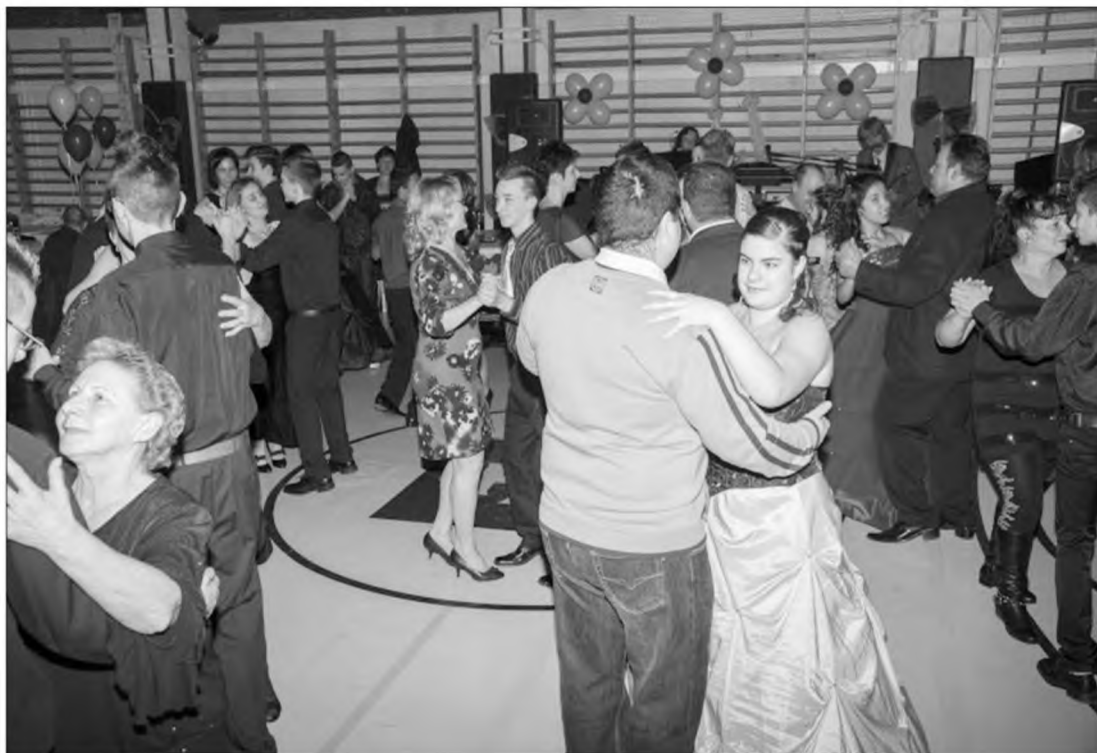
Táncos lábúak csapata