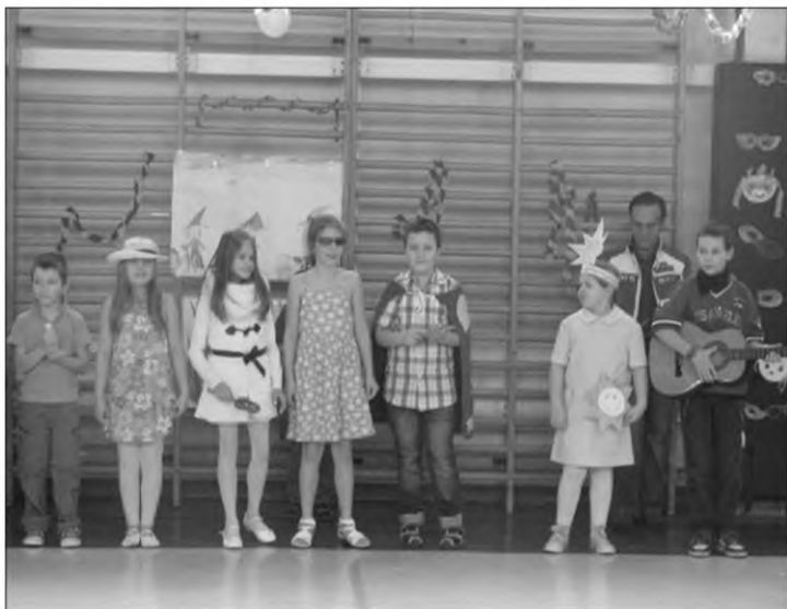
3. osztály produkciója

ma jelentősen csökkent (3 fő bukott), ami úgy gondolom, pozitív eredménynek számít. Egyre több tanulónk érti meg, hogy csak akkor kap jó jegyet, illetve akkor szerezheti meg a minimális kettést is, ha azért a felelős, vagy a dolgozatokban teljesítenek. Mi nem vagyunk hajlandóak leszállítani a színvonalat csak azért, hogy statisztikai adataink szebbek legyenek.