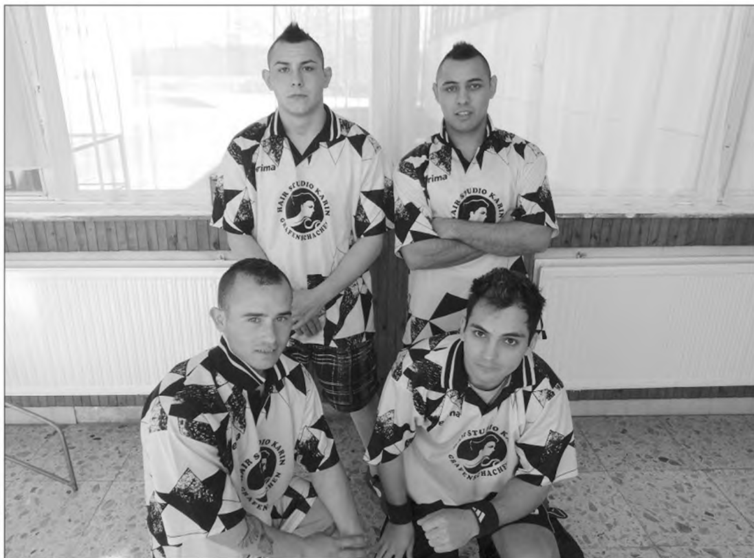
Az ifjúsági felnőtt kategória győztese az FCB csapata

A változó adózási szabályok, az adózók lassan, de biztosan szűkülő köre azt eredményezi, hogy az adó 1%-os felajánlásokból befolyó összeg évről-évre csökken. A magyar adózóknak csak mintegy fele rendelke-