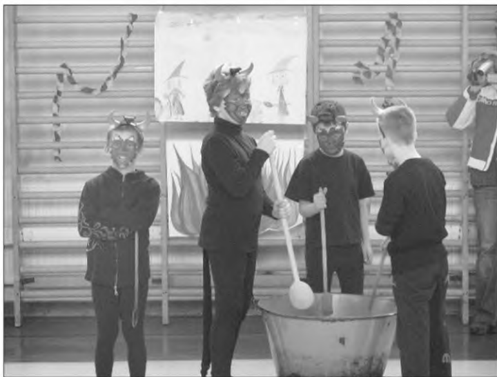
2. osztály műsora

A félév során 6 kitűnő tanulónk volt és 12-en teljesítettek kiválóan (max. 3 négyesük volt), ami nem kis teljesítmény, ismerve a mai iskolai követelményeket. A kitűnő és kiváló tanulók megérdemlik, hogy nevük szerint is megemlítsük őket: