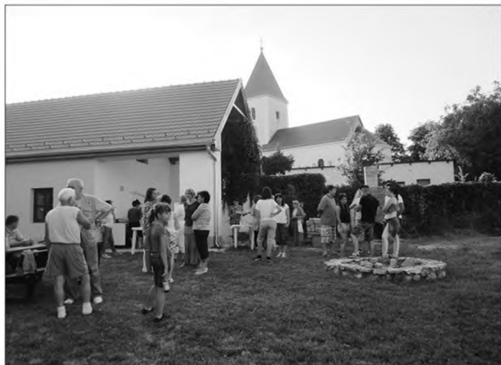
Családi nap és főzőverseny reggelén, a szakadó eső miatt új helyszínen, a Nemzedékek Háza udvarán indult el a program.

Volt a házban veradás, közreműködtünk a Föld Napi akadályversenyben, és helyszínt biztosítottunk számos esemény-