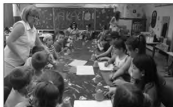
A délutáni kézműves foglalkozás.

A délutáni táborzárás során mindenki elmondhatta, hogy neki melyik volt a kedvenc programja a héten, a gyerekek átvették emléklapjaikat. Az utolsó 10 percben még megtartottuk a kidobó végső visszavágóját.