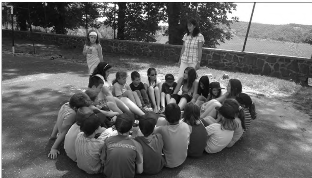
Idén 22 gyermek vett részt a táborban.

Hagyományainkhoz híven Balatonalmádi Szociális Alapszolgáltatási Központ Szentkirályszabadja Családsegítő és Gyermekjóléti Szolgálat és Szentkirályszabadja Község Önkormányzata közös szervezésében megtartottuk 2014. június 17-21. között az Egészséges Életmód Tábor.