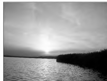
Naplemente a Velencei-tavon