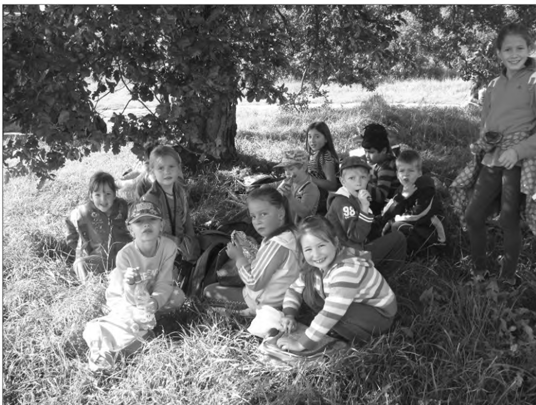
Végre egy kis pihé...