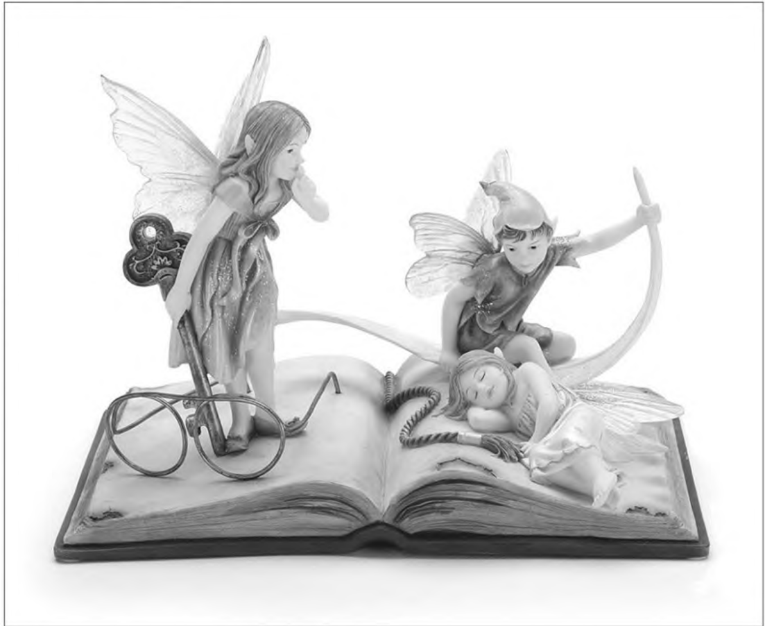
„Aki a meséket megtalálja, az élet forrásából iszik.”

Amikor a kicsi hallgatja a mesét, akkor „belső életének” megfelelően képzelet el a szereplőket. Így nem retten meg a „gonosztól” sem annyira, mintha filmen látná. Egy film ugyanis már nem a gyermek fantáziájáról szól. Ott „készen kapja” a képet, sokszor túl durvát, ijesztőt. Ezért ha teheti, mint szülő, nagyszülő inkább meséljen gyermekének, mint a tévé, laptop elé leültetve DVD-eket nézessen vele. Mit lehet tanulni a mese hőseitől? A mesehősöknek nincsenek múltjuk, az állandó jelenben élnek. Nem tervezgetnek, hanem cse-