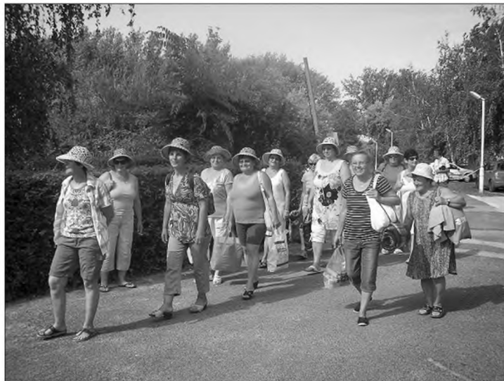
Csak csajos kirándulás a Velencei-tó partján.

Minden összejövetelem bõven van mit megbeszélni, sokan kö-