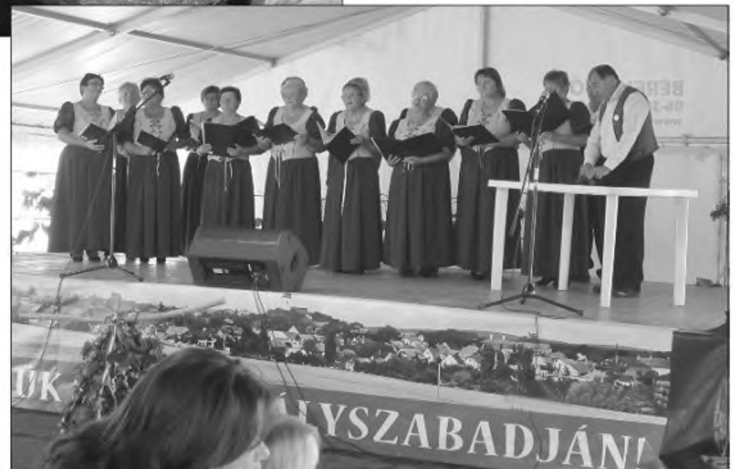
Szent István Népdalkör

Köszönjük mindenkinek a segítségét, támogatást és azt,