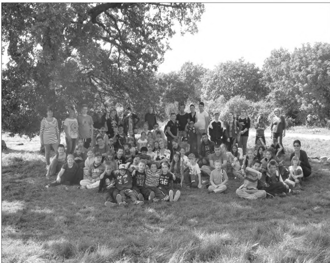
Együtt a csapat...