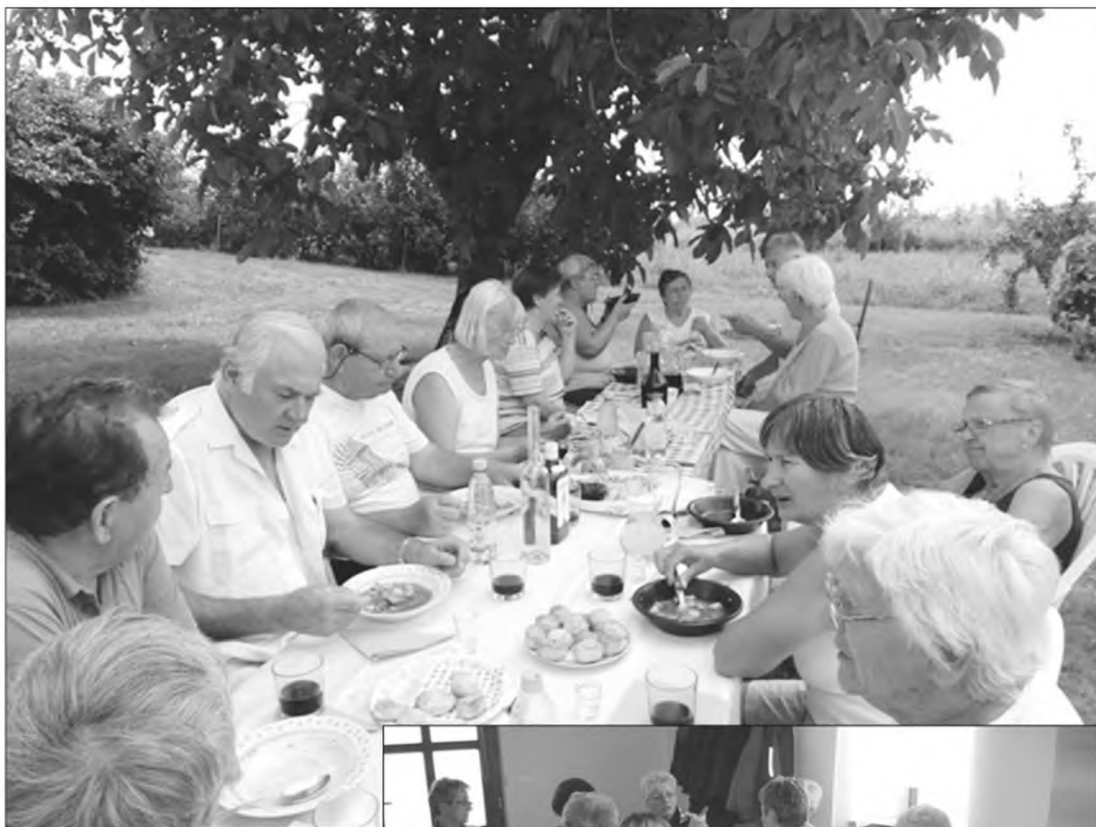
Bogrács parti Csögör Margitkák szőlőjében

December közepén ismét Győrbe mentünk, megtekinteni a fényárban úszó Adventi vásárt. Közben folyamatosan zajlanak benti programjaink is, mint a kézműves, lusta torna és jóga.