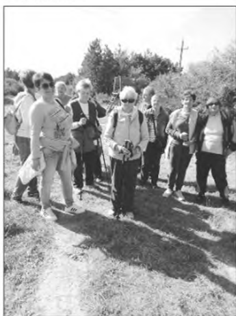
Közös Túra a Nyugdíjas Klubbal a Gyalogló Világnap alkalmából

Rossz idő esetén filmet nézünk, beszélgetünk, társasozunk, kártyázunk. Minden hónapban egyszer lehetőség van a klubban igénybe venni a gyógy pedikűrt, előzetes bejelentkezéssel.