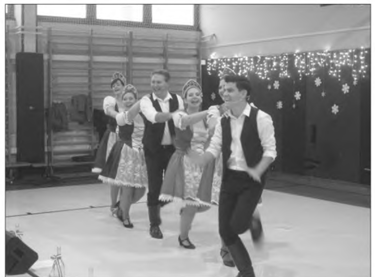
Orfeum musical operett társulat előadása

ris, vagy a medve lakhelyére. Legnagyobb élményt a zsiráfok nyújtották, akik szívesen fogadták a kezünkől kínált finom csemegét. Az állatkerti barangolás befejeztével játszótérrel zártuk a napot. Ez a nap is hamar elröpült, mindannyian alaposan lejárta a lábunkat, de minden fáradságunkért kárpótol