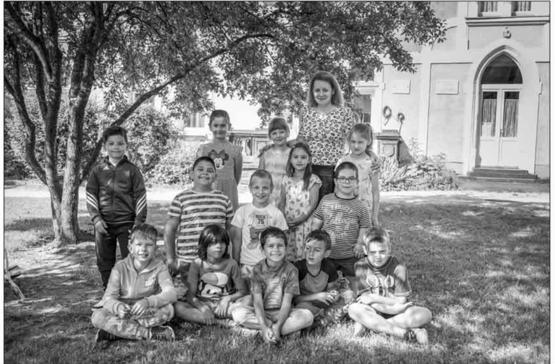
A 2023/24. tanév 2. osztálya; a fényképet Bartókné Barezsa Csilla készítette.

A pedagógusok kedves és határozott szeretettel viszonyulnak a fiunkhoz hasonló eleven, energikus gyerekekhez is, és odafigyelnek egyenként mindenkire. Elérhetőek és nyitottak a kommunikációra. Egy év után azt tudjuk elmondani, hogy a fiunk beilleszkedett, jól érzi magát, rengeteget sportolt és megtanult írni, olvasni, számolni.