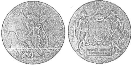
Millenniumi nagy érem a veszprémi Laczkó Dezső Múzeum gyűjteményéből

Az ő tervei alapján hozták még forgalomba az egymillió koronás érmet is.