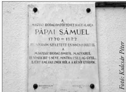
Pápay Sámuel emléktáblája a Faluházban

Iskolái: 1788-89-ben Kassán járt iskolába, atyja korai halála után azonban visszatért Veszprém megyébe. Neveltetéséről a továbbiakban idősebb testvére, Pápay János gondoskodott. Reménytelen anyagi helyzetében Eszterházy Károly egri püspökhöz fordult és elhagyta felmenői hitét, hogy iskoláit befejezhesse áttért a katolikus hitre. Így került a püspök támogatásával előbb Pestre, majd a jogi tanulmányok végzésére Egerbe. Itt két éven át jogi tanfolyamra járt és a magyar nyelv és irodalom tanulmányában is előmenetelt tett. Fővárosi tartózkodása alatt hatást gyakoroltak rá az 1790-es mozgalmas jelenetek. 1793-ban a pesti királyi tábla jurátusa lett. 1796. június 6-án ügyvédi vizsgát tett és június 10-én felesküdt prókátornak. Ezután Pápayra ment és itt vette hírt az Egerben megüresült magyar nyelv és irodalom tanszékének. Pártfogó püspöke 1796. szeptember 12-én ki is nevezte