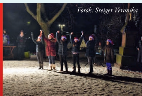
Fotók: Steiger Veronika