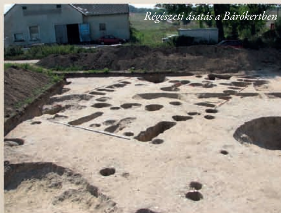
Régészeti ásatás a Bárókertben