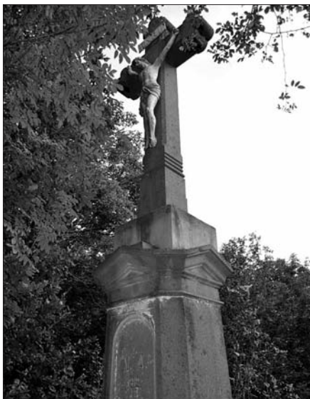
2. ábra: A Szent Kereszt-hegy feszülete

zadon át állhatott, mivel Eötvös Károly a XIX. század derekán még látta megmaradt romjait. Az „Utazás a Balaton körül” című könyvből azt is megtudhatjuk, hogy a palota falainak a köveit a lakosság hordta el kőfalak és házak építéséhez. A palota a közhiedelem szerint a Szent Kereszt-hegyen állhatott, de ezt nem bizonyítják a XVIII. és a XIX. századi katonai térképek és