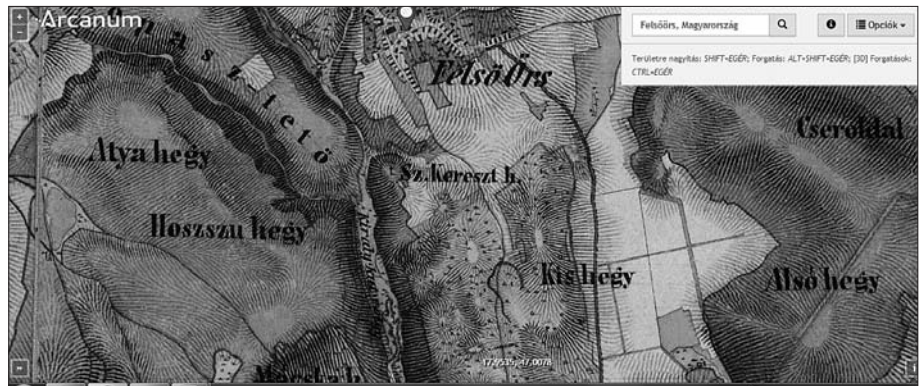
1. ábra: A Szent Kereszt-hegy és annak környezete a XIX. században

A térkép jól mutatja, hogy már a XIX. században is állt feszület a hegy tetején. A most látható permi vörös homokkőből készült kereszt azonban viszonylag fiatal, 1912-ben készült (ld. 2. ábra). Az is megállapítható, hogy a mostani keresztet a helyszínen faragták ki, mivel rengeteg vörös kődarabot és törmeléklet lehet találni körülötte. A terület felszínén kibúvó természetes kőzet azonban nem vörös homokkő, hanem fehér mészkő. A korábbi és a jelen kereszt is észak-dél tájolású. Ahogy régen, úgy most is csak keleti irányból lehet megközelíteni, mivel a hegy északi oldala nagyon meredek. A hely névadója kétségkívül a rajta lévő feszület. A Miske-tető elnevezés a néhai Mike- vagy Miske-palotára utal. A palotát elsőként egy 1299-ből származó okirat említi, amelyben Mátyás örsi nemes eladja palotáját Miskének. Ebben az okiratban Mátyás kiköti, hogy a palota várrá nem alakítható át. A palota sok évszáz-