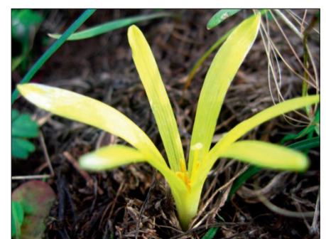
3. Apró vetővirág (Sternbergia colchiciflora) a Forrás-hegyen lévő sziklagyepen