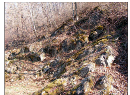
2. A forrás-hegyi alapszelvény fedetlen része (Megye-hegyi dolomit és Felsőörsi mészkő)