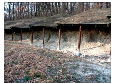
1. Forrás-hegyi geológia bemutatóhely fedett része