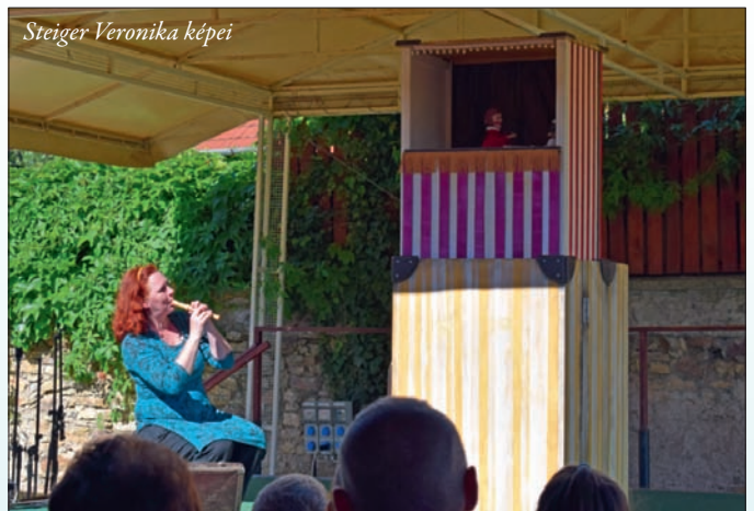
Steiger Veronika képei