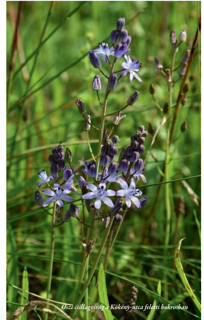
Őszi csillagvirág a Kökény-utca feletti bokrosban