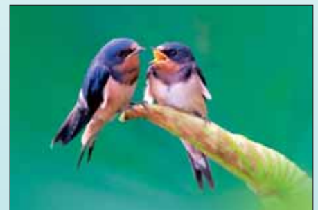
1. Füstí fecske