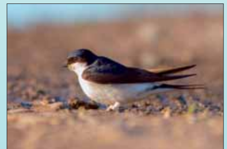
2. Molnár fecske