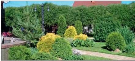
Az örökzöld fajokkal teli, fűvesített kert tetszetős, de állatfajokban rendkívül szegény.

A tudomány jelenlegi állása szerint, az ember által okozott, jelentős mennyiségű légköri széndioxid többlet kivonásának leghatékonyabb és legolcsóbb módja: a fásítás. A fák növekedésük során rengeteg szénket kötnek meg a törzsükben és gyökereikben. Ez a folyamat addig tart, amíg a fa el nem hal. A lágyszárú növények a szén megkötésében jóval kisebb mértékben vesznek részt, mivel csak a gyökereik halmoznak fel szén, míg a föld feletti részeik hamar elbomlanak. Ennek fényében a klímabarát kert fákban sűrű, míg gyepe az árnyék miatt gyér. A gyér gyepszint abban is klímabarát, hogy a fűnyírásal járó szén-dioxid kibocsátás lecsökken (évi kb. 10 fűnyírás helyett elég lehet akár egy-kettő is.).