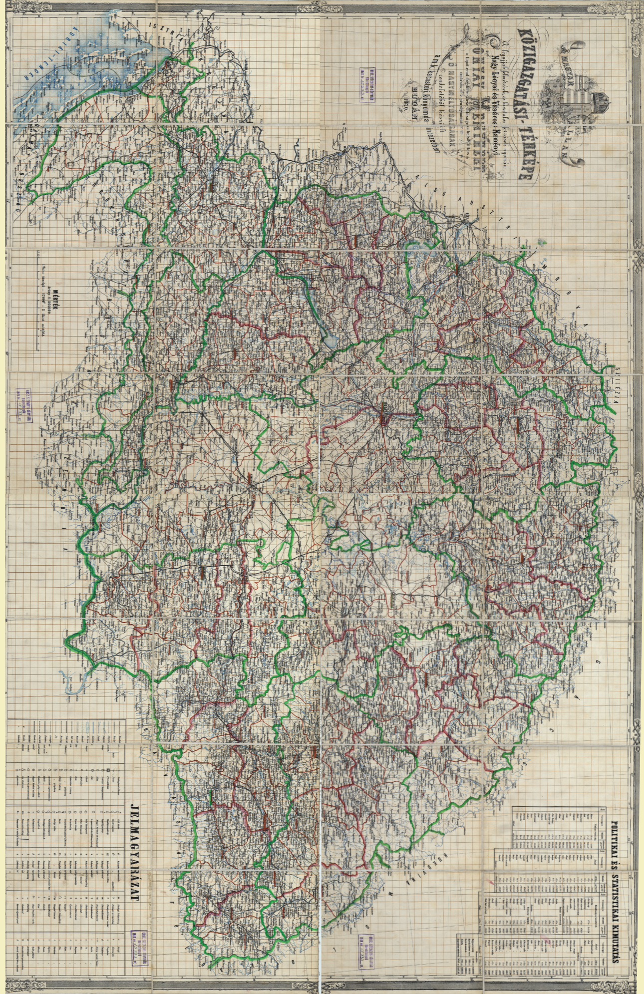
3. A Magyar Állam közigazgatási-térképe: a legújabb felmérések, és hivatalos források nyomán Nagy Lónyai és Vásáros Naményi Lónyay Menyhért a Lipót-rend nagykeresztése, valóságos belső titkos tanácsos, m. k. pénzügyminister úr ó nagyméltóságának rendelkezéből / tervezte és rajzolta Hátsék Ign. m. k. térképész; köbe vésetett Haslinger Josef és Matzsek Károly műszaki iroda tisztek által; készült a M. K. Katasteri Könyvnyomda Intézetben. – 1:864 000. – Budán: M. K. Allamny., 1870. – 1 tétk. (4 szelv.); könyvnyomtatás; színes; 39 x 60 cm – OSZK TM 6 169, TM 6 171