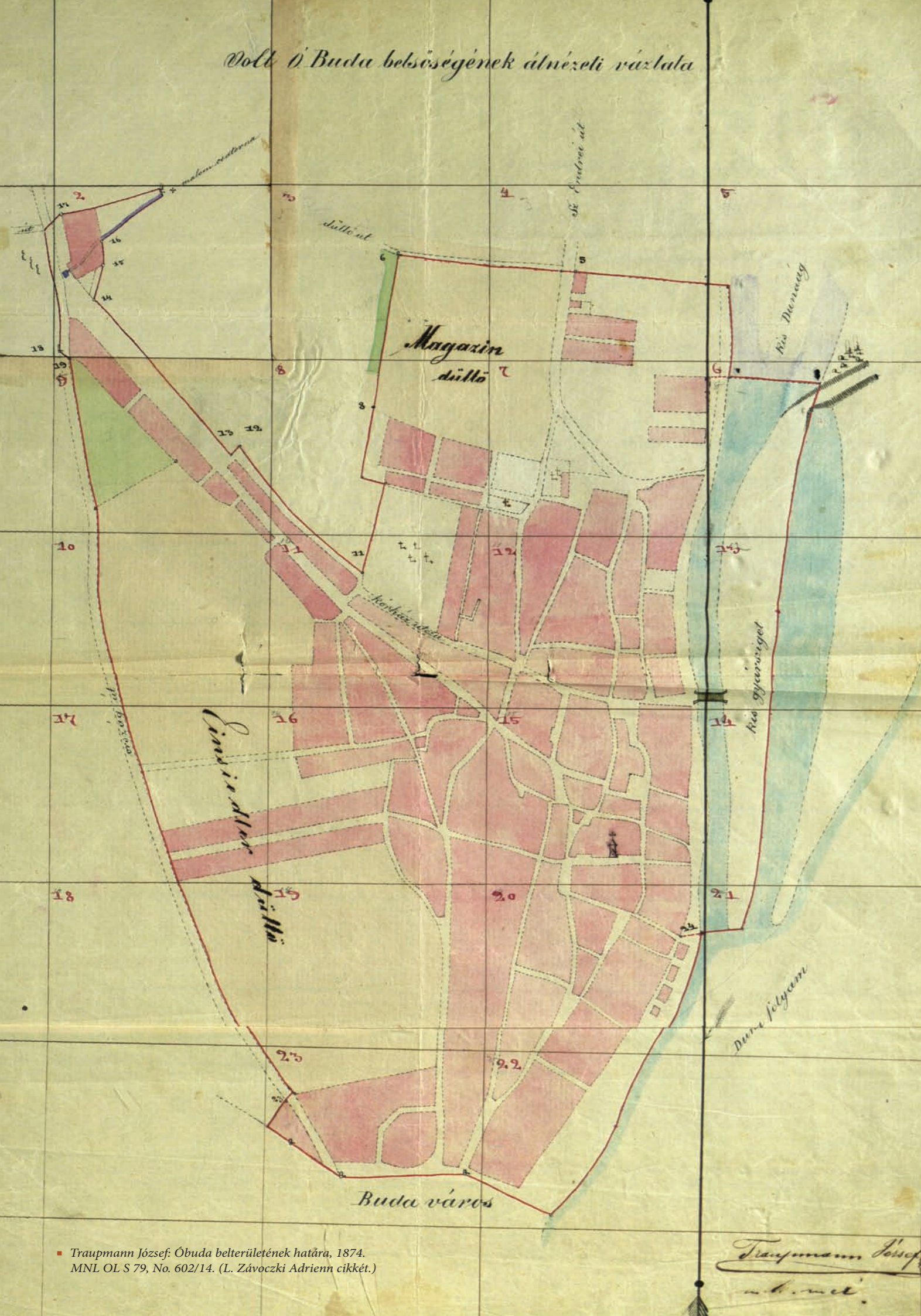
■ Traupmann József: Óbuda belterületének határa, 1874. MNL OL S 79, No. 602/14. (L. Závocski Adrienn cikkét.)