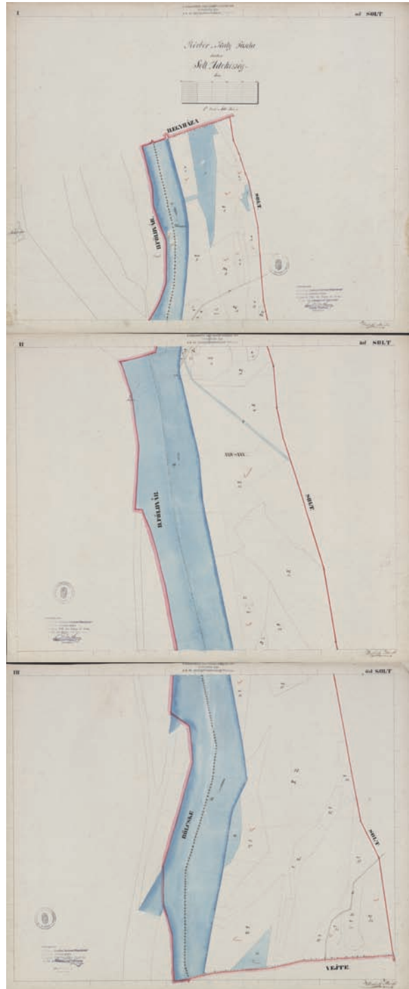
■ Mesterfy Márton: Solt konkrétális térképének melléktérképe, 1855 (OSZK Térképtár, K 1 172, A 21–23.)

A befejezett térképet a mérnök csak a számítások, jegyzőkönyvek elkészítéséig tartotta magánál, utána a „kataszter-ülnök-felügyelőnek” adta át. 12