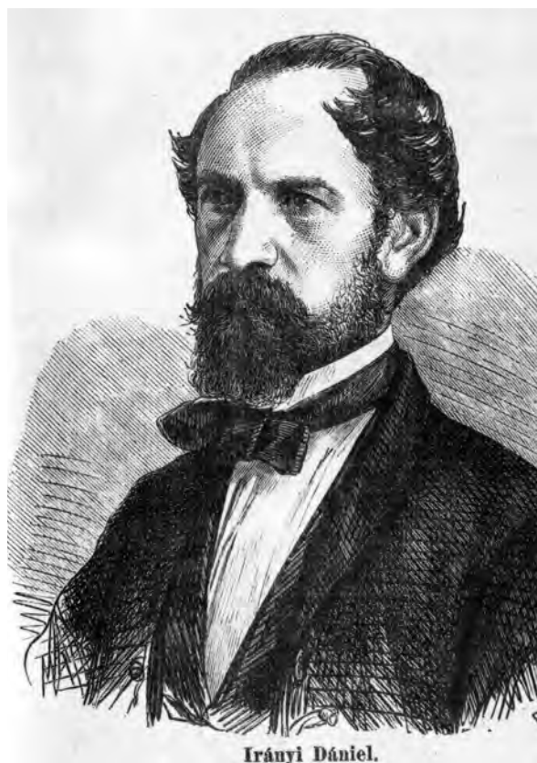
■ Irányi Dániel (1822–1892) publicista, sürgette az igazságos adóalap megteremtését

ahol a feliratban kért időszak szerint a búzánál 7,6, a rozsnál 14, az árpánál 14,5, a zabnál 6,8, a kukoricánál pedig 11,5%-kal magasabb értékek jöttek volna ki a jelenleg érvényben lévőnél. Irányi Dániel (Békés) minderre úgy reagált, hogy nem az a feladat, hogy olyan átlagot határozzanak meg, amely az államkincstárnak vagy az adózóknak kedvezőbb, hanem hogy az adónak egy biztos és igazságos alapot találjanak. Ehhez – véleménye szerint – az 5 évnyi átlag kevés, és legalább 9-10 évnyi átlagot kellene alapul venni. Példaként említette Franciaországot, ahol a 10 éves átlag kiszámításánál mellőzik a legjobb és a legrosszabb évet, és a fennmaradó 8 év alapján számolnak. 28