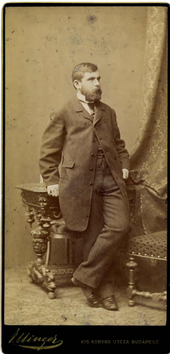
■ György Endre (1848–1827) földművelésügyi miniszter, közgazdasági író, az MTA levelező tagja. Szorgalmazta az ártéri és a kataszteri telekkönyvek összehangolását

Az 1871:XXXIX. törvénycikk módosítása során, 25 május 23-án György Endre halmi képviselő felvetette, hogy a legideálisabb az lenne, ha már a telekkönyvekből minden vevő és hitelező tájékozódhatna a földbirtokra vonatkozó