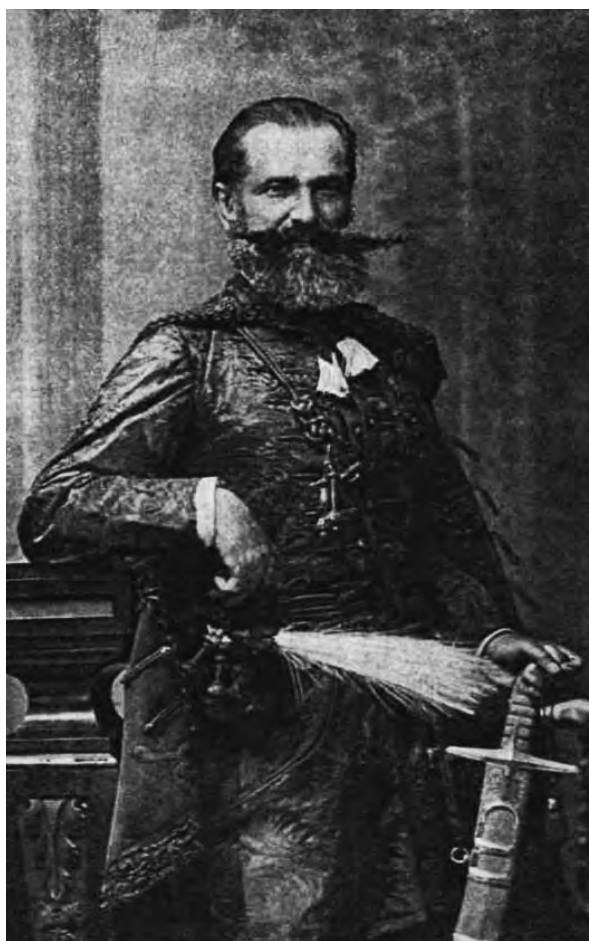
■ Orbán Balázs (1829–1890) író, néprajzi gyűjtő, az MTA levelező tagja