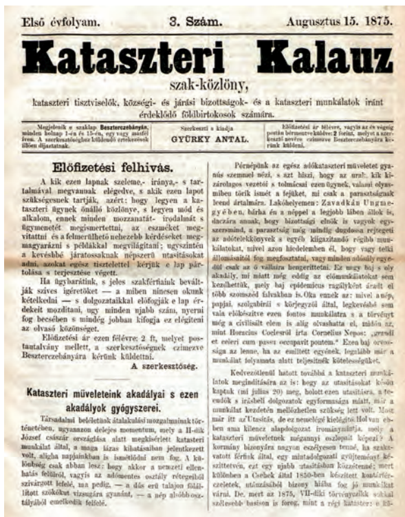
■ A Kataszteri Kalauz 1875. évi 3. számának címlapja