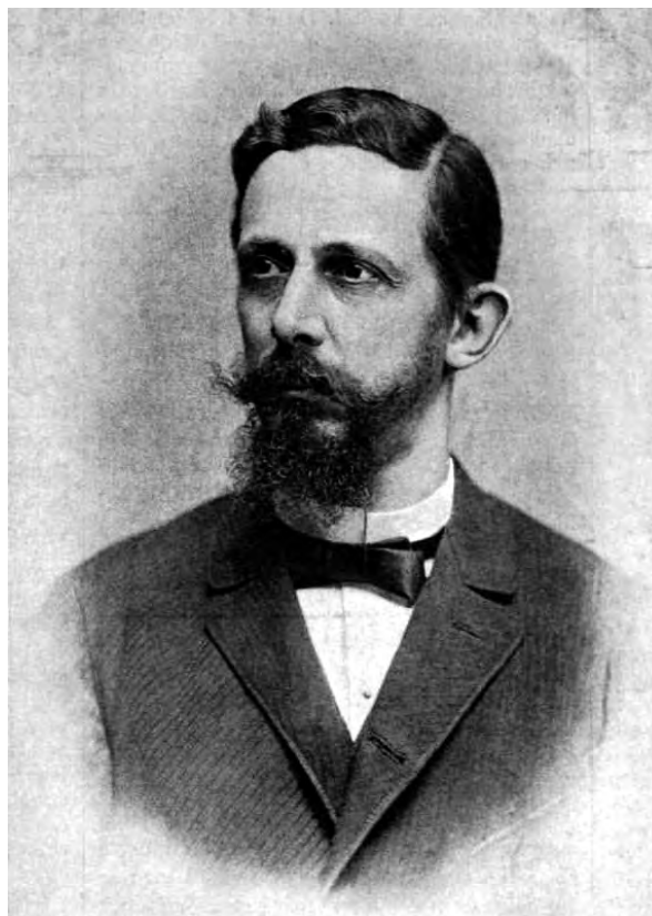
■ Pulszky Ágost (1846–1901) jogfilozófus, szociológus. A kataszteri ügyekben a Pénzügyminisztériumot a törvény megszegésével vádolta

látvány az igazgatás körében, mint minőt a kataszteri törvény végrehajtása elénk tár, (Igaz! – a baloldalon) mindazon bizonytalanságok, mindazon kapkodások, melyeket éppen az utolsó másfél év óta a Pénzügyminisztériumban tapasztalunk [...]? Mit mondjunk azon eljárásról, melyet a jelenlegi pénzügyminiszter alatt tapasztaltunk fokozott mérvben, mely a kataszteri törvény végrehajtásában nyomról nyomra eltér