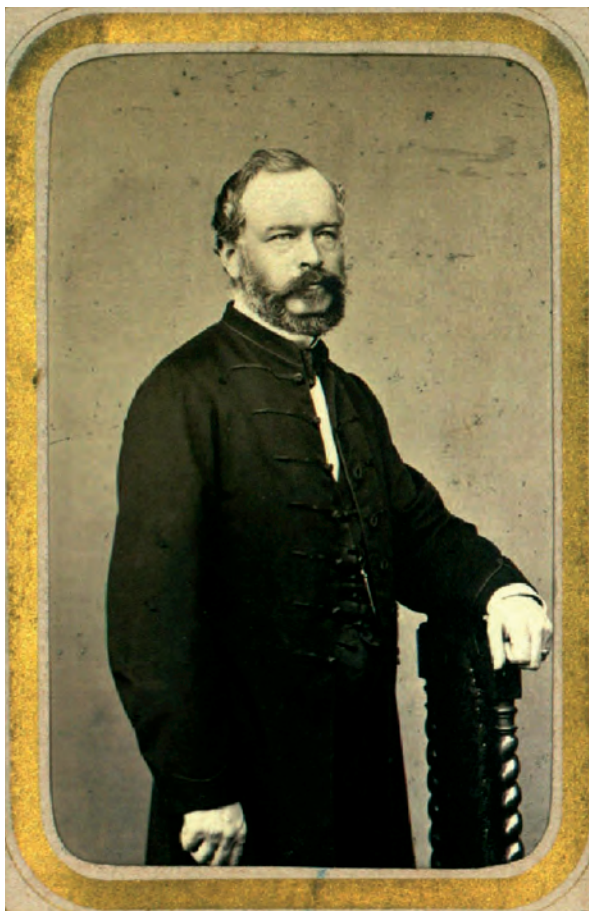
■ Lónyay Menyhért (1822–1884), számos magas állami tisztség betöltője, az állandó kataszter Erdélybe vitelének támogatója