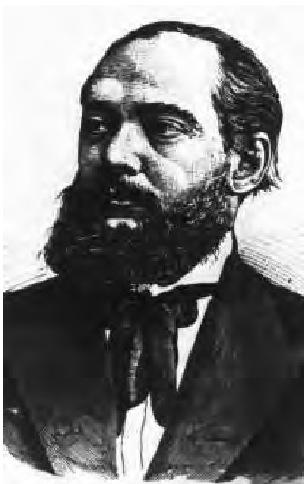
■ Eötvös Károly (1842–1916) ügyvéd, író, publicista, a kataszteri ügyek kíméletlen bírálója

Lukács Béla Eötvös vádjaira azt válaszolta, hogy bár az eddig történtek valóban okot szolgáltatnak a bírálatokra, ezek nem viszik előbbre a kataszteri munkálatokat, ezért ő a törvényjavaslatot általánosságban véve elfo-