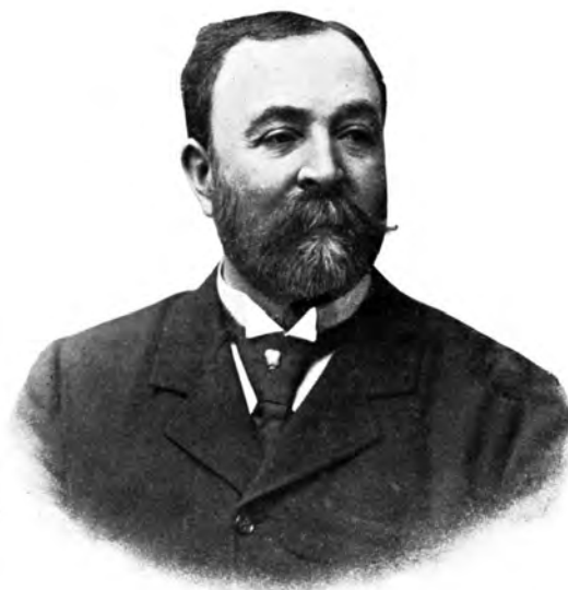
■ Ugron Gábor (1847–1911), a túlzott kataszteri adminisztráció egyik bírálója 13

„ Hisz akik annyira éllhetetlenek voltak, hogy semminemű hivatalhoz nem jutottak, azoknak most megnyittattak a kataszter sorompói. Újabb és újabb hivatalok csak azért szerveztetnek, hogy azoknak, kik már rászorulnak, hogy az állam által tartassanak ki, újabb és újabb konkokat lehessen odadobni, s ezen erős szervezet által az országban oly többség produkáltassék, amely a nemzet óhajainak és kívánságainak nem felel meg. ” 11 Eötvös Károly (Veszprém) Ugronhoz hasonlóan epés megjegyzéseket tett a lapokban mindennap olvasható „ egy hadsereg létszámát megütő ” kinevezésekről, amelyek a kataszteri osztályban történek. 12