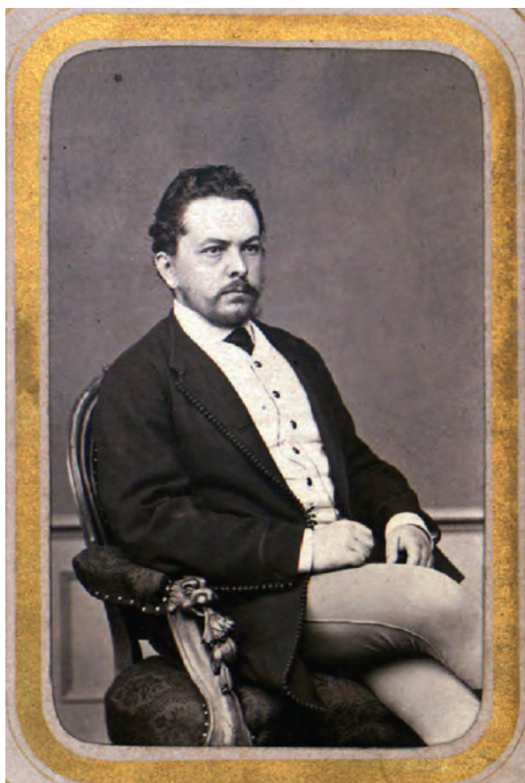
■ Szapáry Gyula (1832–1905) pénzügyminiszter

elképzelései köszönő viszonyban sem voltak bírálóiéval. Szapáry Gyula pénzügyminiszter például az 1881. évi földadó-szabályozás költségvetési vitáján a kataszteri állomány további bővítése mellett érvelt, mondván: azért alkalmaznának egyes vidékeken évi 900 forintos fizetésért tisztviselőket, hogy a kisebb jelentőségű kataszteri munkákat elvégezzék, nélkülük ugyanis ez a feladat is a járási becslőbiztosokra hárulna, amely így nemcsak hosszabb ideig tartana, de drágább is lenne, hiszen ők évi 2000 forintot keresnek. Így azzal érvelt, hogy a több ember alkalmazásával még spórolhat is az állam, hiszen ez csupán évi 300 000 forint többletköltséggel jár, és ha a segítségükkel a munkák egy évvel előbb befejeződnek, ez 2 000 000 Ft nyereséget jelent. 14