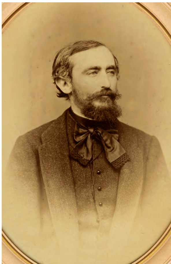
■ Tisza Kálmán (1830–1902) miniszterelnök–belügyminiszter, az állandó kataszter Erdélybe való áttételének ellenzője

dig, amíg az állandó kataszteri munkákat nem fejezik be Erdélyben, és ezek alapján a telekkönyvek létre nem jönnek, addig a tagosítási munka megakadna: szerinte sokkal praktikusabb lenne Magyarországhoz hasonlóan Erdélyben is községenként haladni, és ha egy községben befejezték a tagosítást, akkor rájuk vonatkozóan készítenének telekkönyvet, de a tagosítási-felmérési munka a többi községben ettől még folytatódhatna. Lónyay és Ugron javaslatát Szabely Antal is támogatta. Tisza Kálmán miniszterelnök azonban egyáltalán nem értett egyet Ugron Gábor határozati javaslatával, felhívva a figyelmet arra, hogy az ideiglenes kataszteri felmérés Erdélyben a földadó-kataszterról szóló törvény értelmében folyik, így törvényi rendeletet határozati javaslattal megszüntetni nem